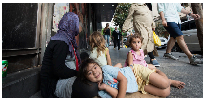
ความเป็นอยู่ตามยถากรรมของผู้ลี้ภัยริมถนนในกรุงเบรุต ประเทศเลบานอน

ภาพแม่ที่มีลูกเล็กๆ 3 คน ต้องมานั่งรอคอยความช่วยเหลือกลางเมืองเบรุต เป็นภาพที่สะเทือนใจพ่อแม่ทุกคน พวกเขาเฝ้ายกกล่องกระดาษเพื่อรองนั่งเด็กน้อยหน้าตามอมแมม 3 คน ไม่มีที่วิ่งเล่น คนหนึ่งกำลังนอนหลับกลางวันอยู่บนถนน ซึ่งในขณะที่ผู้คนเดินผ่านไปผ่านมาแต่พวกเขาทั้ง 4 กลับเหมือนไม่มีตัวตน เรายังไม่ออกเลยว่าสถานที่เดียวกันนี้ในเวลากลางคืนจะอันตรายต่อเด็กและผู้หญิงตัวคนเดียวมากเพียงใด