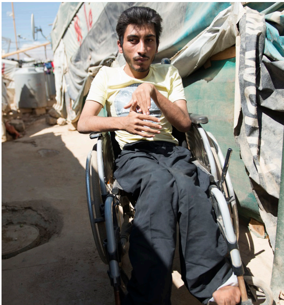
รอมฎอนต้องใช้รถเข็นในการเดินทางในพื้นที่พักพิงชั่วคราว ณ หุบเขา เบกกา