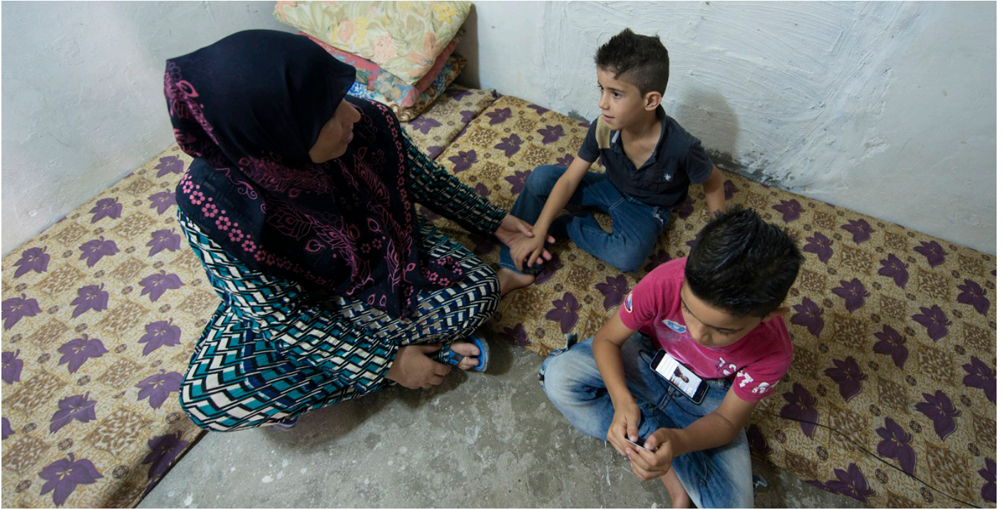
ดาลาล และลูกที่ได้รับผลกระทบทางจิตใจในบ้านพักที่ได้รับการสนับสนุนจาก UNHCR