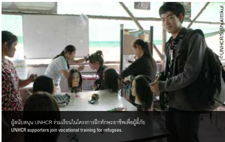
ผู้สนับสนุน UNHCR ร่วมเรียนในโครงการฝึกทักษะอาชีพเพื่อผู้ลี้ภัย UNHCR supporters join vocational training for refugees.