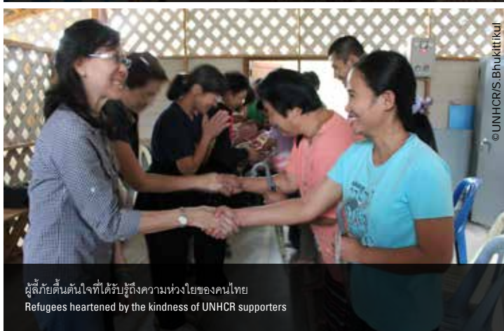
ผู้ลี้ภัยตันใจที่ได้รับรู้ถึงความห่วงใยของคนไทย Refugees heartened by the kindness of UNHCR supporters