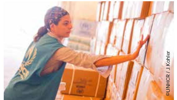
เจ้าหน้าที่ UNHCR เตรียมแจกจ่ายเครื่องครัวแก่ผู้ลี้ภัยชาวซีเรียในค่ายผู้ลี้ภัย Za'atari Kitchen sets ready for distribution in Za'atari refugee camp, Jordan.

ความขัดแย้งในประเทศซีเรียยังคงรุนแรงต่อเนื่อง ส่งผลให้กว่า 2 ล้านคนกลายเป็นผู้ลี้ภัย และกว่า 4.25 ล้านคนพลัดถิ่นในประเทศตนเอง ที่น่าสลดใจไปกว่านั้นคือกว่าครึ่งคือเด็ก และผู้หญิง พวกเขาบอบช้ำและใช้ชีวิตอยู่ในความกลัว เด็กๆ ต้องออกจากโรงเรียน หลายคนสูญเสียพ่อแม่ ผู้หญิงต้องกลายเป็นหัวหน้าครอบครัว UNHCR ยังคงทำงานอย่างต่อเนื่องเพื่อให้ความคุ้มครองพวกเขาทั้งในประเทศซีเรีย และประเทศใกล้เคียง รวมถึงการสร้างค่ายผู้ลี้ภัย และแจกจ่ายอุปกรณ์ยังชีพ เช่นที่นอน ผ้าห่ม ผ้าอ้อมสำหรับเด็ก และเครื่องครัวกว่า 5.5 ล้านชิ้น อย่างไรก็ตาม UNHCR ยังขาดเงินทุนสนับสนุนอย่างมาก การช่วยเหลือที่ยิ่งใหญ่ในครั้งนี้จะเป็นจริงไม่ได้หากไม่มีการสนับสนุนจากท่าน โปรดบริจาคเพิ่มเติมที่ www.unhcr.or.th