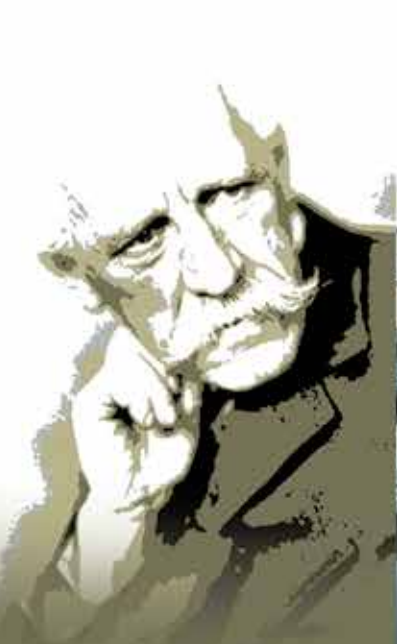
ฟริตฮอฟ นานเซน