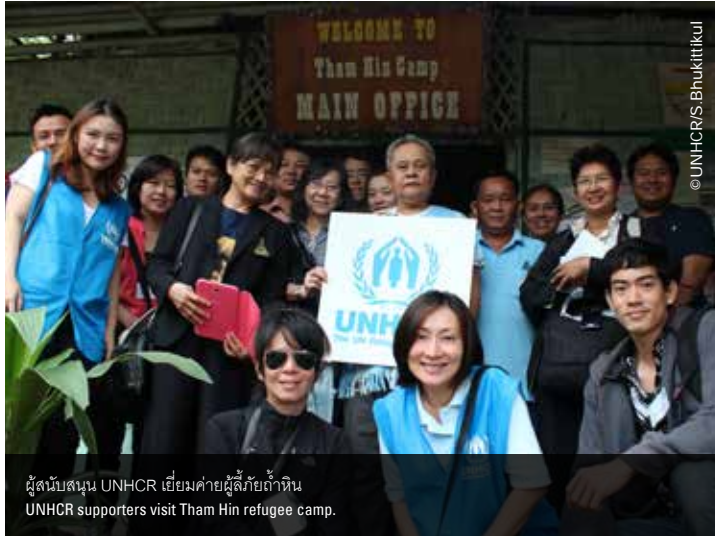
ผู้สนับสนุน UNHCR เยี่ยมค่ายผู้ลี้ภัยถ้ำหิน UNHCR supporters visit Tham Hin refugee camp.

On 7th November 2013, eleven selected UNHCR supporters visited Tham Hin refugee camp to experience the lives of refugees. After the visit, the supporters understood the difficulties and challenges that refugees are facing. More importantly, they learned that they have changed thousands of lives with their long term support.