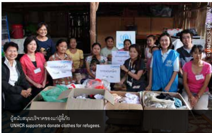
ผู้สนับสนุนบริจาคของแก่ผู้ลี้ภัย UNHCR supporters donate clothes for refugees.