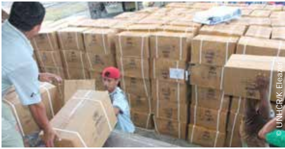
UNHCR ลำเลียงความช่วยเหลือเพื่อแจกจ่ายให้ผู้ประสบภัย Aid being offloaded to provide to the survivors in the Philippines.