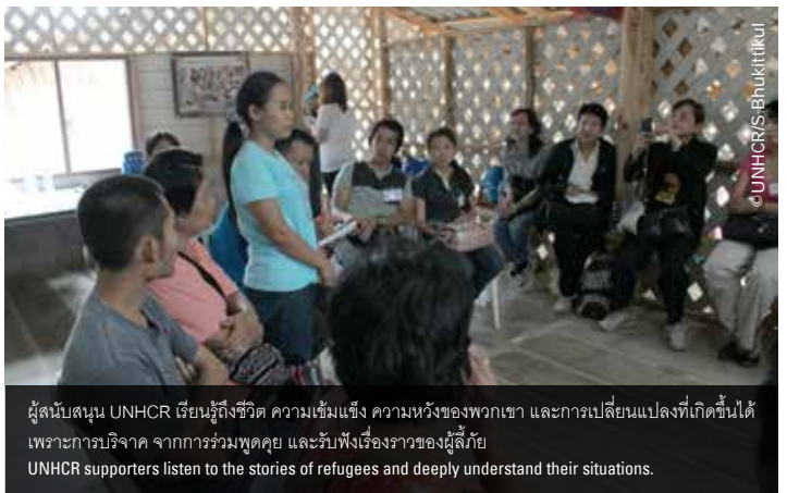
ผู้สนับสนุน UNHCR เรียนรู้ถึงชีวิต ความเข้มแข็ง ความหวังของพวกเขา และการเปลี่ยนแปลงที่เกิดขึ้นได้ เพราะการบริจาค จากการร่วมพูดคุย และรับฟังเรื่องราวของผู้ลี้ภัย UNHCR supporters listen to the stories of refugees and deeply understand their situations.