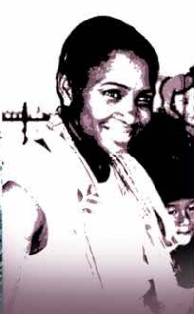
บาร์บารา เฮนดริกส์