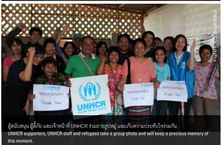
ผู้สนับสนุน ผู้ลี้ภัย และเจ้าหน้าที่ UNHCR ร่วมถ่ายรูปหมู่ และเก็บความประทับใจร่วมกัน UNHCR supporters, UNHCR staff and refugees take a group photo and will keep a precious memory of this moment.