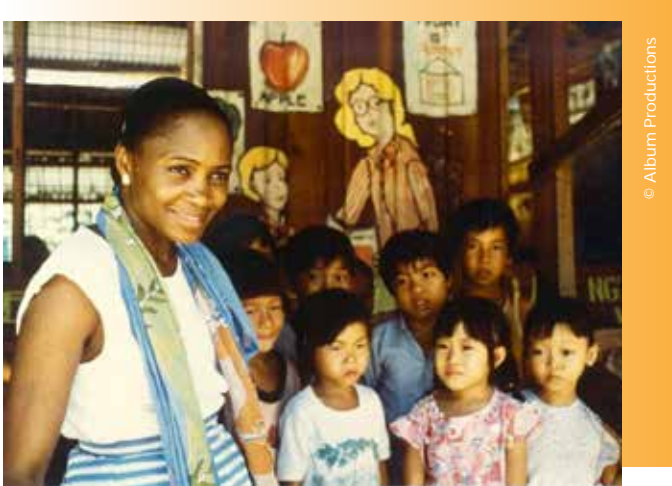
บาร์บารา เฮนดริคส์ ทูตสันถวไมตรีกิตติมศักดิ์ตลอดชีพ UNHCR เยี่ยมชาวเวียดนามที่ลี้ภัย ทางเรือที่ เกาะ Pulau Bidong ประเทศมาเลเซียในปี 1988 UNHCR Honorary Lifetime Goodwill Ambassador Barbara Hendricks visiting Vietnamese boat people on the island of Pulau Bidong in Malaysia, in March 1988

นักร้องโซปราโนและทูตสันถวไมตรีกิตติมศักดิ์ ตลอดชีพของ UNHCR