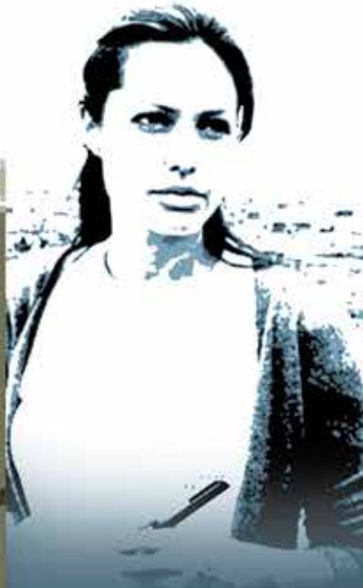
แองเจลินา โจลี