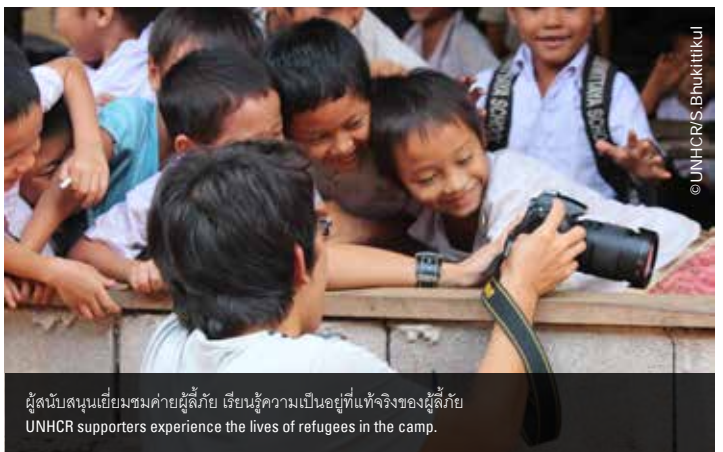
ผู้สนับสนุนเยี่ยมชมค่ายผู้ลี้ภัย เรียนรู้ความเป็นอยู่ที่แท้จริงของผู้ลี้ภัย UNHCR supporters experience the lives of refugees in the camp.