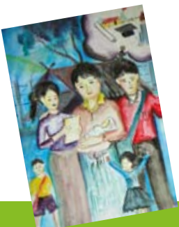
ภาพหน้าปกโดยเด็กผู้ลี้ภัยจากค่ายผู้มเปี่ยม จ.ตาก