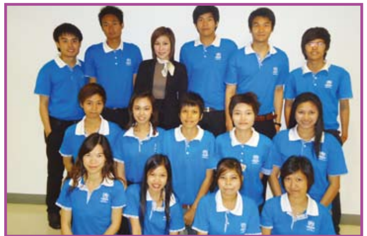
ทีมพนักงานระดมทุนในภูเก็ต