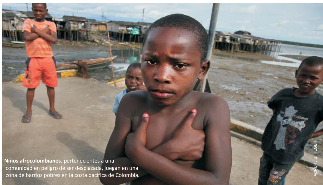
Niños afrocolombianos, pertenecientes a una comunidad en peligro de ser desplazada, juegan en una zona de barrios pobres en la costa pacífica de Colombia.

A pesar de los esfuerzos del Gobierno por revisar el enfoque de los desplazamientos internos y mejorar la respuesta a las víctimas del conflicto, la implementación de nuevas medidas, incluido el Proyecto de Ley de Víctimas y Restitución de Tierras, está aún socavado por la presencia de grupos armados ilegales,