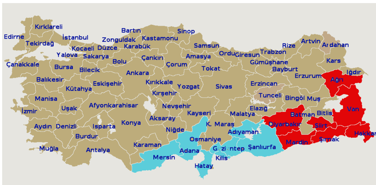
Carte des provinces turques 144

La plupart des combats ayant causé des victimes tant militaires que civiles ont eu lieu dans les provinces de Diyarbakir (en particulier dans les districts de Sur et Lice de la ville de Diyarbakir et à Silvan), Mardin (en particulier à Nusaybin), et surtout à Cizre dans la province de Sirnak 143 .