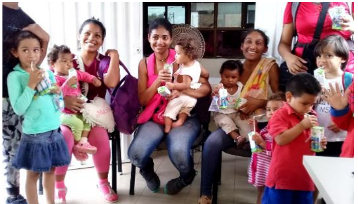
Venezolanos recibiendo orientación y asistencia alimentaria en el Punto de Orientación y Atención en Paraguachón, La Guajira.