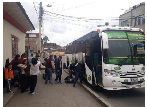
Asistencia en transporte a los venezolanos llegando a Ipiales.