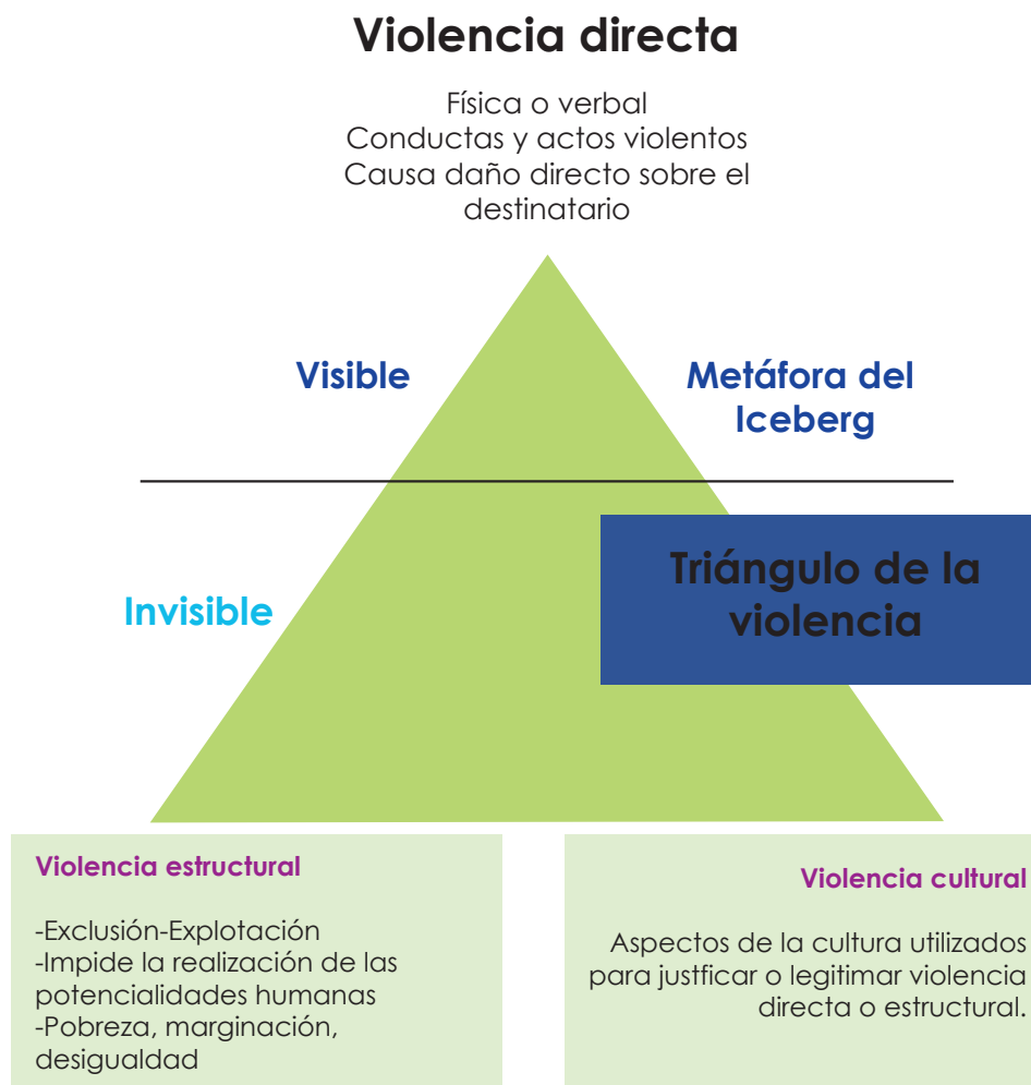
Figura 1 Dimensiones de la violencia

cultural, por su parte, se define “como cualquier aspecto de una cultura que pueda ser utilizada para legitimar la violencia en su forma directa o estructural” (Galtung, 2016, p. 147). Esta violencia hace que las otras dimensiones no sean percibidas como violentas y sean aceptadas y normalizadas en las sociedades.