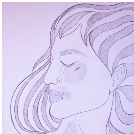
Dibujo 2 Impactos de la violencia contra las mujeres

Las maneras de entender la violencia sexual no solo varían de acuerdo con las definiciones legales previstas en los códigos penales, sino también de acuerdo con las culturas, al grupo social o económico, la religión, la institución a la que se pertenezca. Sin embargo, de manera general, es importante develar que en el lenguaje común (como fue confirmado en las entrevistas), la violencia sexual tiene un entendimiento limitado que lo vincula particularmente (y a veces exclusivamente) a la violación sexual. Sin embargo, este trabajo investigativo entiende la violencia sexual de una forma amplia como “todo acto sexual, la tentativa de consumar un acto sexual, los comentarios o insinuaciones sexuales no deseados, o las acciones para comercializar o utilizar de cualquier otro modo la sexualidad de una persona mediante coacción por otra persona, independientemente de la relación de esta con la víctima, en cualquier ámbito, incluidos el hogar y el lugar de trabajo” (OMS, 2011). A pesar que la violencia sexual es cometida contra hombres y mujeres, un gran número de estudios coinciden en que mientras las más afectadas son estas últimas, los principales agresores pertenecen al sexo masculino (OMS, 2013).