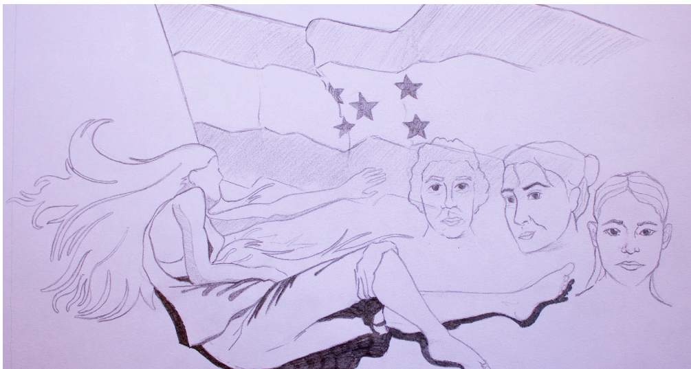
Dibujo 3 Femicidio en Honduras

Adicionalmente, y sin desconocer los avances en materia de la tipificación penal del femicidio y de un mayor entendimiento del femicidio, los niveles de impunidad continúan siendo alarmantes. Que siete años después de haberse penalizado este crimen (2013), solo hayan 15 sentencias condenatorias es una señal de alerta de los altos grados de impunidad y del poco entendimiento de las autoridades judiciales sobre estos crímenes (Herrera, 2020). 38 Adicionalmente, la gran proporción de femicidios sin determinar en los sistemas de registros debido a la falta de investigación y datos de las entidades responsables, llevan a que hoy en uno de cada cuatro femicidios no haya certeza sobre sus móviles (UNAH -IUDPAS, 2012- 2018).