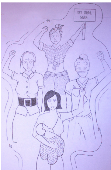
Dibujo 5 Perfil representativo

identificar cuando determinadas características o roles incrementan los riesgos de sufrir diversos tipos de violencia, así como el riesgo de desplazarse.