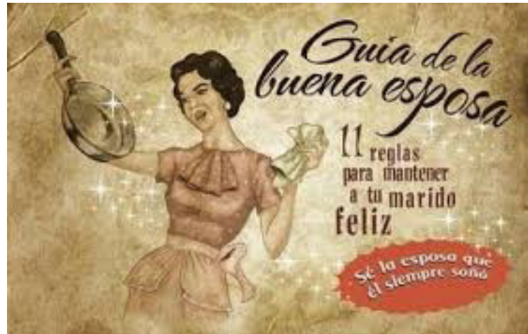
Figura 2 Violencia simbólica

En el caso de las mujeres indígenas la situación es aún más preocupante, puesto que las dimensiones de la violencia se intersectan con diversas formas de discriminación como su etnia y sus bajos niveles socioeconómicos (CIDH, 2011b, pp. 28–32). De esta forma, la violencia estructural se profundiza aún más, mostrando índices más precarios de acceso a servicios básicos, a la justicia y oportunidades para acceder a un empleo digno si se comparan con otros grupos de población (Foro Internacional de Mujeres Indígenas, 2012). Es así como a los obstáculos propios que tienen las mujeres en los casos de violencia se le suma las prácticas de discriminación por su razón de su etnia.