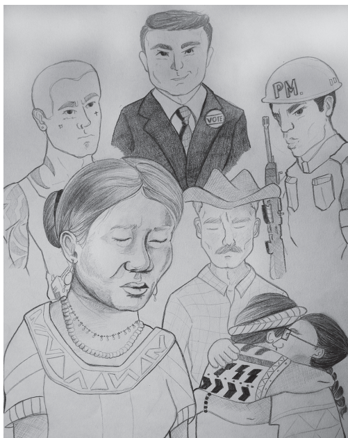
Dibujo 6 Factores de riesgo de la mujer

donde hay más de un desplazamiento, está muy relacionado a si el victimario hace parte de estas organizaciones criminales o de las fuerzas de seguridad del estado. Aquí, debido a las redes que los perpetradores tienen en varios puntos del país, generalmente logran ubicar a la víctima, generándose un nuevo desplazamiento o la búsqueda de protección internacional.