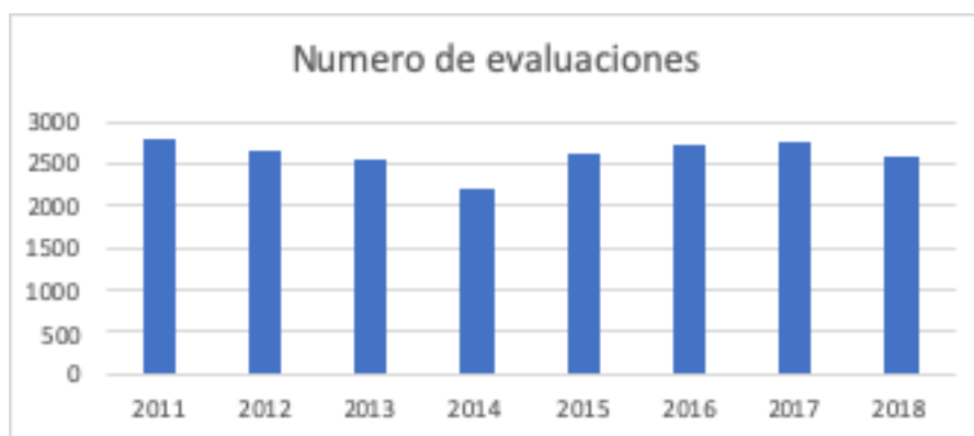
Figura 4 Evaluaciones de delitos sexuales realizados por la DGMF (UNAH -IUDPAS, 2011- 2018)

De los sistemas de información analizados, 41 se resaltan los siguientes aspectos: