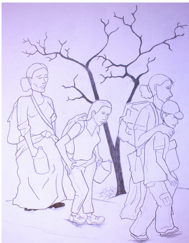
Dibujo 4 Desplazamiento forzado de mujeres

Sin embargo, una serie de investigaciones han surgido recientemente aportando algunos elementos para entender esta relación (CIPPDV et al., 2019; CONADEH, 2018; Cristosal, 2019; Foro de las Mujeres por la Vida, 2019; Grupo Sociedad Civil & PADF, 2018; Oxfam et al, 2019). Este apartado pretende primero, hacer un recorrido por estos estudios para conocer los principales hallazgos de lo que se sabe hoy del desplazamiento forzado vinculado a las violencia contra las mujeres, complementándolo con la información recogida en las entrevistas y grupos focales de este trabajo. Posteriormente, se identifican las principales limitaciones de la literatura en la materia, para mostrar que, como en muchas otras dimensiones de la violencia contra las mujeres y del desplazamiento forzado, los estudiosos y estudiosas de estas problemáticas nos encontramos caminando a tientas.