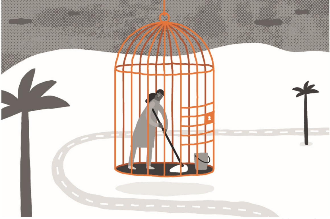
عالقة/محبوسة في بيت رب العمل

القدرة الكافية والظروف الملائمة. قالت بعض العاملات إنهن أبلغن عن الانتهاكات التي تعرضن لها إلى وكالات التوظيف الخاصة بهن، ولكن الوكلاء احتجزوهن وضربوهن، وأجبروهن على العمل لعائلات جديدة دون إرادتهن.