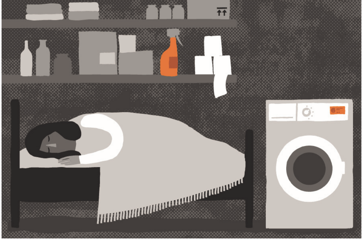
ظروف نوم غير ملائمة

بعض العاملات إن أصحاب عملهن لفقوا لهن تهما بالسرقة أو هددوا بذلك، عندما سألن عن رواتبهن أو هربن من الانتهاكات.