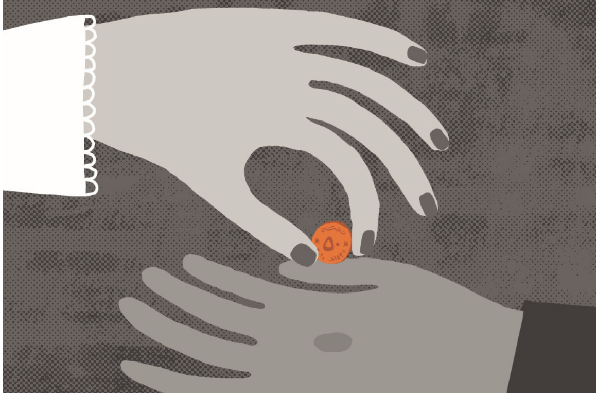
الراتب ناقص أو لم يُدفع بتاتا

تواجه عاملات المنازل الوافدات أشكالاً متعددة من التمييز والسياسات الحكومية التعسفية. ولأنهن عاملات منازل، فهن لا يحصلن على حماية قانون العمل المكفولة للعمال الآخرين. تنصّ اللوائح القانونية على إمكانية دفع أجور أقلّ لهن مقارنة بالعمال الذكور. ولأنهن وافدات، تستند رواتبهن إلى أصولهن لا مهارتهن وخبرتهن. تنتهك هذه السياسات والممارسات التزامات عمان بمعاهدات حقوق الإنسان التي صادقت عليها، بما في ذلك "اتفاقية القضاء على جميع أشكال التمييز ضد المرأة"، و"الاتفاقية الدولية للقضاء على جميع أشكال التمييز العنصري".