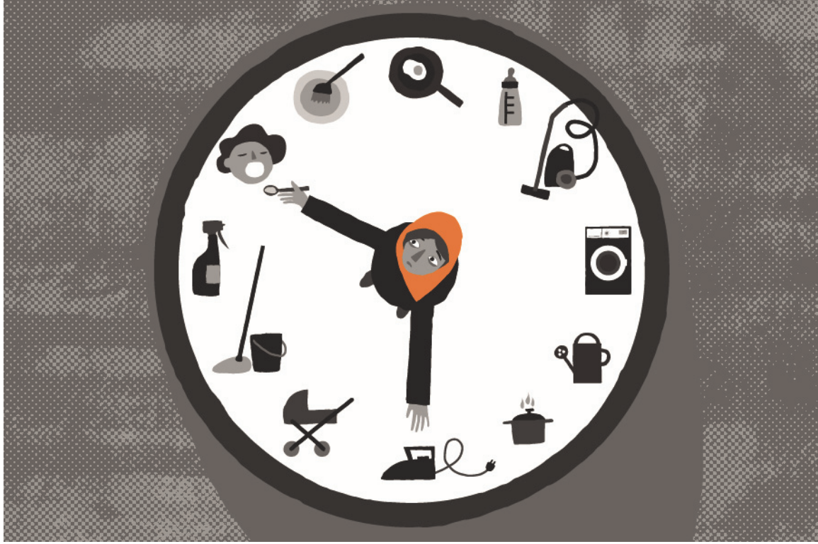
دوام عمل طويل

أو عندما يكون صاحب العمل مسيئاً. علاوة على ذلك، يمكن لأصحاب العمل إلغاء تأشيرة العامل في أي وقت. يمكن أن يُعاقب العمال الذين يتركون وظائفهم دون موافقة صاحب العمل بغرامات مالية ويواجهون الترحيل وحظر العودة.