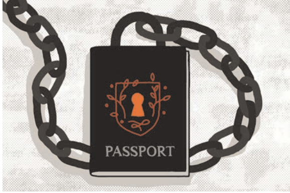
مصادرة جواز السفر

صحار، مدينة ساحلية شمال عمان. قالت إنها عملت 16 شهرا من الساعة 4 صباحا حتى منتصف الليل دون يوم راحة. قالت إن صاحب العمل دفع لها 50 ريال عماني فقط شهريا (130 دولار)، وهو أقل بـ 20 ريال مما كانت تستحق، وحجب عنها رواتب 4 أشهر.