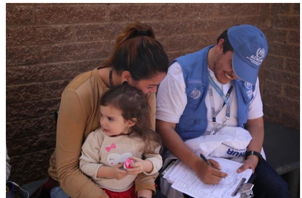
ACNUR durante la jornada de Registro de Venezolanos (RAMV) en Soacha, Bogotá.