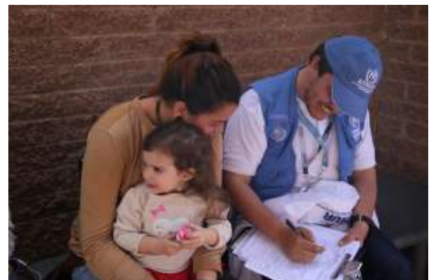
ACNUR durante la jornada de Registro de Venezolanos (RAMV) en Soacha, Bogotá.