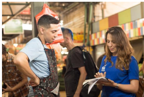
Venezolano siendo entrevistado por personal del ACNUR durante uno de los ejercicios de monitoreo de protección en Santiago de Chile

Sólo un 5% de las personas entrevistadas reportó haber solicitado la condición de refugiado, de las cuales un 3% reportó que su solicitud fue denegada. El 36% manifestó no considerarlo necesario o aplicable a su caso, y el 73% indicó no tener la intención de hacerlo. Otro 25% indicó no tener información sobre el sistema de asilo en Chile. El ACNUR infiere que el desconocimiento sobre el sistema de asilo en Chile es uno de los factores relevantes que explica el hecho de que la población venezolana no esté aplicando a la condición de refugiado en el país; los mismo ha sido constatado a través de reuniones con asociaciones de venezolanos, y otros contactos y encuestas con la población.