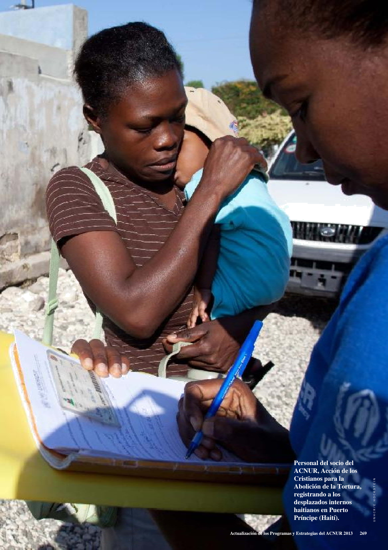
Personal del socio del ACNUR, Acción de los Cristianos para la Abolición de la Tortura, registrando a los desplazados internos haitianos en Puerto Príncipe (Haití).