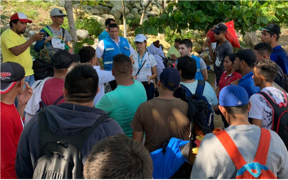
Figure 1 UNHCR staff members provide guidance on the asylum system.

En México , dadas la naturaleza mixta de los movimientos, la complejidad de la situación y la prevalencia de personas con necesidades de protección internacional, entidades del gobierno, otras agencias dentro y fuera del Sistema de Naciones Unidas, la sociedad civil, organizaciones religiosas, el sector privado y otras relevantes, continúan coordinando sus respuestas.