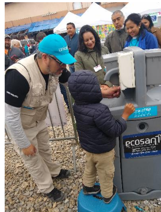
Figure 2 Infraestructura de agua y saneamiento instalada en albergue de Tijuana.

La OIM ha instalado un centro de información y registro en la frontera con México, en Tecún Umán, desde donde el personal de la Organización provee asesoría y asistencia para el retorno voluntario. 107 personas migrantes se han beneficiado del programa de retorno voluntario desde Tecún Umán, el 59% de ellos regresó a El Salvador y el 41% a Honduras. Adicionalmente, 27 migrantes guatemaltecos han regresado