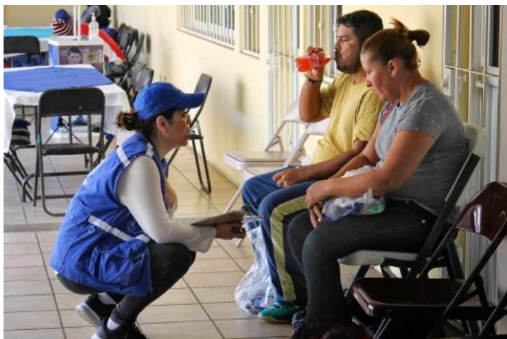
Figure 3 Desde el 4 de noviembre, cientos de migrantes que formaban parte de las caravanas, solicitaron y obtuvieron el apoyo de la OIM para regresar a sus países de origen o residencia.

La OIM ha asistido a 182 personas migrantes salvadoreñas para su retorno voluntario (el 36% de todos los migrantes asistidos por OIM). Además, en coordinación con el gobierno, la OIM dio asistencia post arribo a 456 personas migrantes con la entrega, según los diferentes casos, de kits de higiene y alimentación, coordinación del transporte hacia sus comunidades, referencia a programas de reintegración. La coordinación con los mismos familiares de los migrantes retornados y los centros de recepción es un aspecto fundamental para asegurar el retorno digno, y se ha aplicado los protocolos establecidos para unidades familiares y niños, niñas y adolescentes no acompañados. Finalmente, la OIM aplicó su metodología DTM (Displacement Tracking Matrix) para monitorear en tiempo real la última caravana que salió del país.