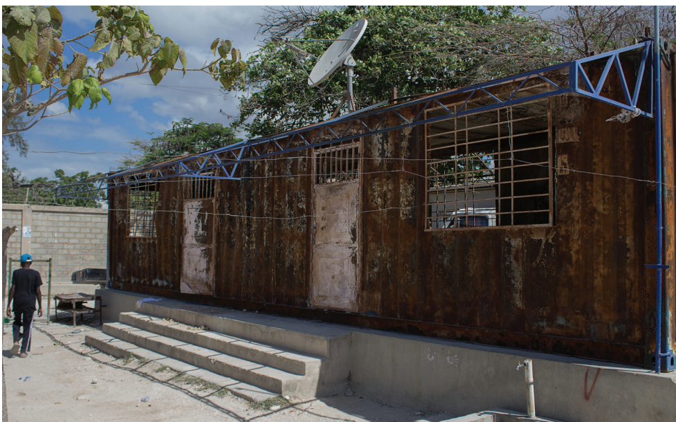
👁️ Oficina de las autoridades migratorias haitianas en Anse-à-Pitres, abril de 2016. La oficina no fue reconstruida después de un ataque incendiario ocurrido a principios de 2016. El oficial de migración trabajaba en el exterior cuando Amnistía Internacional visitó Anse-à-Pitres.

Muchas personas afirman que no les mostraron orden de deportación alguna ni les dieron oportunidad de llamar a sus familias durante su detención. Por ejemplo, en la oficina local de la ONG Groupe d'Appui aux Rapatriés et Réfugiés (GARR) en Belladère, Amnistía Internacional entrevistó a cinco haitianos que acababan de ser deportados. Estos hombres dijeron que habían sido detenidos dos días antes en la capital de la República Dominicana, Santo Domingo, mientras trabajaban en unas obras de construcción. Los llevaron al centro de detención para migrantes de Haina. Según su relato, en el centro no les hicieron preguntas, ni les permitieron realizar llamadas. Uno de ellos tenía una copia de su inscripción en el plan de regularización. Fueron deportados dos días después y llegaron a Belladère a las nueve de la mañana. Algunos habían dejado esposa e hijos en la República Dominicana.