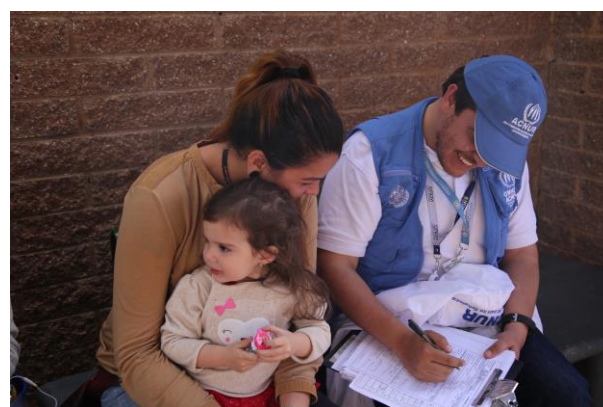
ACNUR durante la jornada de Registro de Venezolanos (RAMV) en Soacha, Bogotá.