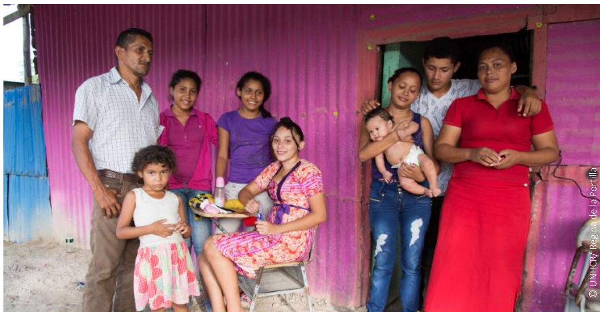
Familia venezolana vive en asentamiento informal en Arauca mientras espera el reconocimiento de la condición de refugiado.

El Grupo Interagencial sobre Flujos Migratorios Mixtos (GIFMM) fue creado a finales del 2016. Es co-liderado por OIM y ACNUR. Funciona como un espacio de coordinación para la respuesta a la situación de refugiados y migrantes en Colombia. Tiene 46 miembros, incluyendo agencias de Naciones Unidas, ONGs y el Movimiento de la Cruz Roja. El GIFMM tiene como objetivo principal coordinar la respuesta a las necesidades de refugiados, migrantes, retornados y poblaciones de acogida, de forma complementaria con el Gobierno.