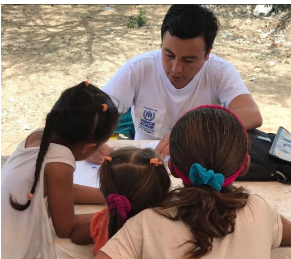
El ACNUR, la Gobernación de la Guajira y el Consejo Noruego para Refugiados atendiendo a la población en Riohacha, Guajira.