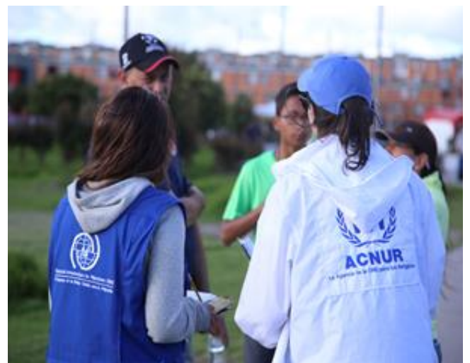
OIM y ACNUR han ofrecido orientación sobre este proceso en todo el país, incluyendo en Soacha, Cundinamarca.