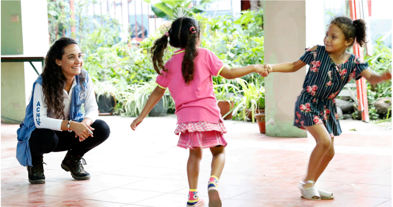
Costa Rica. Más de 60.000 nicaragüenses han solicitado asilo en Costa Rica desde abril de 2018.

El presente documento tiene como finalidad ofrecer una visión general de los principales acontecimientos que afectan a la situación de desplazamiento en las Américas y a algunas de las actividades de respuesta del ACNUR con arreglo a los objetivos estratégicos de 2019 para la región.