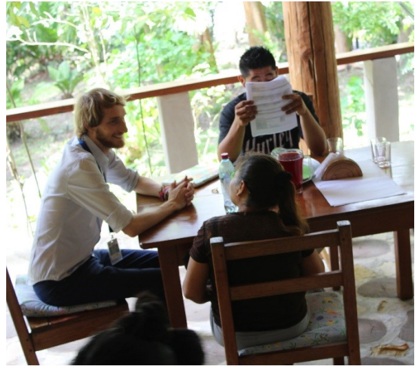
Entrevista con participantes del programa TURI-INTEGRA en Petén. La participante fue seleccionada por el empleador para la fase de formación y práctica en la empresa.

A partir del 22 de octubre, 8 personas de interés por ACNUR y 12 empleados de las empresas participantes han empezado sus cursos de formación en temas de atención al cliente, inglés, y jardinería. La fase de formación y práctica terminará el 31 de diciembre. Las empresas participantes se han comprometido a emplear a los participantes después de la culminación exitosa de esta fase.