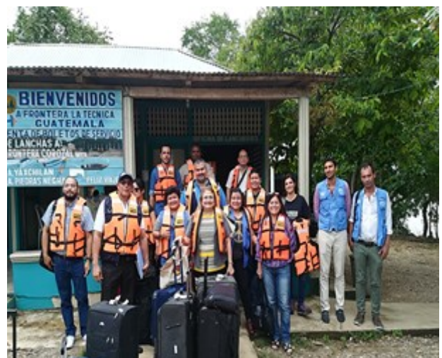
Miembros del CCPDH preparando para entrar a México. La delegación recorrió la ruta norte para aprender sobre retos enfrentados por migrantes y refugiados en la ruta.

El Consejo Centroamericano de Procuradores de Derechos Humanos (CCPDH) visitó a Petén como parte de su recorrido de Belice a México. La agenda de los miembros del CCPDH incluyó la visita a organizaciones no gubernamentales y socios de ACNUR en el terreno con fin de identificar los retos para la realización de los derechos humanos para personas refugiadas y migrantes en la ruta. Se identificaron como desafío principal el abuso y explotación sistemática que las personas refugiadas y migrantes sufren en el camino.