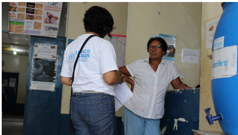
Asistente de Terreno hablando con una enfermera en un Centro de Salud en la ruta norte sobre el cuidado y el uso del eco-filtro.

El equipo de terreno recorrió la ruta de Santa Elena al Naranjo, El Ceibo, y Bethel para monitorear el estado de los eco-filtros donados como parte del proyecto de impacto rápido de acceso de agua en las rutas migratorias del departamento de Petén en 2017. Se visitaron a 20 sitios donde se entregaron eco-filtros siendo puntos clave a lo largo de la ruta, incluyendo en centros de salud, subestaciones de la Policía Nacional Civil, y actores comunitarios, para asegurar el acceso a agua potable para las personas refugiadas y migrantes en su tránsito así como de la comunidad local. Se identificó que el 90% de los eco-filtros en uso y en condiciones óptimas.