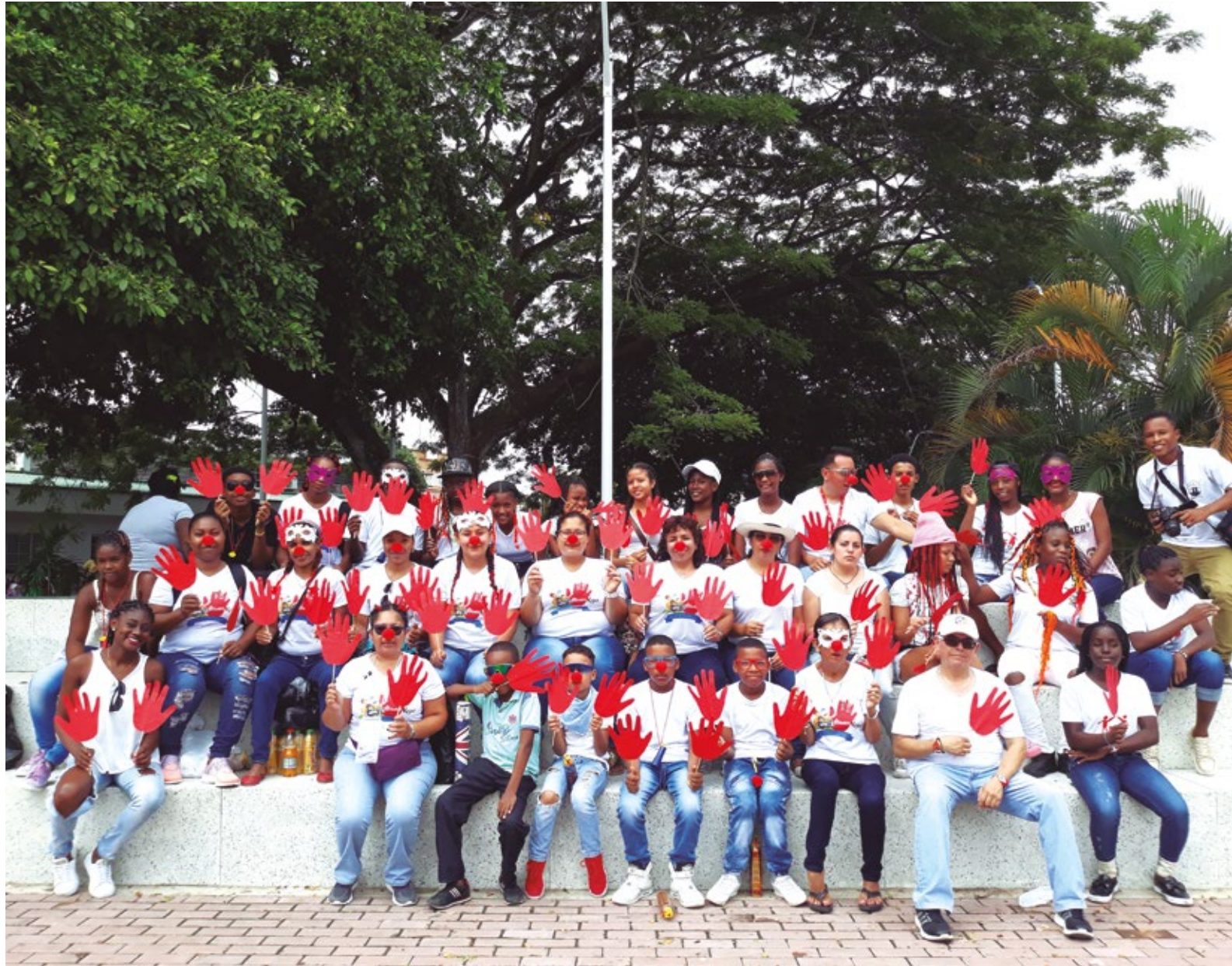
El grupo de participación de Tumaco celebrando el Día Internacional de las Manos Rojas. Febrero 2018.