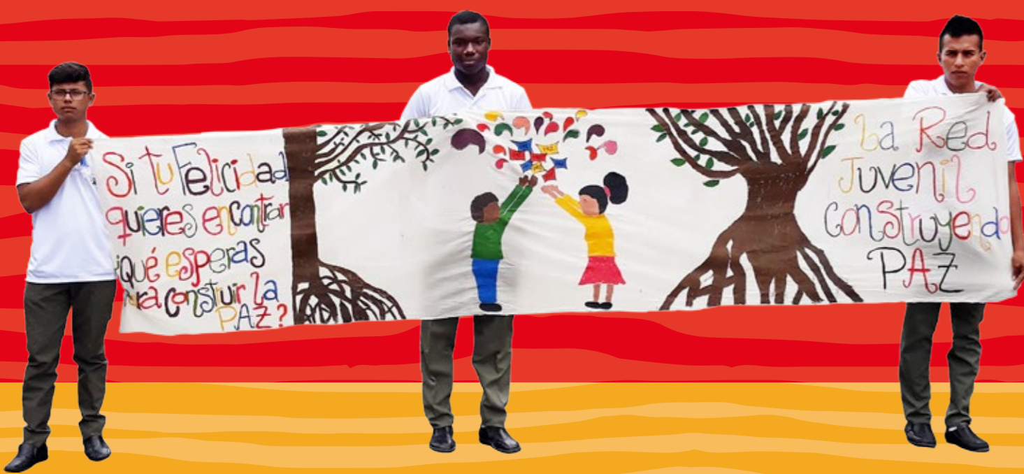
El grupo de participación de Tumaco marchando por la construcción de paz en el marco de la Semana de la Juventud en 2017.