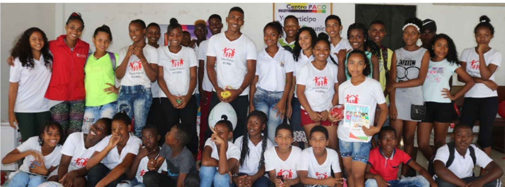
El grupo de participación de niños, niñas, adolescentes y jóvenes de Tumaco