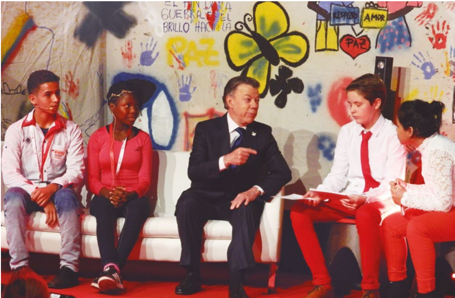
Dos adolescentes de Tumaco (izquierda) participando en la entrega del premio Nobel de Paz al ex-presidente Juan Manuel Santos en 2016.

como colectivo, que les permita proyectarse a futuro, empoderarse, desarrollar autonomía de grupo, fortalecimiento de los liderazgos de niños, niñas, adolescentes y jóvenes, y visibilizarse y destacarse en sus comunidades, municipalidades y en el país, a partir del desarrollo de iniciativas que contribuyan a la promoción, defensa y reconocimiento de sus derechos y a la construcción de la paz.