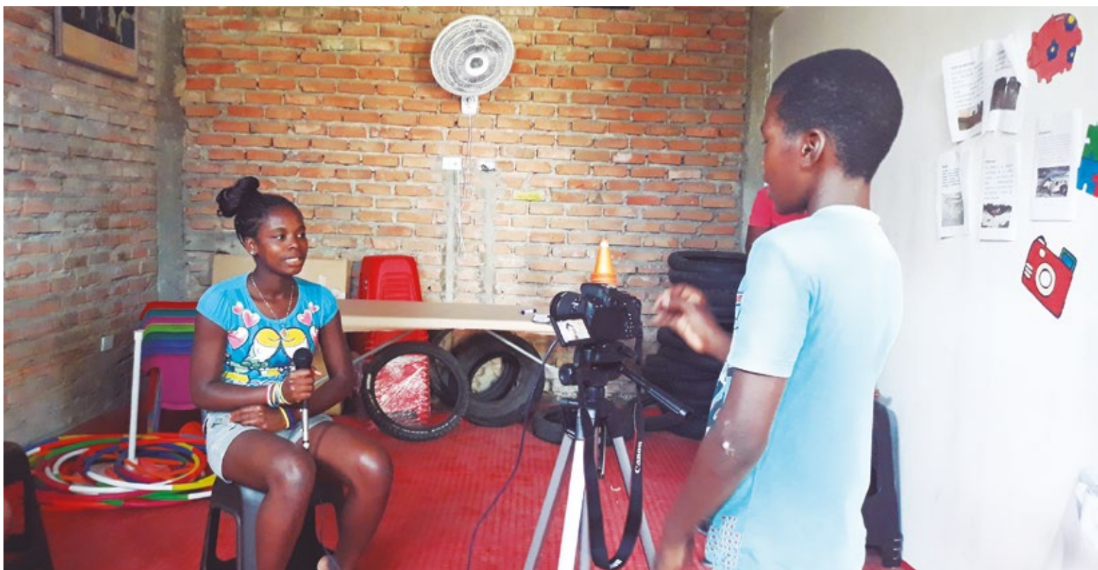
Dos adolescentes durante el ciclo formativo en Comunicaciones en el Espacio Amigable Unión Victoria.