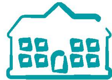
INSTITUCIÓN EDUCATIVA FILIPINAS