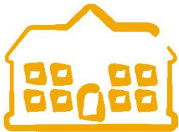
CENTRO EDUCATIVO EL TRÁNSITO

Y por último, se están iniciando los preparativos para la realización del evento nacional de sensibilización y ampliación de conocimientos sobre el tema junto a la Coalición Global para Proteger la Educación de Ataques (GCPA), en el que se espera apoyo e involucramiento activo de las Embajadas de Noruega, Argentina, Canadá, España, (los primeros líderes a nivel global).