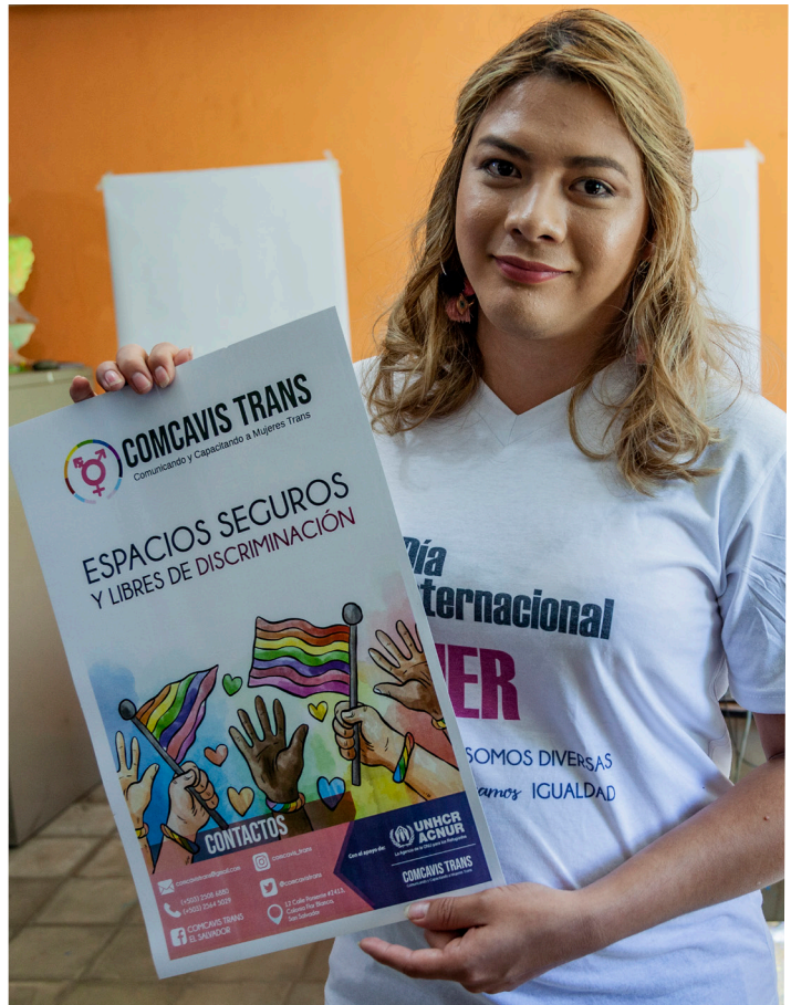
2019, ESA, Diana Diaz