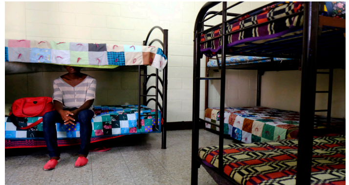
Niño/as de Paz, ACNUR, Ciudad de Guatemala, Casa del Migrante

De Maria Inés Taracena, Arizona Public Media, 2017 119