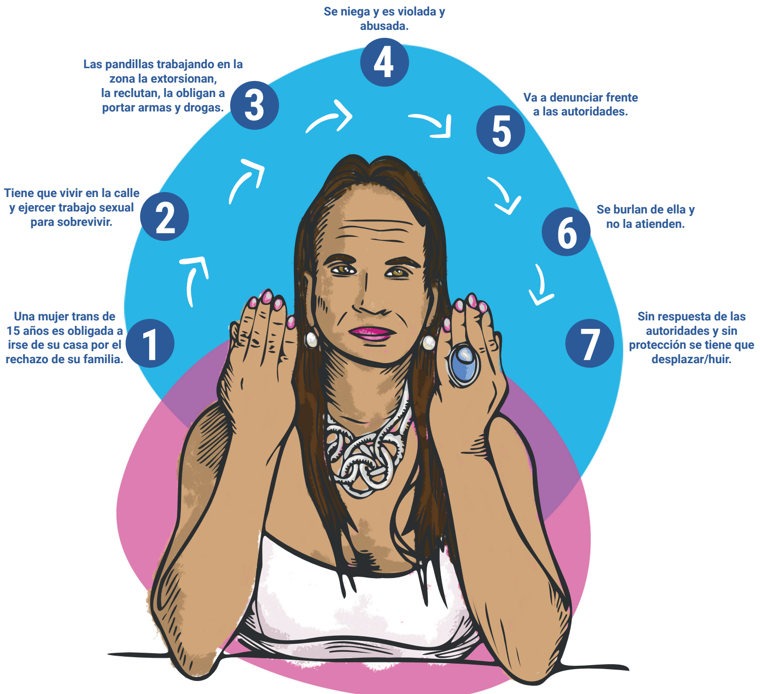
Ilustración por Milko Delgado, NRC, 2019

Según las organizaciones entrevistadas, a menudo las personas LGBTI en el Norte de Centroamérica no están sujetos a un tipo de violencia, evento aislado o agente persecutor, sino a una combinación de varias violencias. A esto se suma la violencia estructural, que impide el acceso a la educación, el empleo y servicios básicos 14 . Los pocos mecanismos de sobrevivencia, como el trabajo sexual o el desplazamiento, son opciones peligrosas y a menudo ponen a las personas en mayor riesgo frente al abuso, trata, enfermedades, y violaciones de derechos.