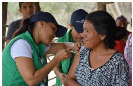
Jornada de vacunación en Riohacha, La Guajira.

Durante el mes de enero, más de 60.000 beneficiarios recibieron una o más asistencias a través de 26 socios e implementadores del RMRP, en 20 departamentos y 36 municipios, tanto en departamentos de frontera como de tránsito y asentamiento de población proveniente de Venezuela. Se realizaron más de 41.500 consultas de atención primaria en salud física y mental y más de 3.600 consultas de atención de emergencia para refugiados y migrantes, incluyendo partos y atención neonatal; además, más de 8.500 personas recibieron atención en salud mental o apoyo psicosocial. En cuanto a salud sexual y reproductiva, se realizaron más de 3.200 atenciones médicas, integrales y ginecológicas prenatales.