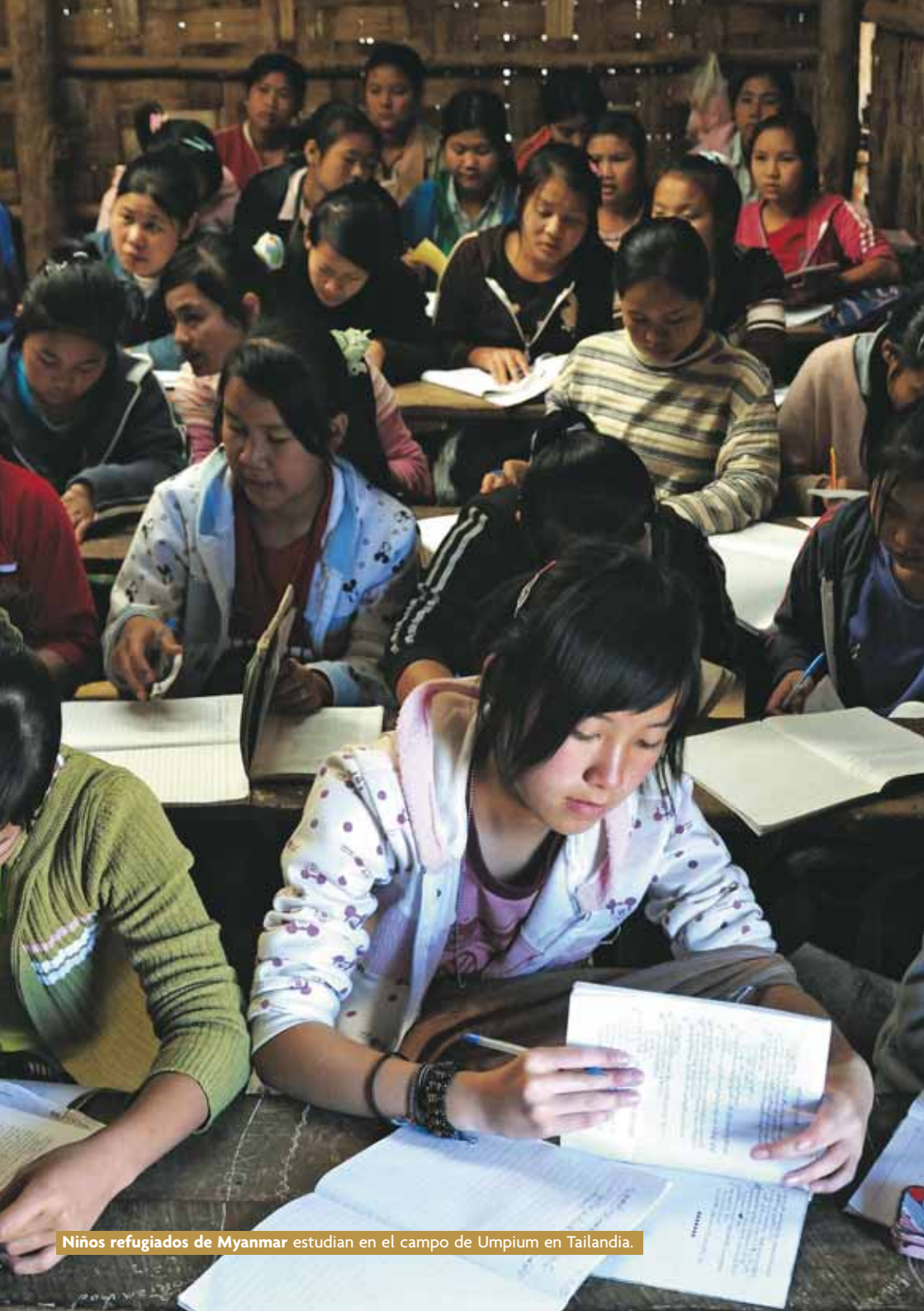
Niños refugiados de Myanmar estudian en el campo de Umpium en Tailandia.