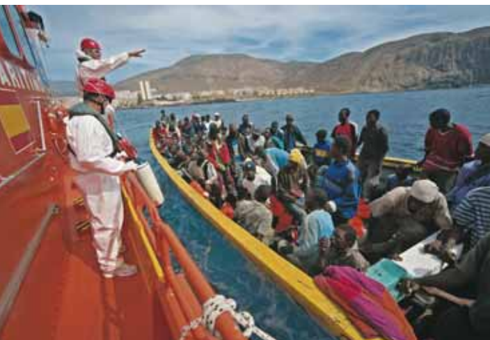
Cada año, la guardia civil española intercepta a cientos de inmigrantes irregulares que tratan de llegar a las Islas Canarias.

E STOS SON LOS TRES GRUPOS PRINCIPALES DE PERSONAS QUE SE desplazan. Los refugiados que huyen del conflicto bélico o de la persecución se encuentran en una situación muy vulnerable. No disfrutan de la protección de su propio Estado; de hecho, es a menudo su propio gobierno el que amenaza con perseguirles. Si otros países no les permiten la entrada y no les ayudan una vez dentro, podrían estar condenándolos a muerte o a una vida insufrible sin derechos y ni seguridad.