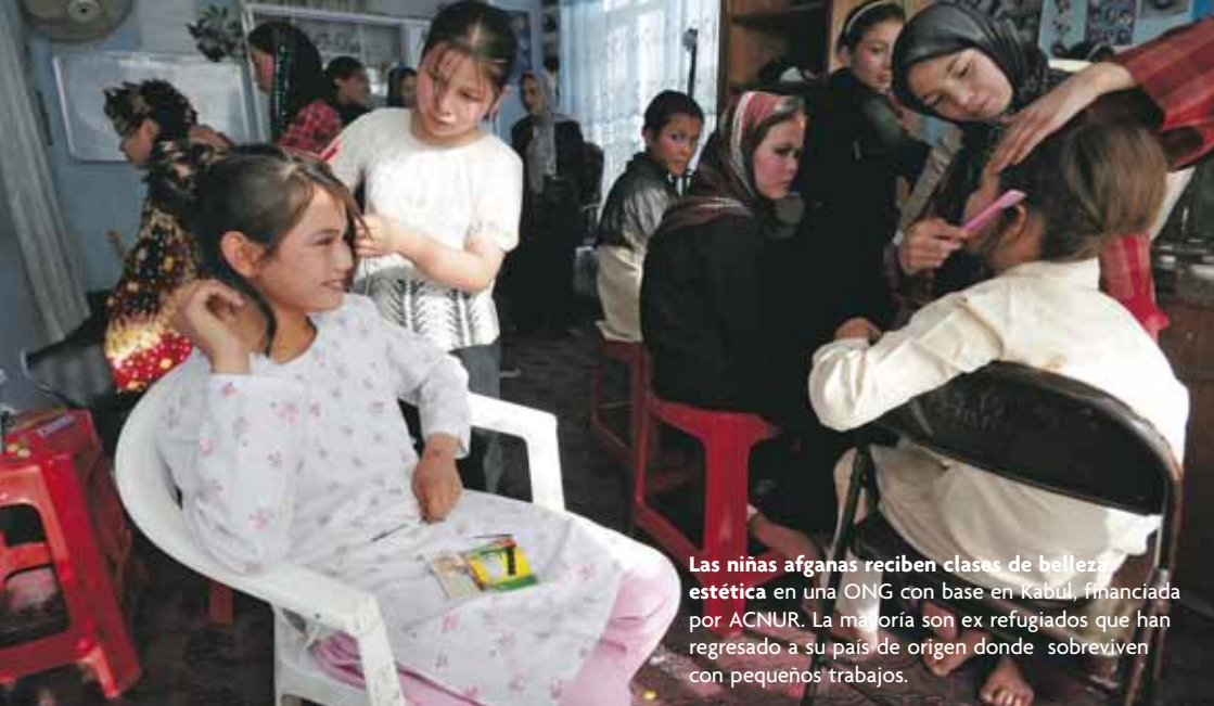
Las niñas afganas reciben clases de belleza estética en una ONG con base en Kabul, financiada por ACNUR. La mayoría son ex refugiados que han regresado a su país de origen donde sobreviven con pequeños trabajos.