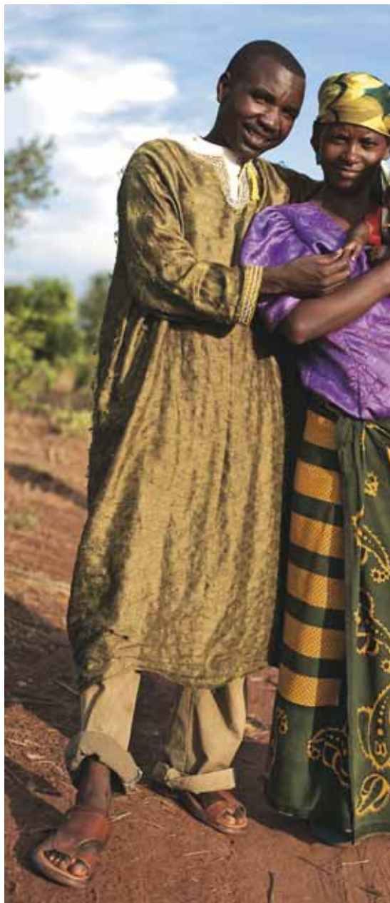
Tras décadas de exilio, estos refugiados burundeses han tenido la oportunidad de elegir entre repatriarse o integrarse en Tanzania, incluyendo la posibilidad de nacionalizarse.

En diciembre de 2008, un total de 147 países habían firmado la Convención de 1951 sobre los Refugiados y/o su Protocolo Adicional de 1967 (véase, para más detalles, en el folleto sobre la Convención de los Refugiados de 1951).