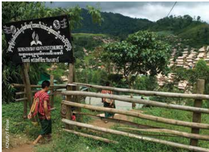
Refugiados de Myanmar entran en el recinto de una iglesia Adventista del Séptimo Día en el campamento Umpium en la provincia de Tak, Tailandia.

La falta de conocimiento o de sensibilidad sobre el importante papel que desempeña la fe en la vida de las comunidades afectadas por las crisis puede dar lugar a que los actores humanitarios se encuentren con barreras y consecuencias inesperadas, perdiendo oportunidades para persuadir y movilizar a las comunidades, e incluso causando un daño involuntario. Las