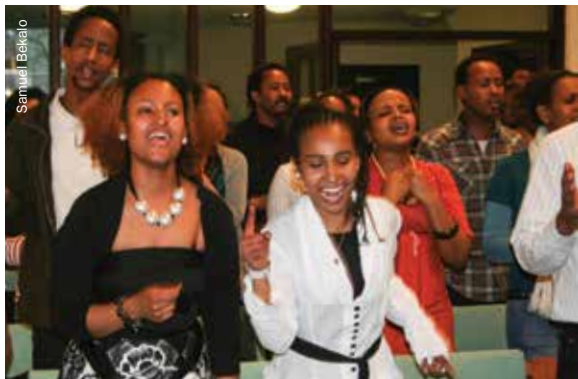
En un evento de la Iglesia Pentecostal Habesha (etíope y eritrea) en Leeds, Reino Unido.

Partiendo de esta base, las Iglesias en cuestión han podido disponer una amplia gama de servicios prácticos de ayuda a la comunidad, entre ellos, el poder llegar hasta los refugiados recién llegados; los servicios consistentes en proporcionar asesoramiento y realizar sesiones en grupos de ayuda a los que la gente puede acudir sin cita previa para solicitar asistencia, que son imparciales y confidenciales; los servicios de ayuda sesgados por edad, sexo y necesidades; los servicios de ayuda en situaciones de emergencia para un sector más