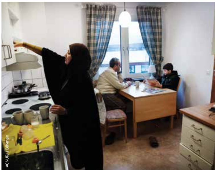
Una familia de refugiados sirios comienza una nueva vida en la pequeña ciudad de Torsby, Suecia, enero de 2014.