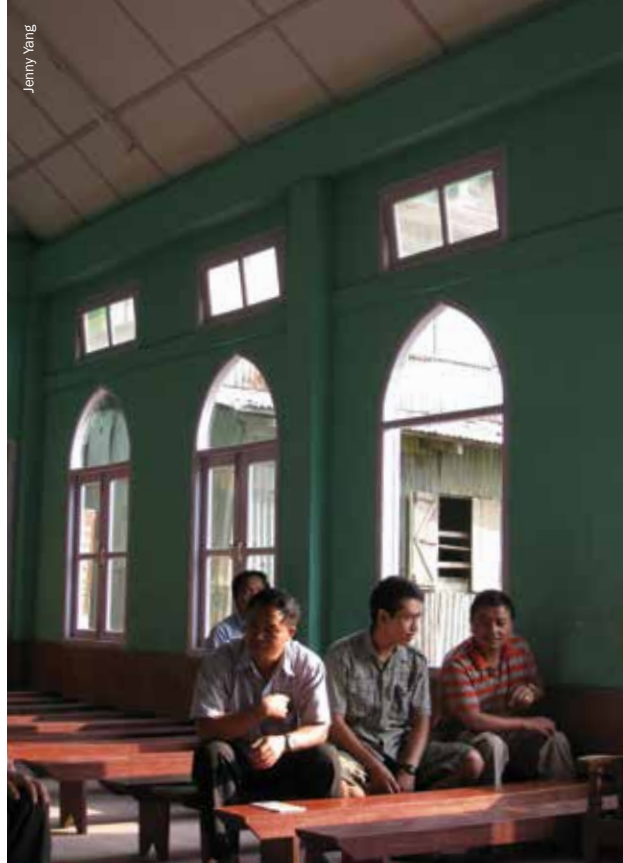
Un grupo de pastores refugiados chin comparten sus historias en una iglesia local en Saiha, estado de Mizoram, India.

Una de las principales preguntas que hice durante mi viaje fue cuál es el papel que la sociedad civil –en particular, las organizaciones profesionales– desempeñan en la prestación de asistencia y protección a los refugiados en una zona donde no existe protección o asistencia internacional. Los grupos religiosos en Mizoram han proporcionado los servicios sociales esenciales para los refugiados, y los hospitales y clínicas dirigidos por la Iglesia complementan los sistemas de salud y educación del gobierno y llenan vacíos para garantizar que aquellos que son especialmente pobres –lo que incluye a