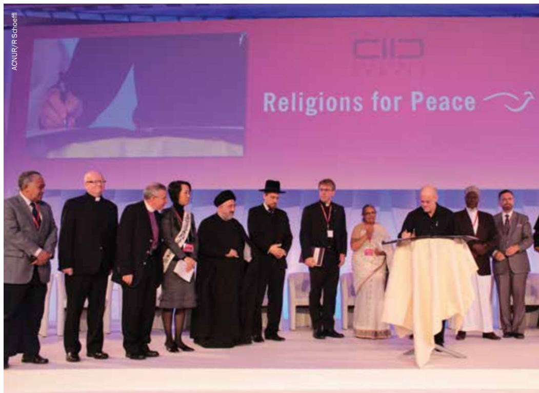
Ceremonia de firma de las Afirmaciones de líderes de comunidades basadas en la fe en la 9ª Asamblea Mundial de Religiones por la Paz en Viena, 21 de noviembre de 2013.

Otra iniciativa a raíz del Diálogo del Alto Comisionado sobre Fe y Protección fue una solicitud del desarrollo de unas directrices para los líderes religiosos, cuyo objetivo fuera promover la tolerancia y el respeto por la dignidad humana y los derechos humanos de los solicitantes de asilo y refugiados, migrantes, desplazados internos y personas apátridas. A principios de 2013 ACNUR trabajó con un grupo de organizaciones y redes confesionales y expertos en religión para redactar un texto que consistía en 16 "Afirmaciones" redactadas en primera persona que ponían de relieve los principios y valores