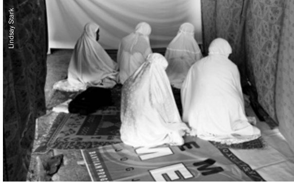
Mezquita temporal establecida en un campo de desplazados en Yogyakarta, Indonesia.

Es comprensible tanta cautela si se piensa que un enfoque laico garantiza la protección de los principios humanitarios. Sin embargo, varios desarrollos desafían actualmente esta postura. Peter Walker ha observado cómo la actual interpretación de los principios humanitarios necesita evolucionar para reflejar el impacto de la globalización 3 . Los campos de las relaciones internacionales, las ciencias políticas y la sociología han abandonado la presunción de que el laicismo avanza con el desarrollo y han empezado a abordar la incipiente potencialidad de una “era postseglar”. Cada vez está más asumido que el mundo de la fe no puede quedar confinado de facto o de iure a la esfera de lo privado ni ser apartado de la vida pública. Es más, cada vez es mayor el reconocimiento de que el marco seglar o laico refleja una ideología occidental desarrollada a partir de una tradición judeocristiana que se aleja de una perspectiva “neutral”. Es bien sabido que la politización y la