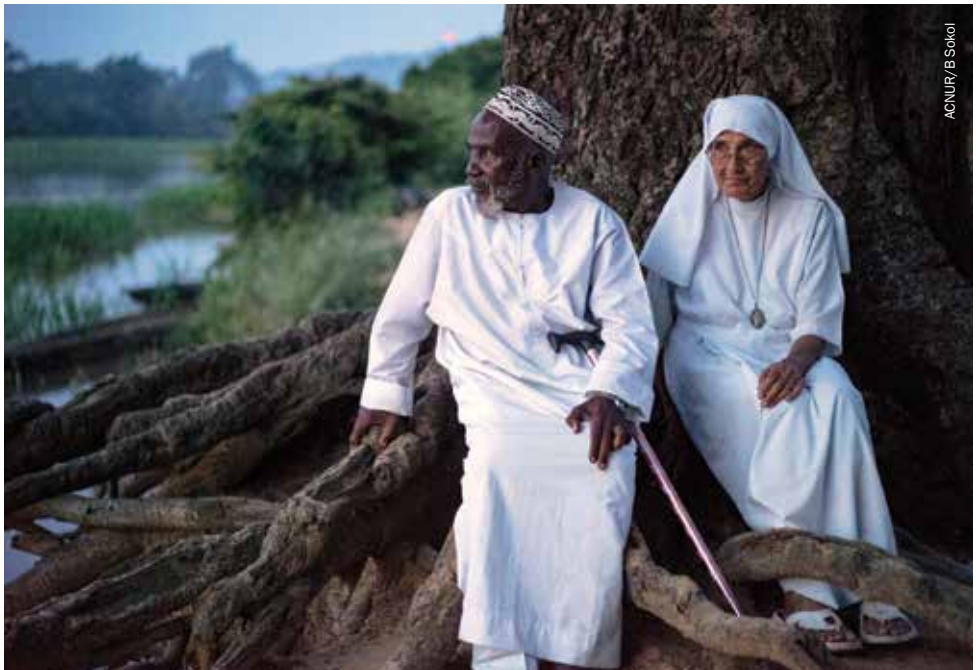
AGNUR / B. SIKOI

Como resultado de esta reunión CAFOD, Islamic Relief, Muslim Charities Forum y Muslim Aid emprendieron una misión conjunta de una semana de duración en la República