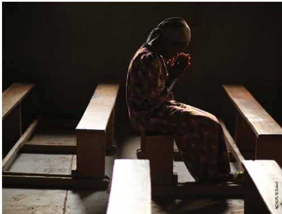
La hermana Angélique Namaika (ganadora del Premio Nansen 2013) en la iglesia católica de la que es miembro, en Dunga, República Democrática del Congo.

a las organizaciones externas, los donantes occidentales pueden parecer igual de intolerantes hacia los líderes religiosos del Sur en cuanto a que el cumplimiento de sus principios y enfoques sea una condición para recibir la ayuda. Los efectos colaterales derivados de estas cuestiones han reverberado a lo largo y ancho de la red de Caritas y de nuestras iglesias asociadas locales, y han influido en el modo en que trabajamos con los desplazados en todos los contextos.