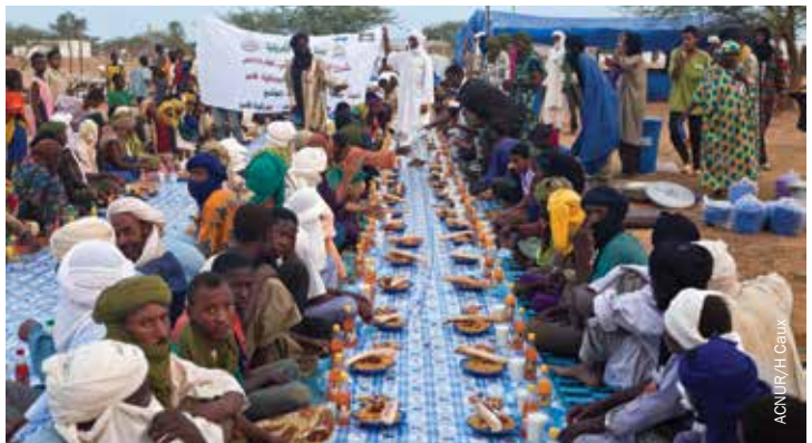
Refugiados malienses se preparan para romper el ayuno durante el Ramadán en el campo de refugiados Goudoubo, Burkina Faso.

En contextos de migración forzada, la religión siempre ha desempeñado un papel en los patrones de migración. Se ha visto más recientemente en el caso de los refugiados sirios, en especial en el Líbano, donde los sirios son más propensos a trasladarse a un lugar habitado por aquellos que provienen de un contexto religioso similar. Estas conexiones pueden permitir un mayor potencial para la tolerancia y la hospitalidad por parte de las comunidades de acogida para los migrantes que tienen raíces étnicas o religiosas similares y la ayuda podría distribuirse más fácilmente cuando se hace a través de las estructuras religiosas que ya existen. Por otro lado, las reducidas oportunidades que tienen otras comunidades para interactuar pueden exacerbar un sentimiento de división, diferencia y competición. El papel positivo de la identidad religiosa compartida también está mancillado en los lugares en que ha dado lugar a discriminar a otras comunidades. En el Líbano el Gobierno ha restringido el número de familias refugiadas sirias en cualquier asentamiento. Sin embargo, la mayoría de los asentamientos de la región de la Becá albergan a un número significativamente mayor de familias sirias y la opinión popular lo