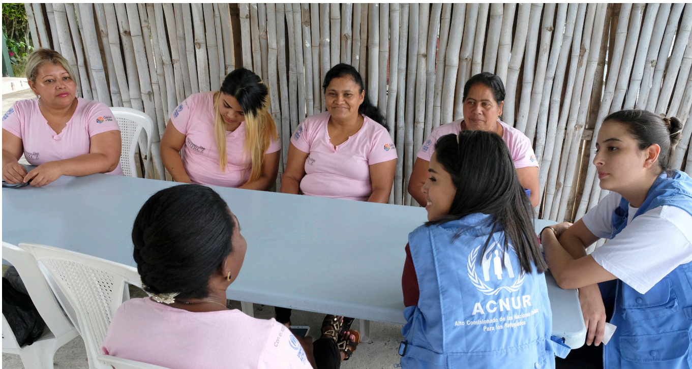
Honduras. Ayudando a las comunidades urbanas afectadas por la violencia de las pandillas.

El presente documento tiene como finalidad ofrecer una visión general de los principales acontecimientos que afectan a la situación de desplazamiento en las Américas y a algunas de las actividades de respuesta del ACNUR con arreglo a los objetivos estratégicos de 2019 para la región.