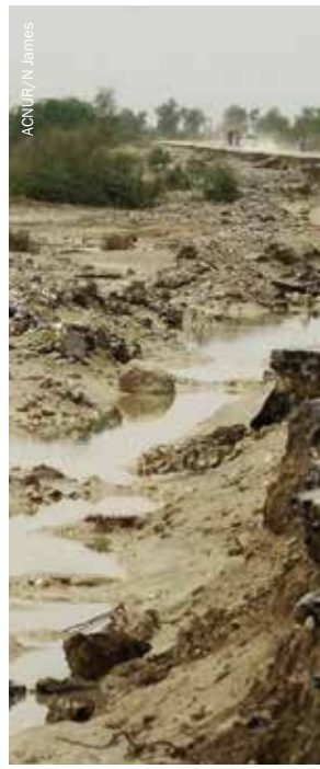
Carretera dañada por las inundaciones en Baluchistán, Pakistán, 2010.

Dada la repentina tasa de retorno, los programas de