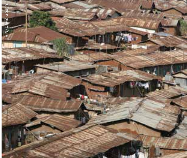
Barrio de Kibera, Nairobi, hogar de miles de desplazados internos.

El grupo de trabajo sobre cuestiones de protección configuró un subgrupo de ayuda jurídica para explorar los vacíos legales con respecto a la protección de los desplazados internos y para redactar las provisiones clave de una política para ellos. Tras el foro de revisión nacional de los principales interesados en acciones humanitarias que tuvo lugar en marzo de 2010, se finalizó la creación de la política en colaboración con el Ministerio de Estado para Programas Especiales. 3 Mientras tanto un Comité Parlamentario para el Reasentamiento de Desplazados Internos trabajó