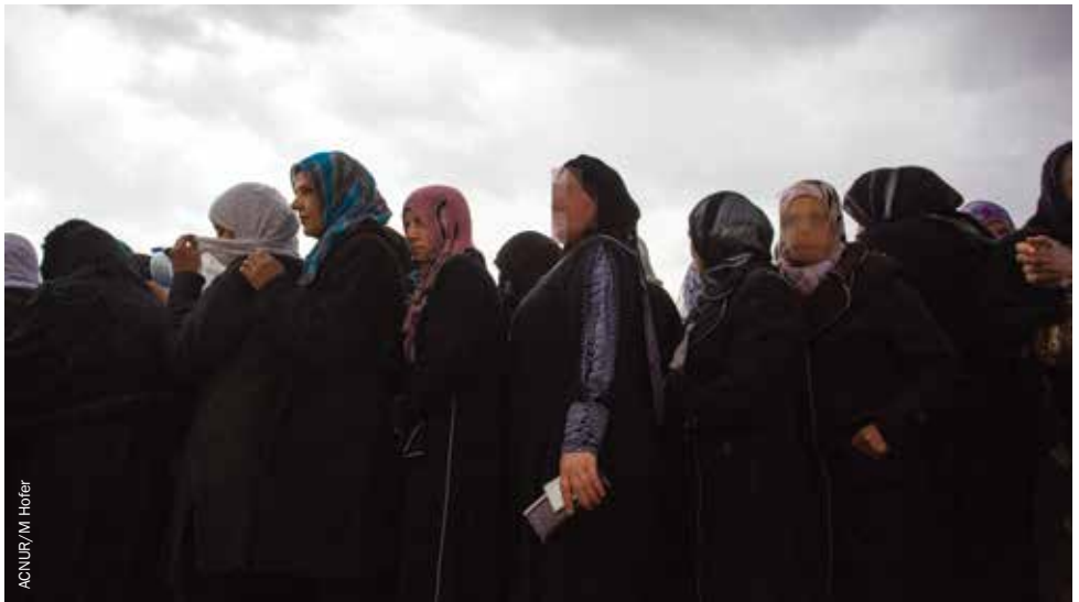
Refugiadas sirias esperan para registrarse con el ACNUR en la localidad de Aarsal, Líbano, 2013.