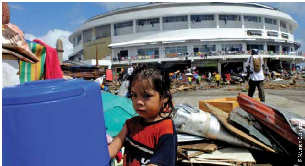
Unas 8.000 personas desplazadas han estado viviendo en el Tacloban Astrodome, el mayor complejo deportivo de la ciudad.

La ciudad de Guiuan, en la provincia oriental de Samar, fue el primer punto de impacto del tifón Haiyan en Filipinas. Incluso antes del desastre, la conexión a Internet era muy limitada. Después de algunos problemas técnicos iniciales debido al alto grado de humedad y a la dificultad para detectar una ubicación apta entre los escombros esparcidos, el Cluster de Telecomunicaciones de Emergencias pudo establecer servicios de conexión a Internet por Wi-Fi para la comunidad humanitaria gracias al kit de despliegue regular de emergency.lu. El Cluster de Agua, Saneamiento e Higiene (WASH) distribuyó mantas, kits de higiene, purificadores de agua, y enseñó a los habitantes de Guiuan buenos hábitos de higiene mientras trabajaba con el Gobierno local