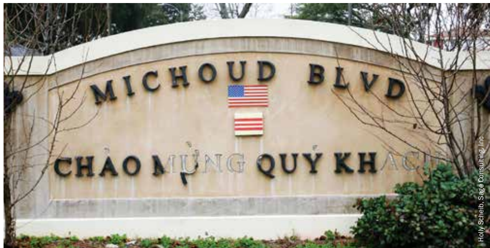
Entrada a las zonas residenciales del barrio de Village L'Est que muestra tanto la bandera de EEUU como la vietnamita.