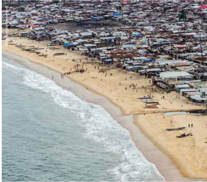
Barrio pobre de West Point, hogar de unas 75.000 personas, cerca del centro de Monrovia, 2013.

La capital liberiana, Monrovia, es el ejemplo por antonomasia del crecimiento de los conflictos urbanos, exacerbado además por el deterioro rural y las constantes tensiones entre las etnias. Durante el conflicto civil que tuvo lugar entre 1989 y 2003, liberianos de todo el país huyeron a Monrovia y otras ciudades en las que ACNUR y varias agencias ofrecían asistencia humanitaria. Después de 2005, ACNUR llevó a cabo un programa de retorno y el Gobierno liberiano dejó de clasificar a estas personas como desplazadas internas. Sin embargo, gran cantidad de ellos se quedaron en las ciudades –especialmente en Monrovia– por razones que tenían que ver con la constante falta de seguridad, la pérdida de las tierras y la falta de empleos rurales. Se estima que la población de Monrovia en 2010 era de entre 800.000 y 1.500.000 personas