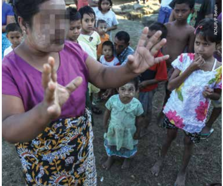
Una mujer expresa su frustración acerca de las condiciones de vida y la vida en general, desde que se vieron obligados a huir de su hogar en Set Yone Su, estado de Rakhine, durante la violencia en octubre de 2012. Cuenta como personas armadas obligaron a todos en su pueblo a huir antes de quemar sus casas y saquear sus pertenencias.

En Myanmar, algunos han requerido al Comité para el Estado de Derecho y la Tranquilidad (RLTC, por sus siglas en inglés) –dirigido por Daw Aung San Suu Kyi– que valore la cuestión de la Ley de Ciudadanía. El informe de 31 de julio de 2013 del Comité incluye la recomendación de que los Estados “deberían aspirar [sic] a un tipo de paz que permita a las personas y a las distintas nacionalidades