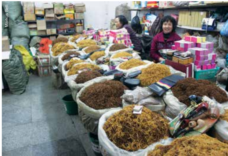
Los mercados ofrecen empleo temporal a los norcoreanos durante su a menudo lento movimiento hacia el sur. Yanji, provincia de Jilin, cerca de la frontera con Corea del Norte.

repatriación forzada cuando son arrestados por la policía china sino que también resultan presas fáciles para los traficantes de personas.