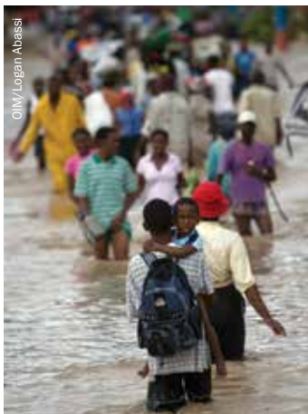
Haitianos vadeando las calles inundadas de Gonaïves después de que el huracán Hanna causara graves inundaciones, 2008.

Todavía no existe ningún acuerdo como tal en las directrices para llevar a cabo un reasentamiento preventivo o anticipado (es decir, antes de que se produzcan consecuencias importantes) o ni siquiera sobre los criterios que se considerarían necesarios para que tuviera lugar. La carencia de una definición internacionalmente clara sobre la falta de habitabilidad de un lugar y la probabilidad de que tales condiciones fueran debidas a múltiples factores hace que sea difícil determinar la causalidad y la responsabilidad. Además, no está claro si los residentes de una zona propensa a sufrir riesgos deberían trasladarse anticipándose a