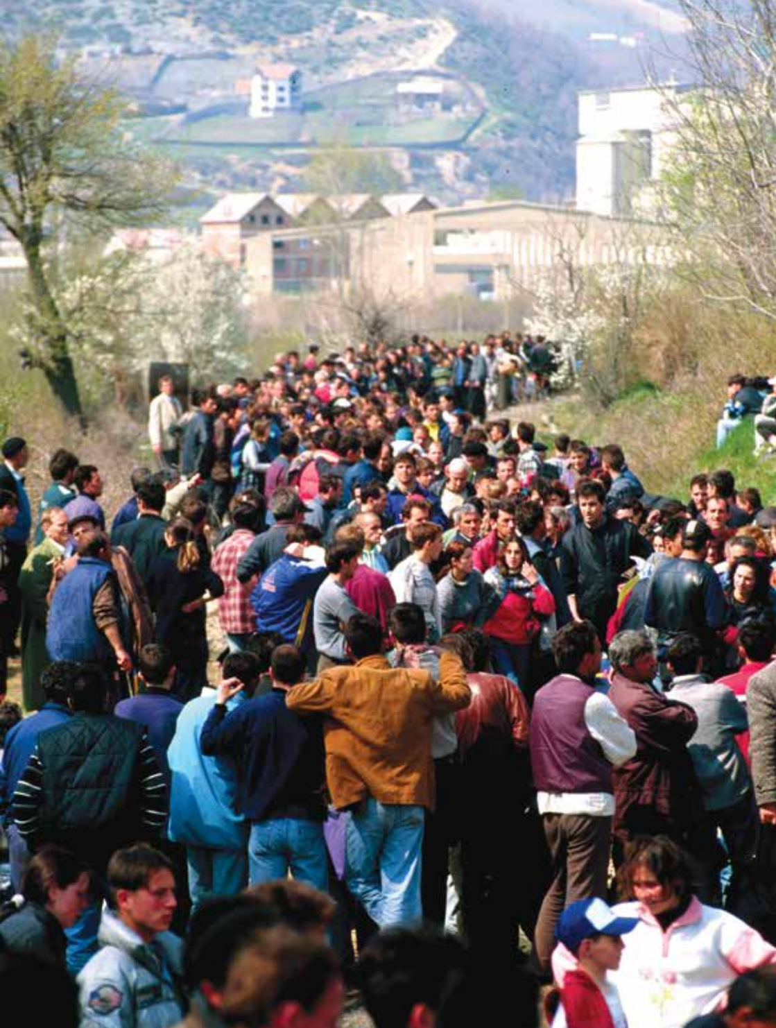
Refugiados albaneses de Kosova congregados en la frontera entre Kosovo y Macedonia, en mayo de 1999. Los refugiados fueron contenidos en el cruce fronterizo de Blace durante cinco días antes de que se les permitiera la entrada en Macedonia. El fotógrafo Howard Davies ha documentado la vida de los refugiados y solicitantes de asilo durante más de veinte años. Se pueden encontrar más fotografías de su extenso archivo en www.eye-camera.com