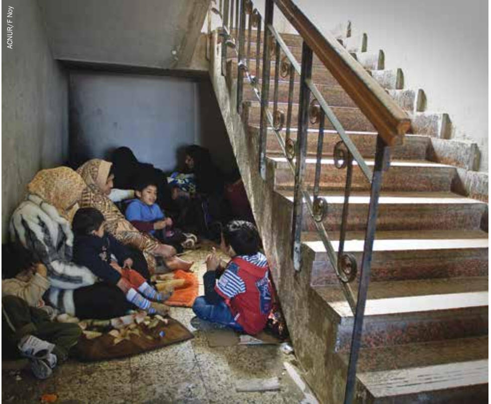
Familias de trabajadores migrantes esperan bajo una escalera en la terminal de llegadas del puesto fronterizo entre Egipto y Libia en Sallum, en espera de la autorización para entrar en Egipto, 2011.

de cruzar para los migrantes; de hecho, se han denunciado casos en los que los guardias fronterizos habrían disparado, a veces de forma mortal, a los migrantes que se acercaban a las fronteras.