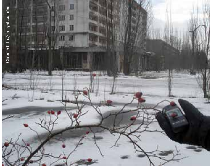
Comprobación de los niveles de radiactividad ambiental en el año 2011 en la ciudad abandonada de Pripyat, a 2 km de la central nuclear de Chernóbil.

Unos veinticinco años después, el accidente nuclear de Fukushima-Daiichi puso de relieve la cuestión sobre las enseñanzas extraídas y las que quedan por extraer de Chernóbil en términos de preparación y mitigación de los desastres nucleares pero también en términos de lagunas normativas y de implementación a la hora de lidiar con las consecuencias de estas crisis. En ambas, decenas de miles de personas fueron desplazadas de forma permanente de las inmediaciones; miles de ellas tomaron la decisión de mudarse debido al miedo por su salud, la degradación ambiental y la destrucción de las infraestructuras; millones permanecieron en zonas contaminadas debido a la ausencia de recursos y oportunidades, a sus limitaciones financieras y al especial apego hacia sus hogares.