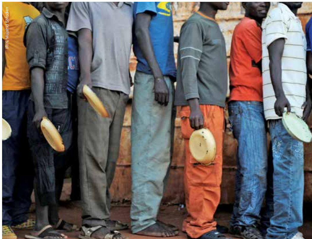
Migrantes y solicitantes de asilo en el refugio para hombres «Yo creo en la Iglesia de Jesús», en la ciudad fronteriza sudafricana de Musina haciendo cola para una comida caliente gratis, proporcionada por el ACNUR.

La protección de los zimbabuenses en Sudáfrica ha caído en los huecos entre diferentes mandatos de diferentes organizaciones internacionales. ACNUR ha considerado de forma firme que muchos zimbabuenses no eran refugiados; sólo el hecho de