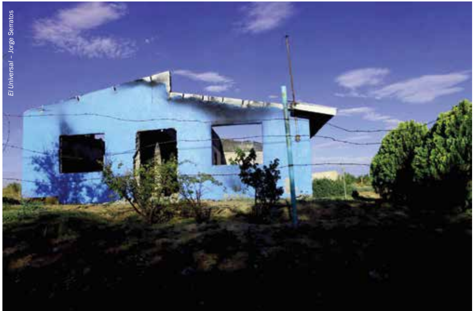
Casas abandonadas por los desplazados internos y vandalizadas por grupos criminales en El Porvenir, Chihuahua, 2010.

La gente que cruza las fronteras en busca de seguridad y protección como consecuencia de la violencia criminal –ya sea como consecuencia directa o anticipándose a amenazas– está cubierta