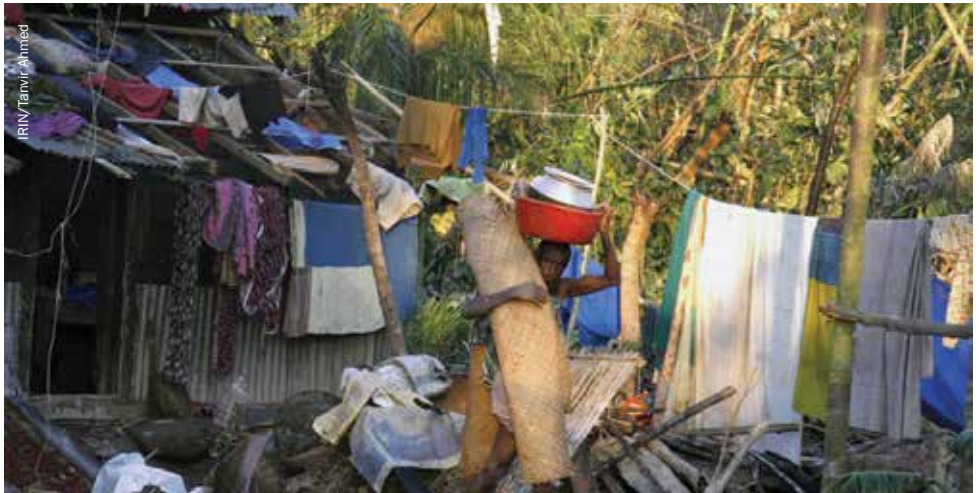
Un hogar devastado por un ciclón en el sur de Bangladesh, 2007.

Durante una campaña llevada a cabo para detectar lagunas en la protección y similitudes y diferencias de todos los traslados a lo largo de varias crisis,