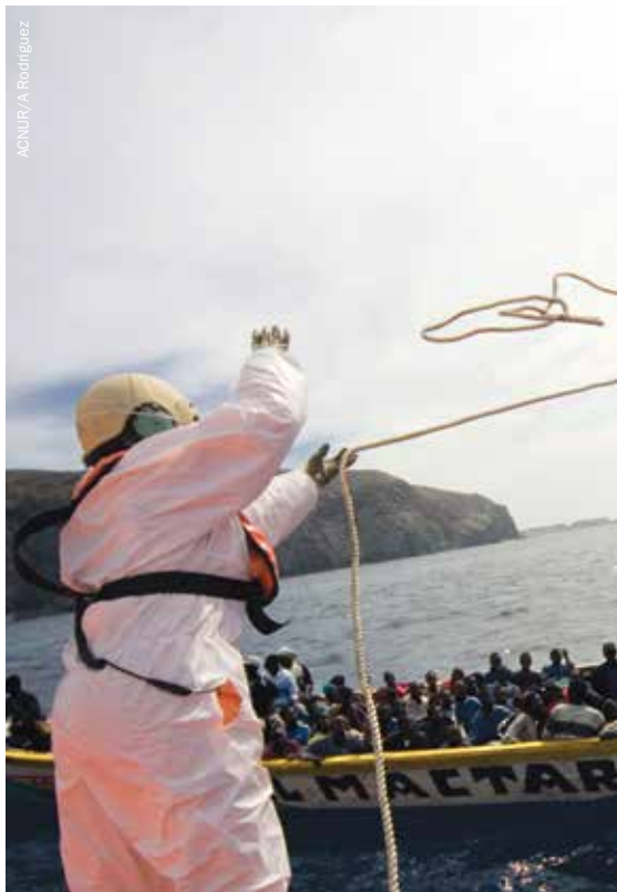
Guardacostas españoles de la isla de Tenerife en las Islas Canarias interceptan un bote de pesca que transporta inmigrantes africanos.

Incluso en ausencia de evidencia empírica que demuestre que la posibilidad de ser interceptadas afecta el “punto de inflexión” en el cual las personas deciden salir de su país, los Estados actúan basados en la creencia de que es un valioso elemento de disuasión. Durante muchos años, los EE.UU. han interceptado en el Caribe a cubanos, haitianos, dominicanos y personas de otras nacionalidades, y se han negado a permitir que estas personas interceptadas, incluyendo aquellas reconocidas como refugiadas, entren en su territorio. Para evitar las obligaciones que se derivarían del término “refugiado”, estos individuos son llamados