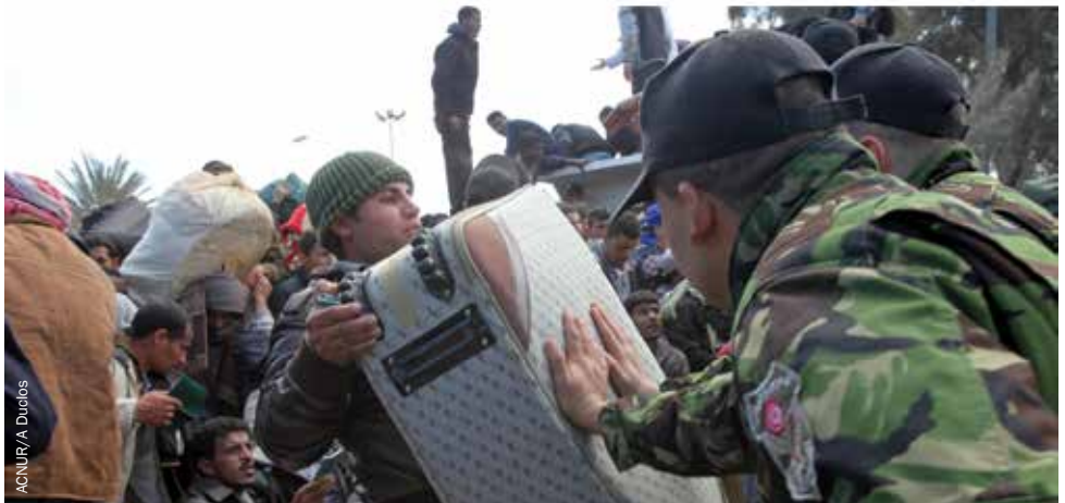
Funcionarios de fronteras tunecinos contienen a la multitud en la frontera entre Túnez y Libia en marzo de 2011, donde miles de personas ansiosas por salir de Libia –principalmente trabajadores migrantes de Túnez y Egipto– se reunieron en tierra de nadie.

Se requiere una mayor capacidad nacional para proteger y asistir a las personas desplazadas internas – incluyendo a quienes no son ciudadanas – durante las crisis, desde el establecimiento de un marco de respuesta que determine la asignación