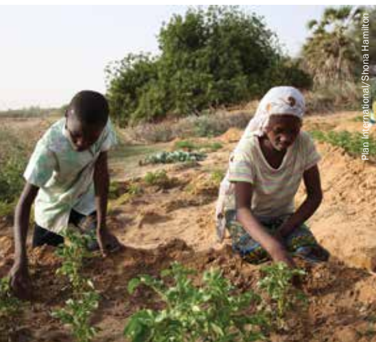
Plan Internacional/Shona Hamilton

Durante épocas de crisis relacionadas con las sequías y la consiguiente escasez de alimentos muchos actores que se centran en los menores se han enfocado básicamente en los niños más pequeños y, concretamente, en las altas tasas de mortalidad infantil y las grandes cifras de abandono en la escuela primaria. Se ha prestado poca atención a los niños más mayores, y en especial a las dinámicas de trabajo, migración y violencia que afectan a este colectivo. Los menores adolescentes – con