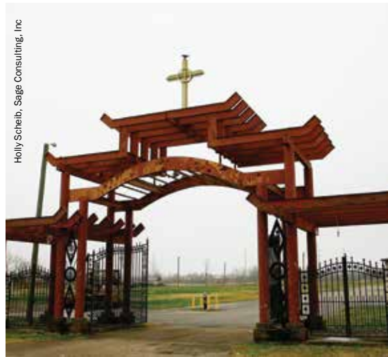
La entrada a la zona de parque situada frente a la Iglesia católica Reina María de Vietnam, el corazón cultural de Village L'Est en Nueva Orleans este.

prácticamente sin ningún hospital. De esta manera, a las personas con bajos ingresos forzadas a migrar por el desastre y que dependían de la asistencia pública se les prohibió efectivamente retornar a Nueva Orleans debido al cese de la asistencia pública en estos sectores esenciales. Independientemente de los efectos reales sobre las personas, estos cambios fueron racionalizados como un medio para proteger el bienestar de los evacuados “por su propio bien”, subsumiendo cualquier cuestión de derechos ciudadanos y recursos a la justicia.