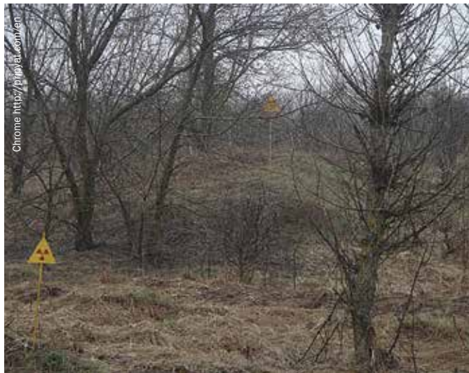
La aldea enterrada de Kopaci, situado a 7 km de la central nuclear de Chernóbil. Después de la evacuación, muchos pueblos fueron demolidos y enterrados, debido a los altos niveles de contaminación.

campamentos de verano y a las mujeres embarazadas y a las madres con niños pequeños y bebés a hoteles, casas de reposo, sanatorios e instalaciones turísticas, dividiendo así a muchas familias con poca consideración sobre los efectos sociales a largo plazo.