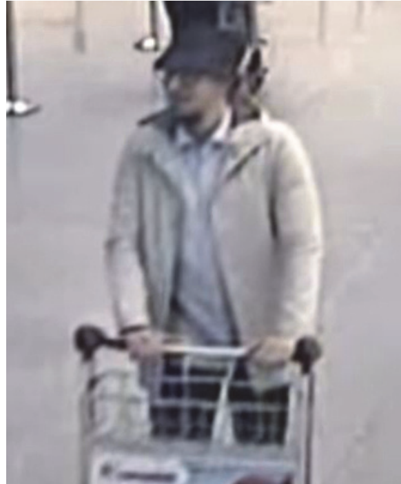
Image des caméras de vidéosurveillance de l'aéroport belge de Zaventem de l'« homme au chapeau », l'un des principaux suspects de l'attentat de l'aéroport.