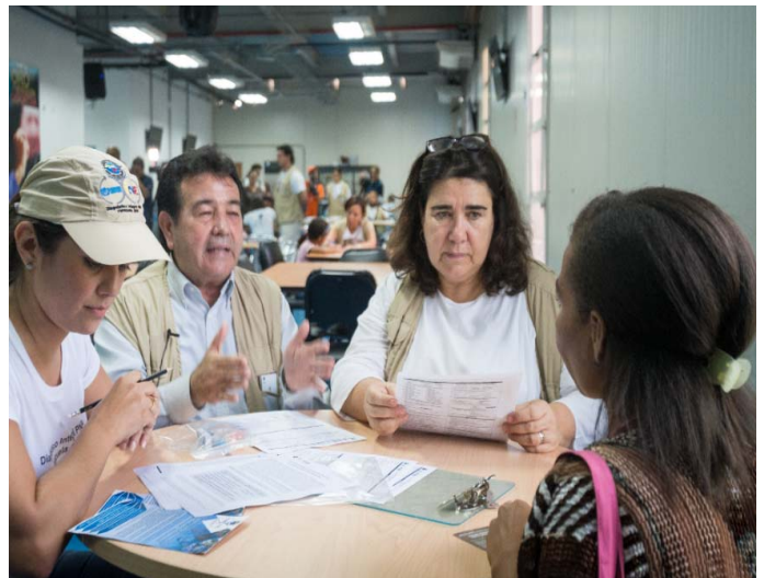
© ACNUR / Octubre de 2016 / estado Zulia, Venezuela / Wao Producciones.

Representante del Gobierno de Venezuela, la Directora Regional del ACNUR y personal del ACNUR entrevistando a una solicitante de asilo durante el lanzamiento del ejercicio de identificación de perfiles.