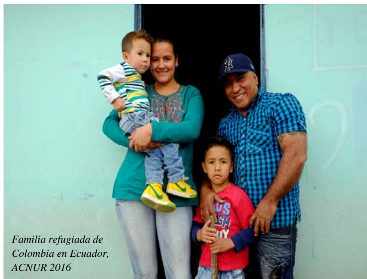
Familia refugiada de Colombia en Ecuador, ACNUR 2016