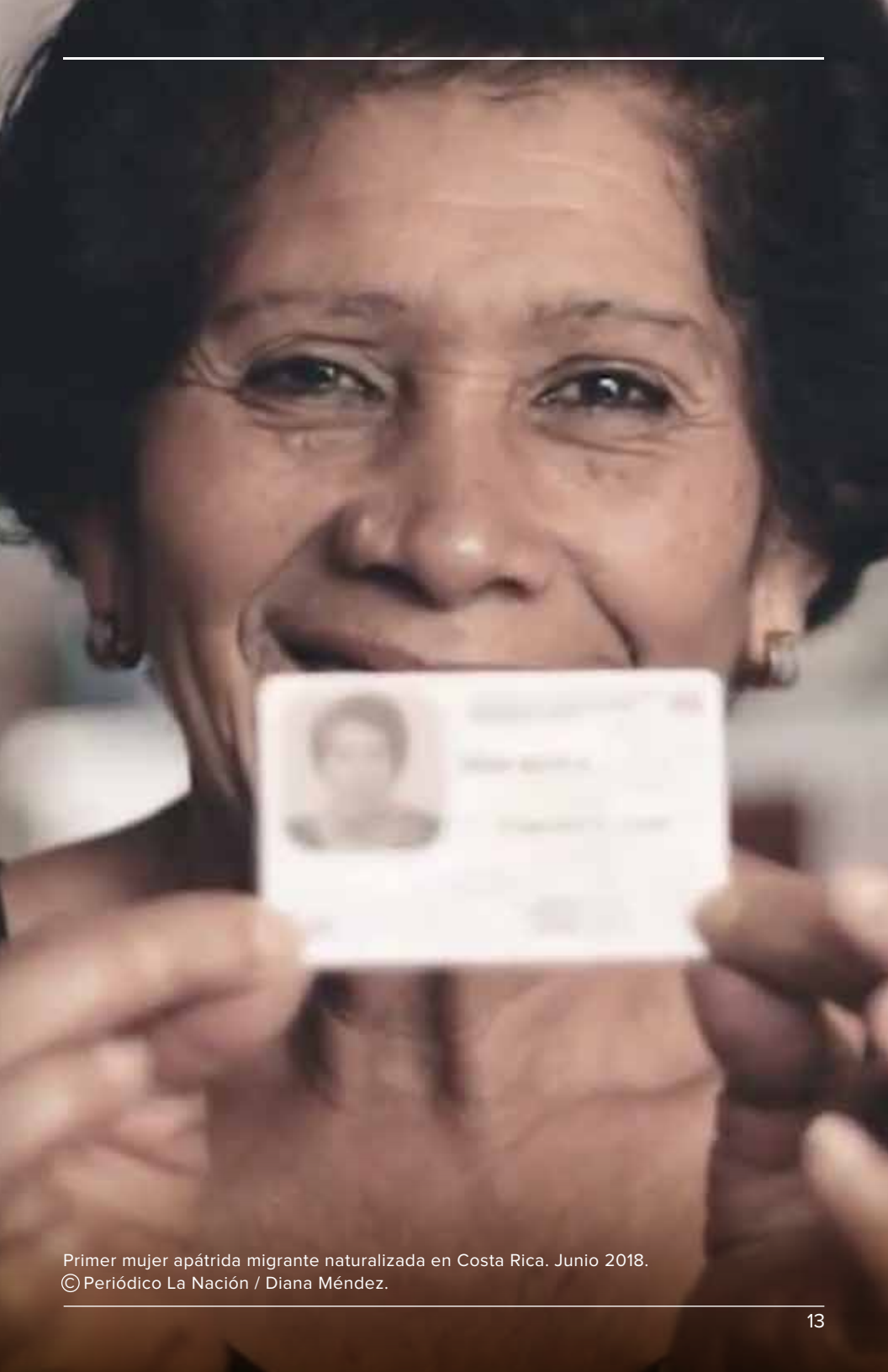
Primer mujer apátrida migrante naturalizada en Costa Rica. Junio 2018.