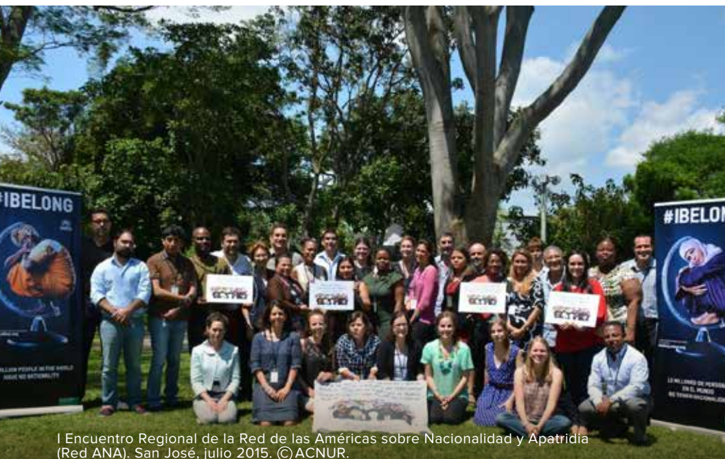
I Encuentro Regional de la Red de las Américas sobre Nacionalidad y Apatridia (Red ANA). San José, julio 2015.

Por ejemplo, en un país que no es Estado Parte en las convenciones sobre apatridia, el informe de evaluación recomendará la adhesión a dichos instrumentos internacionales. Si el Estado acepta voluntariamente la recomendación y define esta acción como prioritaria a nivel nacional, el COP del ACNUR podría fijar como meta la adhesión a las convenciones sobre apatridia, identificando las actividades y recursos financieros necesarios para lograrlo. De igual modo, dicha acción/meta podría hacer parte de un Plan Nacional de Derechos Humanos del país. Independientemente de la metodología escogida, el Estado junto con el ACNUR, definirá las actividades de implementación necesarias (ej. apoyo financiero para la realización de talleres de capacitación y difusión, apoyo para la participación en cursos internacionales, etc.)