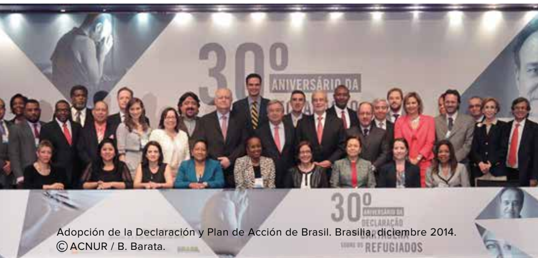
Adopción de la Declaración y Plan de Acción de Brasil. Brasilia, diciembre 2014.

En noviembre de 2014, el ACNUR lanzó la campaña #IBelong 2 con miras a erradicar la apatridia en el mundo antes de 2024. Con este propósito, y en consulta con los Estados, la sociedad civil y las organizaciones internacionales, el ACNUR desarrolló el Plan de Acción Mundial para Acabar con la Apatridia (“Plan de Acción Mundial”) 3 , proponiendo un marco estratégico comprensivo de diez acciones para resolver situaciones existentes de apatridia, prevenir el surgimiento de nuevos casos de apatridia, e identificar y proteger mejor a las personas apátridas 4 .