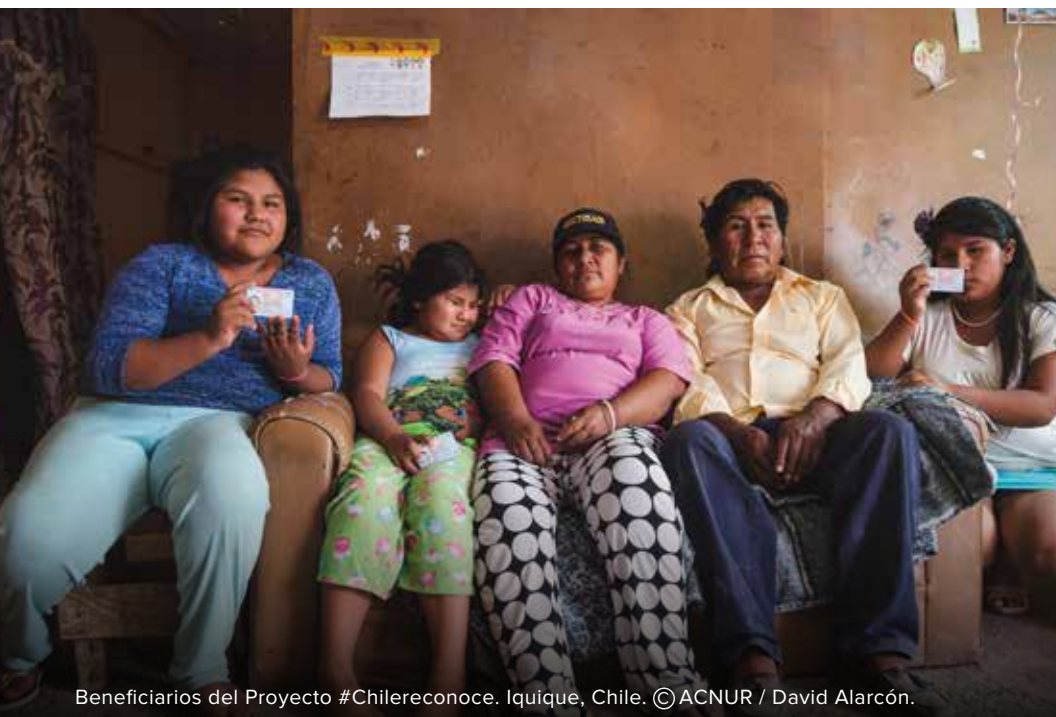
Beneficiarios del Proyecto #Chilereconoce. Iquique, Chile.

El Estado y oficina del ACNUR concernida determinarán la mejor forma de llevar adelante la evaluación inicial, a nivel nacional. En ciertos países, el Estado podría beneficiarse del apoyo del ACNUR para la contratación de un consultor nacional, o estar dispuesto a recibir el apoyo de un consultor regional del ACNUR, o de instancias técnicas regionales con experiencia en la materia (ej. IPPDH). De igual modo, un país podría querer constituir un grupo de trabajo gubernamental, o diseñarse una estrategia o metodología alternativa de recolección de información.