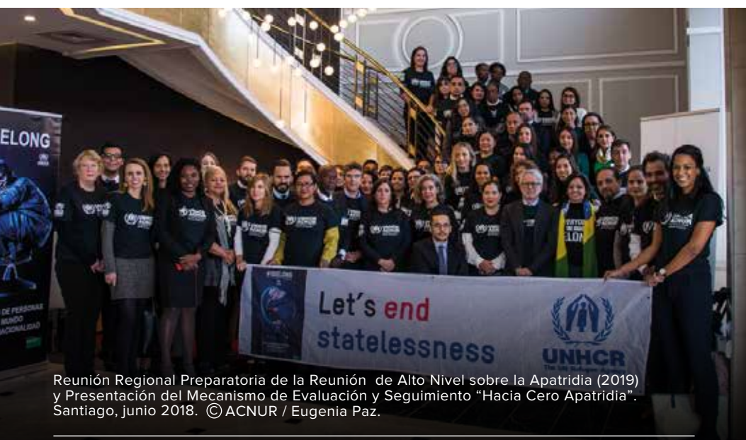
Reunión Regional Preparatoria de la Reunión de Alto Nivel sobre la Apatridia (2019) y Presentación del Mecanismo de Evaluación y Seguimiento "Hacia Cero Apatridia". Santiago, junio 2018.