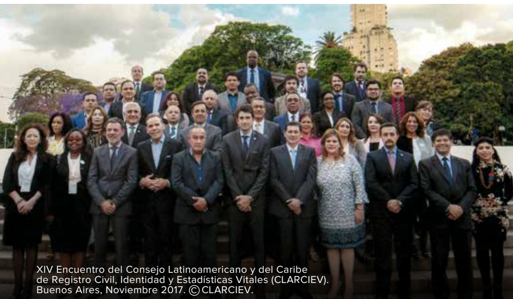
XIV Encuentro del Consejo Latinoamericano y del Caribe de Registro Civil, Identidad y Estadísticas Vitales (CLARCIEV). Buenos Aires, Noviembre 2017.