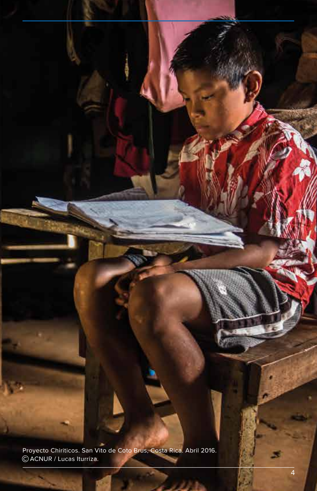
Proyecto Chiriticos. San Vito de Coto Brus, Costa Rica. Abril 2016.