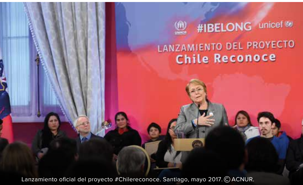
Lanzamiento oficial del proyecto #Chilereconoce. Santiago, mayo 2017.