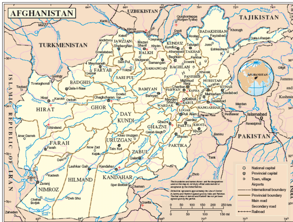
Map No. 3959 Rev. 5 UNITED NATIONS October 2005