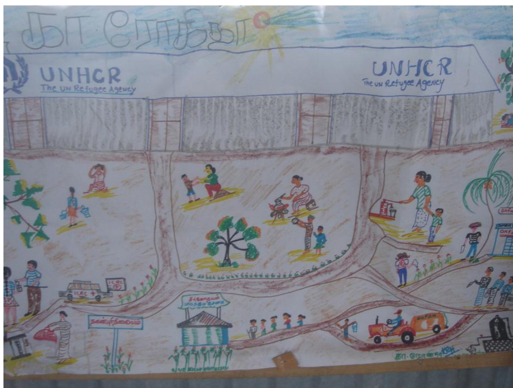
Рисунок ребенка, лагерь для ВПЛ, Тринкомале, Шри-Ланка, 2007 год

Для использования приведенных выше методов требуются аналитические навыки и наблюдательность, чтобы обеспечить точность полученной информации. Применяя каждый из данных методов, необходимо учитывать культурные и языковые особенности. Для персонала необходимо провести обучение по вопросам использования данных методов, а также по вопросам участия детей и принципам работы с детьми, чтобы обеспечить применение принципов наилучших интересов ребенка и «не навреди».