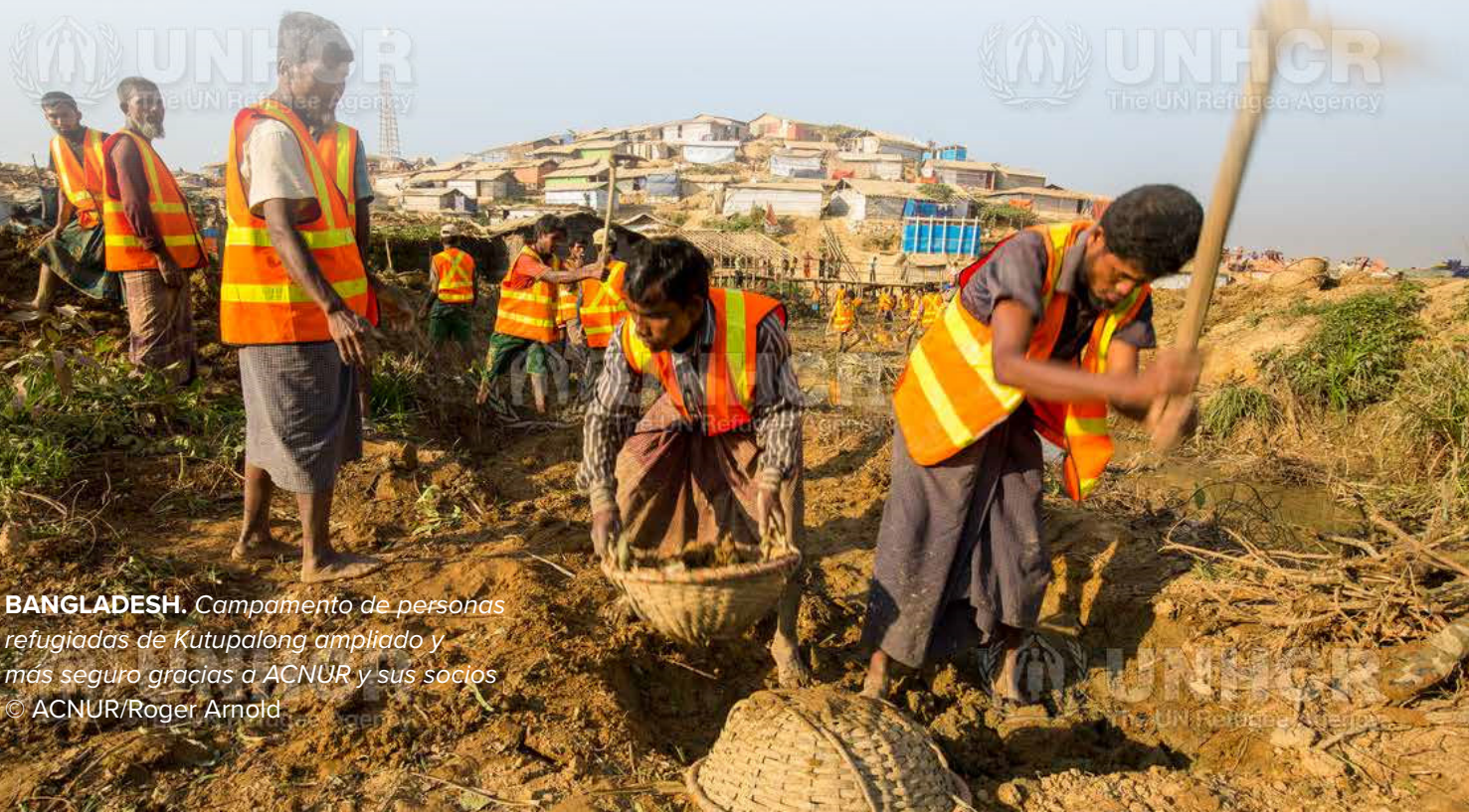
BANGLADESH. Campamento de personas refugiadas de Kutupalong ampliado y más seguro gracias a ACNUR y sus socios

En todos los pilares de acción, la organización adopta un enfoque basado en los derechos y la evidencia con el objetivo de abordar los problemas de desplazamiento y apatridia. En colaboración con un creciente número de aliados humanitarios y de desarrollo, actuamos como catalizadores de soluciones sostenibles y de protección en el contexto del cambio climático. Abogamos por que las personas desplazadas y apátridas se representen por su cuenta en foros sobre políticas y participen en las decisiones que afectan su resiliencia ante el riesgo climático y ambiental.