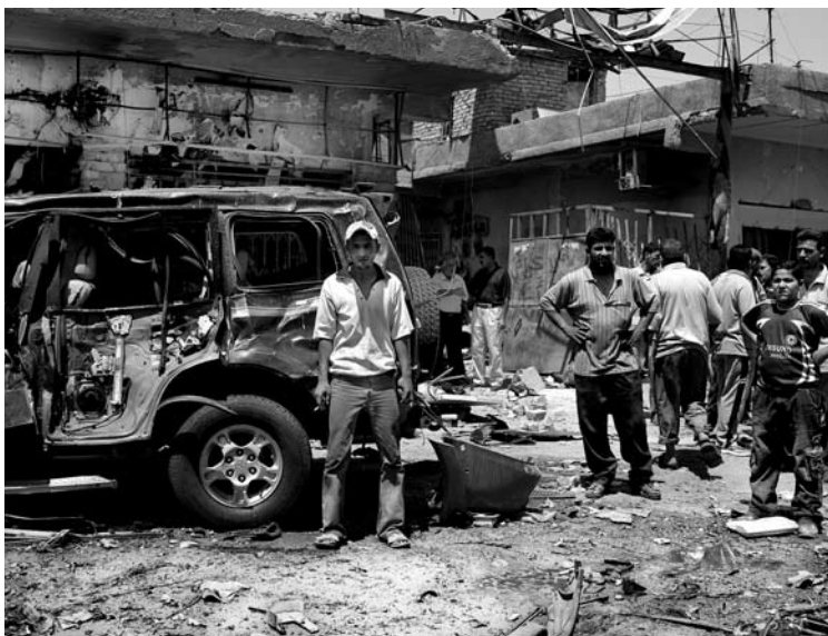
Foto ▼ Personas en el escenario de la explosión de un coche bomba en el distrito de Campsara en Bagdad, 2008.

el número de homicidios por cada 100.000 personas.