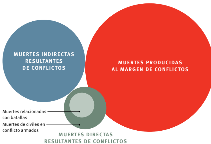
FIGURA 1 Categorías de muertes

dos tercios (66 por ciento) del total. 4 Detrás de ello se halla el incontable número de personas lesionadas física o psicológicamente que soportan también con parte del peso global de la violencia armada.