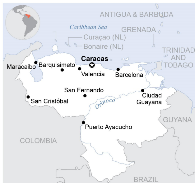
Los límites y los nombres que se muestran y las designaciones utilizadas en este mapa no implican la aprobación oficial de las Naciones Unidas.