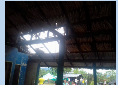
Condiciones Casa Indígena, Puerto Libertador, Córdoba.

● La Defensoría había alertado sobre los constantes enfrentamientos en el municipio de Florida, Valle del Cauca, mediante la Alerta Temprana 074 de 2018.