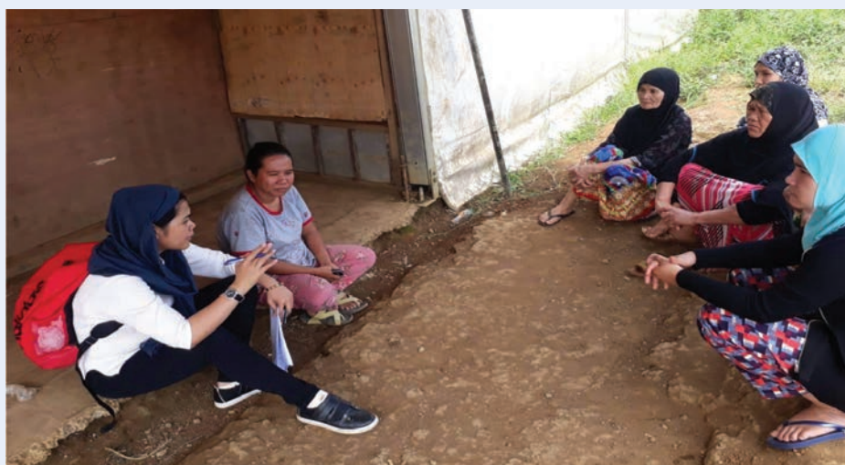
Entrevista con mujeres líderes de personas desplazadas internas en un centro de evacuación en la ciudad de Marawi, mayo de 2019

En las Filipinas , la Comisión de derechos humanos estableció una oficina regional con sede en la Región Autónoma del Mindanao Musulmán, afectada por el conflicto. Esta oficina regional fue un buen ejemplo de cómo la descentralización de las funciones relacionadas con las personas desplazadas internas, por ejemplo la vigilancia de las personas desplazadas internas, puede ser particularmente útil en los casos en que una región del país precisa de una labor de protección de las personas desplazadas internas más intensiva que otras.