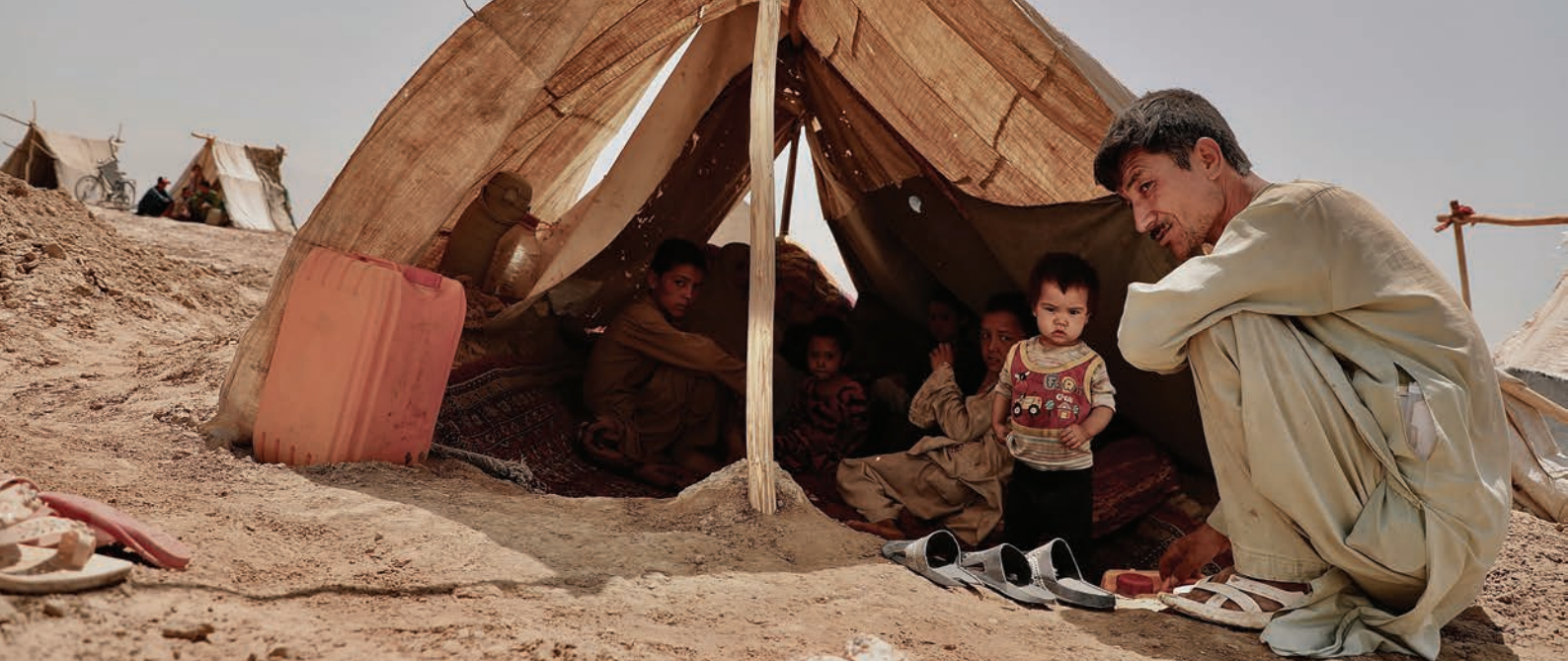
Las familias desplazadas por el conflicto en el Afganistán se ven obligadas a vivir en tiendas de campaña improvisadas en el asentamiento de Bricade (2021).