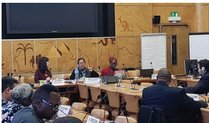
La Relatora Especial sobre los derechos humanos de los desplazados internos abriendo la mesa redonda de 2018 con las INDH

Este manual ha sido elaborado durante la pandemia de la COVID-19, que ha golpeado de manera dramática a los más vulnerables, entre ellos muchas personas desplazadas internas. Ser testigos de este impacto nos ha recordado con crudeza que es muy importante aplicar un enfoque basado en los derechos humanos que priorice el respeto, la promoción, la protección y el cumplimiento de los derechos de todos, y especialmente de las personas en situaciones de vulnerabilidad. Por tanto, la función fundamental que pueden desempeñar las INDH nunca ha sido tan evidente.