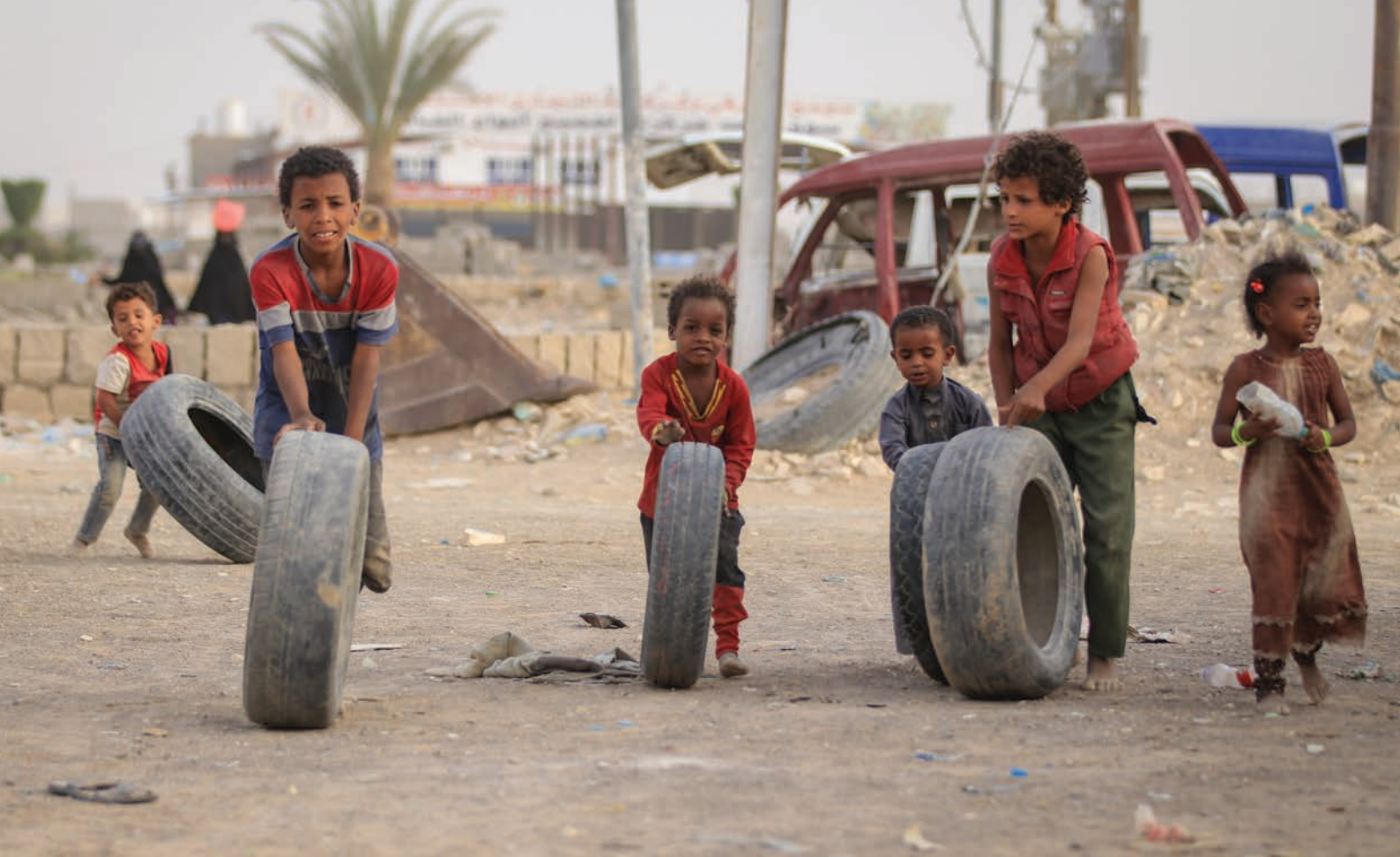
Niños desplazados juegan con neumáticos en el campamento de Al-Rawdah en Marib, el Yemen (2021).