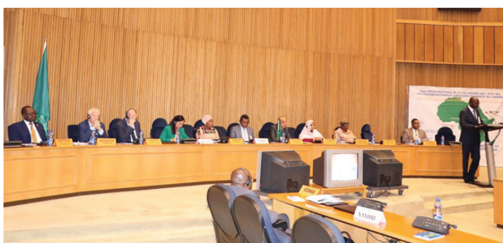
Sesión de apertura del Foro de políticas AUC-RINADH sobre el estado de las instituciones africanas de derechos humanos, 5 de septiembre de 2019.

Como parte de esta cooperación, las dos instituciones trabajaron con el ACNUDH y el PNUD en la organización del tercer Foro de políticas sobre el estado de los derechos humanos en África en 2019, que se centró en soluciones duraderas al desplazamiento forzado. Algo en consonancia con el lema de la Unión Africana (UA) en 2019: “Refugiados, Retornados y Desplazados internos: Hacia soluciones duraderas al desplazamiento forzado en África”. En este foro, las partes interesadas desarrollaron y adoptaron un plan de acción continental sobre la contribución de las INDH a las soluciones duraderas sobre los desplazamientos forzados en África, con un fuerte enfoque en la promoción de la Convención de Kampala. 69