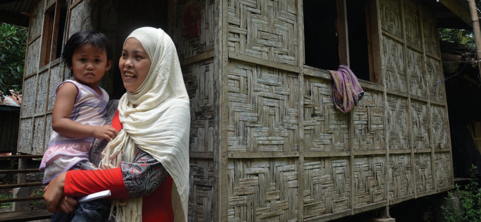
Una mujer desplazada con su hija en Madiya, Filipinas (2017).