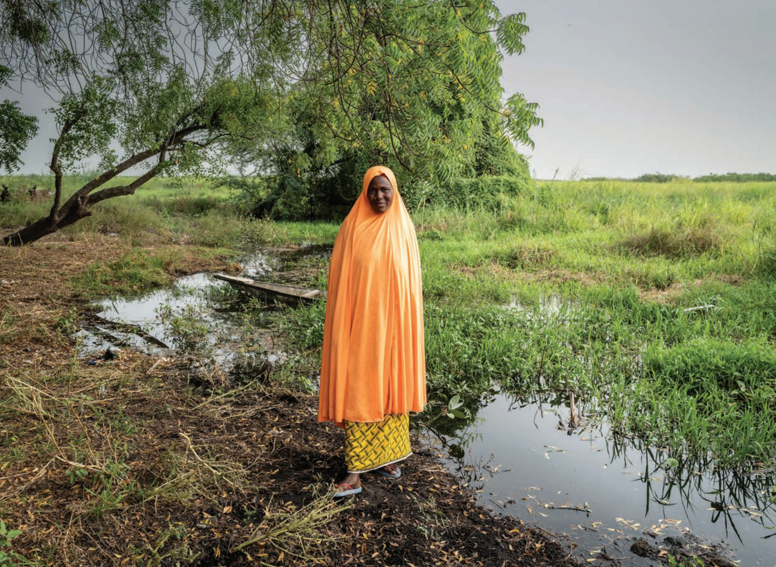
Una mujer chadiana, de 40 años, se vio obligada a huir a Baga Sola en la región de Lac después de que Teteoua, su aldea, fuera atacada por militantes de Boko Haram en 2015 (2021).