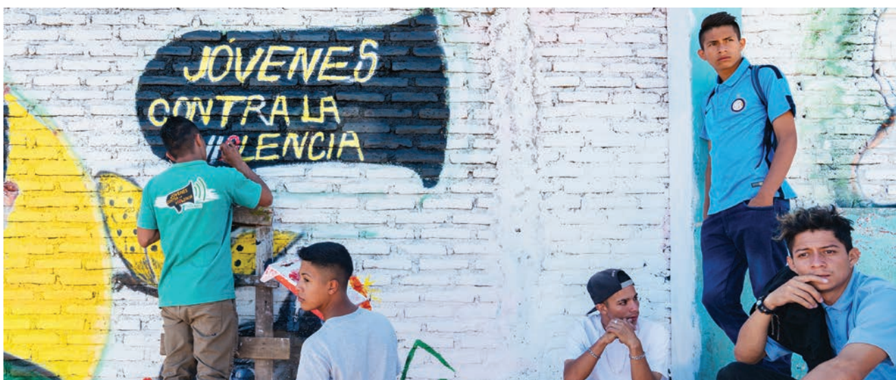
Líderes y voluntarios de la organización 'Jóvenes contra la violencia' en Colonia Nueva Capital, Tegucigalpa, Honduras. La organización trabaja en todo el país para empoderar a los jóvenes a través de actividades de consolidación de la paz. Su fundador y director, junto con su familia, son personas desplazadas internas.