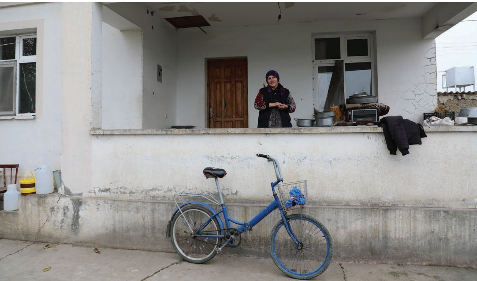
Una desplazada interna azerbaiyana de 51 años fue desplazada del asentamiento Dordyol 1 en el distrito de Agdam, cerca del territorio en disputa de Nagorno-Karabaj (2020).

En repetidas ocasiones se ha mencionado que disponer de fondos insuficientes y de una financiación irregular constituye un obstáculo para la labor de las INDH, que limita su capacidad de ocuparse de los derechos humanos de las personas desplazadas internas. En la medida en que sea pertinente y factible, el presupuesto básico de las INDH debe incluir una financiación específica para actividades relacionadas con los desplazamientos internos que permita abordarlos en el marco de sus actividades básicas y de largo plazo, en lugar hacerlo mediante fondos temporales puntuales o basados en proyectos. Aunque los gobiernos deberían garantizar legalmente una financiación adecuada y al mismo tiempo preservar su capacidad de trabajar de forma independiente, las INDH a menudo deben ampliar su labor utilizando los recursos existentes, con las obvias consecuencias que esto entraña. La capacidad de las instituciones para recibir financiación externa, de acuerdo con los Principios de París, 34 reviste particular importancia, al igual que la necesidad de trabajar con los donantes para que conozcan mejor la función fundamental y el valor de las INDH en este ámbito.