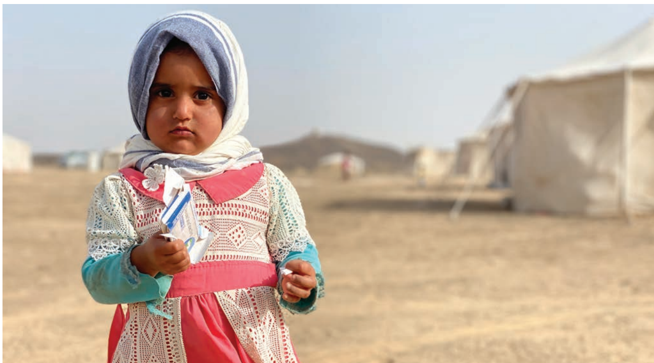
Una niña yemení de dos años, desplazada por el conflicto en Al Jawf, en el centro de acogida de personas desplazadas internas en Marib, el Yemen (2020).

En 2019, la Comisión, en colaboración con las autoridades gubernamentales pertinentes, organizó una “jornada de prestación de servicios móviles” con el objetivo de facilitar el encuentro personal entre las comunidades y los proveedores de servicios. La Comisión anunció la celebración de dicha jornada en los medios de comunicación y en distintos folletos. Entre las instituciones públicas invitadas se encontraban la Secretaria de División, oficiales de distintos ámbitos (desarrollo de la mujer, tierras, libertad condicional, registro), la policía, oficiales de salud, oficiales de trabajo, oficiales de asistencia jurídica y de pesca. Las autoridades tuvieron así la oportunidad de identificar y emprender acciones a corto, a mediano y a largo plazo para abordar los problemas prolongados a los que se enfrentan las personas desplazadas internas y retornadas, y que la Comisión de Derechos Humanos continuó supervisando.