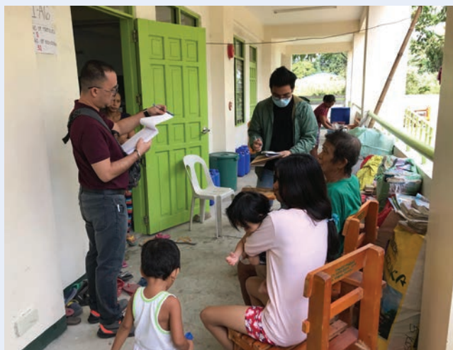
Entrevistas con familias de personas desplazadas internas afectadas por la erupción del volcán Taal en un sitio de evacuación en Balayan, Batangas, febrero de 2020

Las Filipinas es un país afectado por desplazamientos internos recurrentes provocados por una variedad de causas como desastres resultantes de peligros naturales, conflictos y desarrollo a gran escala. En este contexto, la Comisión de Derechos humanos de las Filipinas, que tiene un amplio mandato para la protección y promoción de los derechos humanos, 49 ha trabajado en estrecha colaboración con el ACNUR para abordar los desplazamientos internos, concretamente a través del establecimiento de un proyecto conjunto sobre personas desplazadas internas. Uno de los resultados concretos de dicho proyecto fue el desarrollo de una herramienta de vigilancia del desplazamiento , así como una Guía del usuario 50 y una Guía de entrevistas para ayudar al personal sobre el terreno en la recopilación y análisis de datos. La herramienta está destinada al personal de la Comisión y a los asociados que participan en las misiones de vigilancia para determinar las condiciones de las personas desplazadas internas sobre el terreno.