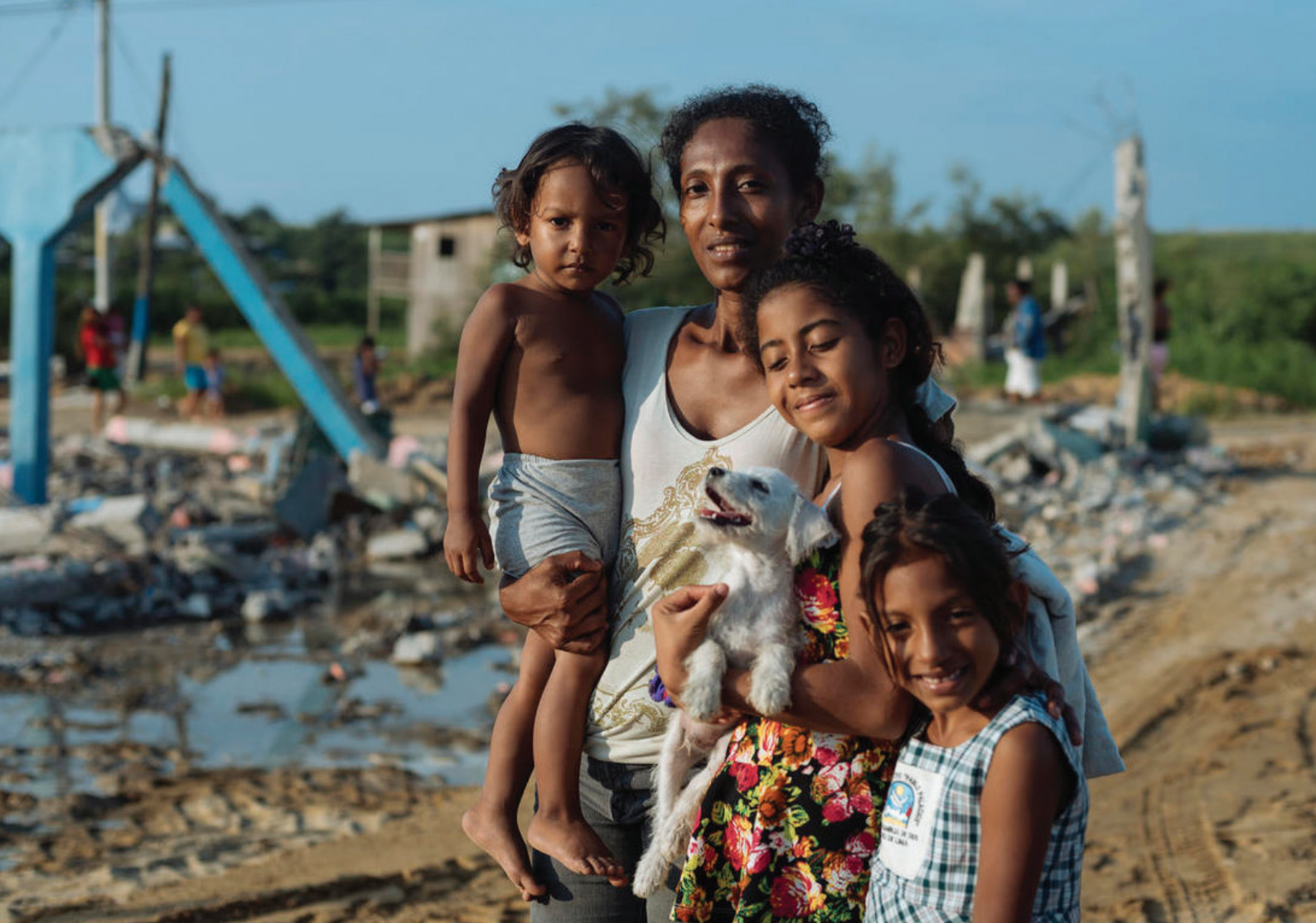
Una mujer ecuatoriana y sus hijos se quedaron sin hogar después de que el terremoto destruyera el 90% de las casas en Chamanga, Ecuador (2016).