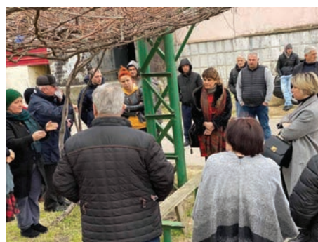
Reunión del Defensor público con personas desplazadas internas que viven en Poti en febrero de 2020.

Por ejemplo en Georgia , en 2013, la Defensoría del Pueblo y varias organizaciones de la sociedad civil y organizaciones internacionales llevaron a cabo una labor de vigilancia conjunta para evaluar el cumplimiento de los derechos humanos de un nuevo proceso de registro a nivel nacional para las personas desplazadas internas impulsado por el Estado. Esta vigilancia permitió a la INDH recopilar información detallada sobre la situación de las personas desplazadas internas, identificar deficiencias en la legislación y la práctica, y asesorar a los órganos estatales sobre las acciones necesarias. La Defensoría del Pueblo también ha desarrollado sólidos sistemas de vigilancia de la situación de las viviendas de las personas desplazadas internas, proporcionando recomendaciones periódicas a través de informes anuales y especiales a los organismos estatales sobre alojamientos peligrosos y asesorando a los responsables de la toma de decisiones sobre la reubicación de las personas desplazadas internas como parte del programa de soluciones de vivienda duradera. 47