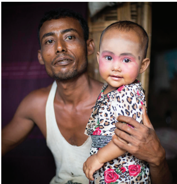
Un padre rohingya desplazado y su hijo en el campo de Dar Paing para personas desplazadas internas de Sittwe, estado de Rakhine, Myanmar (2017).