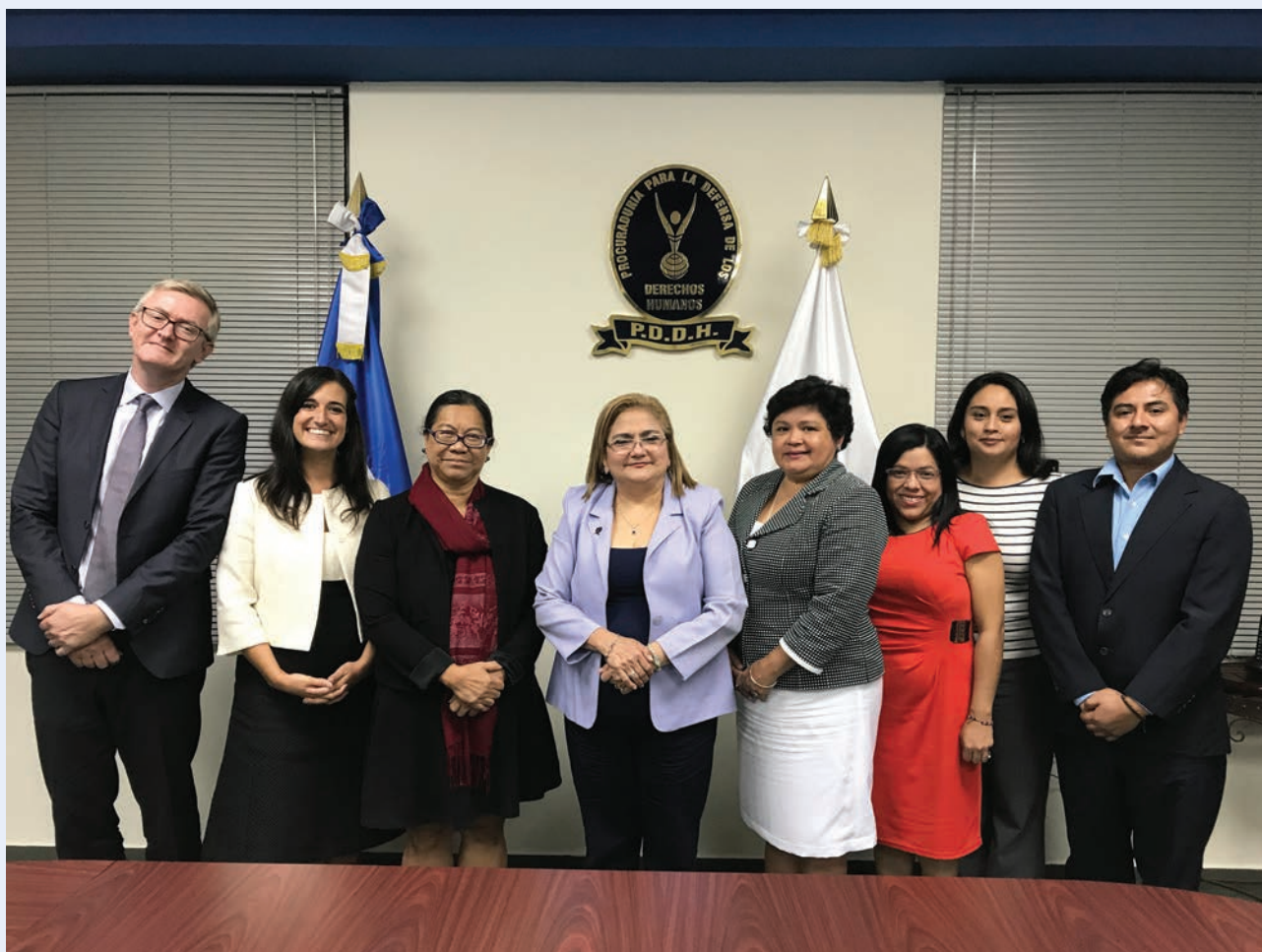
Encuentro entre la Relatora Especial y la Defensora del Pueblo de El Salvador durante su misión oficial al país en 2017

Las violaciones de los derechos humanos son tanto una causa como una consecuencia de los desplazamientos internos, y el riesgo de que se vulneren aumenta durante los desplazamientos. Periódicamente, tanto en eventos como durante sus visitas a los países, la Relatora Especial se reúne con las INDH en que le transmiten documentos e información para sus comunicaciones a los Estados sobre violaciones de los derechos humanos de las personas desplazadas internas. La Relatora Especial ha participado en numerosas reuniones y eventos para hablar y promover la función de las INDH en relación con el desplazamiento interno. También reflexiona sobre los análisis y problemas de las INDH en su país y los informes temáticos, prestando especial atención a la protección y la vigilancia, las leyes y políticas y la promoción de la participación de las personas desplazadas internas. Puede contactar con la Relatora Especial en mdp@ohchr.org .