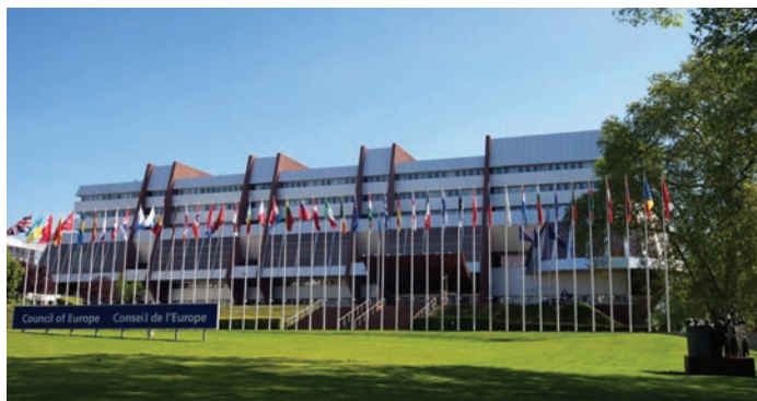
Palacio de l'Europa.

Además, al tiempo que respalda los Principios rectores, el Comité de Ministros del Consejo de Europa ha reconocido que las personas desplazadas internas “tienen necesidades específicas en virtud de su desplazamiento” y ha desarrollado un conjunto de 13 principios para guiar a los Estados miembros “al formular su legislación y práctica internas” para garantizar que abordan eficazmente los desplazamientos internos. 94 De manera similar, en una recomendación reciente, aunque no específicamente centrada en las personas desplazadas internas, el Comité de Ministros hizo hincapié en el “gran potencial e impacto de las INDH independientes para la promoción y protección de los derechos humanos en Europa” y formuló una serie de recomendaciones instando a la creación y el fortalecimiento de las INDH y también a la instauración y el desarrollo de un entorno seguro y propicio así como a la promoción de la cooperación y el apoyo a las INDH. 95 En la misma línea, la Asamblea Parlamentaria del Consejo de Europa (APCE) ha adoptado varias recomendaciones y resoluciones que hacen hincapié, entre otras cosas, en la necesidad de “asistencia internacional continua a las personas desplazadas internas” y en la importante función que pueden desempeñar las INDH en el seguimiento y la protección de los derechos de las personas desplazadas internas. 96