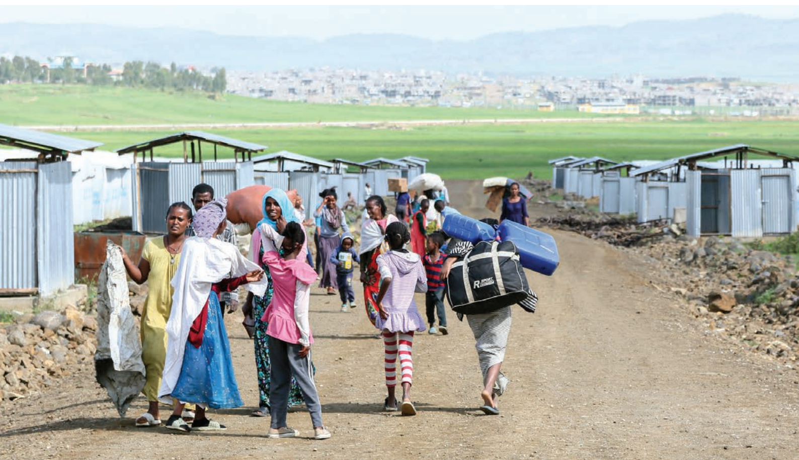
La reubicación de las personas desplazadas internas en Sabacare 4, un nuevo sitio construido para alojar a las personas desplazadas internas que no pueden regresar a sus hogares en Etiopía (2019).

→ Más información sobre el proyecto y el papel de la Comisión en este vídeo: www.zhrc.org.zw/videos/ .