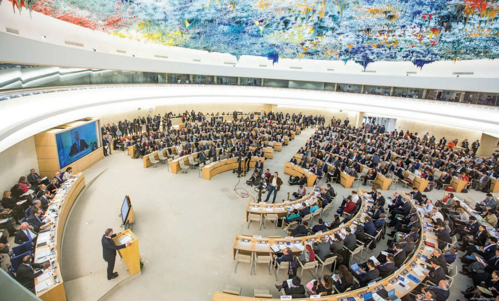
UN Human Rights Council.