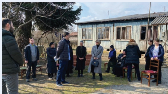
Visita del defensor público a las personas desplazadas internas en Shamgona Village (crédito: Defensoría del Pueblo de Georgia)

La Defensoría del Pueblo de Georgia, que fue creada en 1996, ha adquirido una sólida experiencia en la promoción y protección de los derechos humanos de las personas desplazadas internas de las zonas afectadas por conflictos. Recibe e investiga un gran número de denuncias relacionadas con el desplazamiento interno. Los representantes regionales de la Defensoría del Pueblo de Georgia realizan un seguimiento estrecho de la situación de las PDI en los antiguos asentamientos de personas desplazadas internas y les prestan asistencia jurídica. Informan sobre los problemas identificados durante las visitas dentro del ámbito de su competencia y colaboran con el gobierno local para solucionarlos. La Defensoría del Pueblo de Georgia también dedica un capítulo específico de su informe parlamentario anual a los derechos de las PDI.