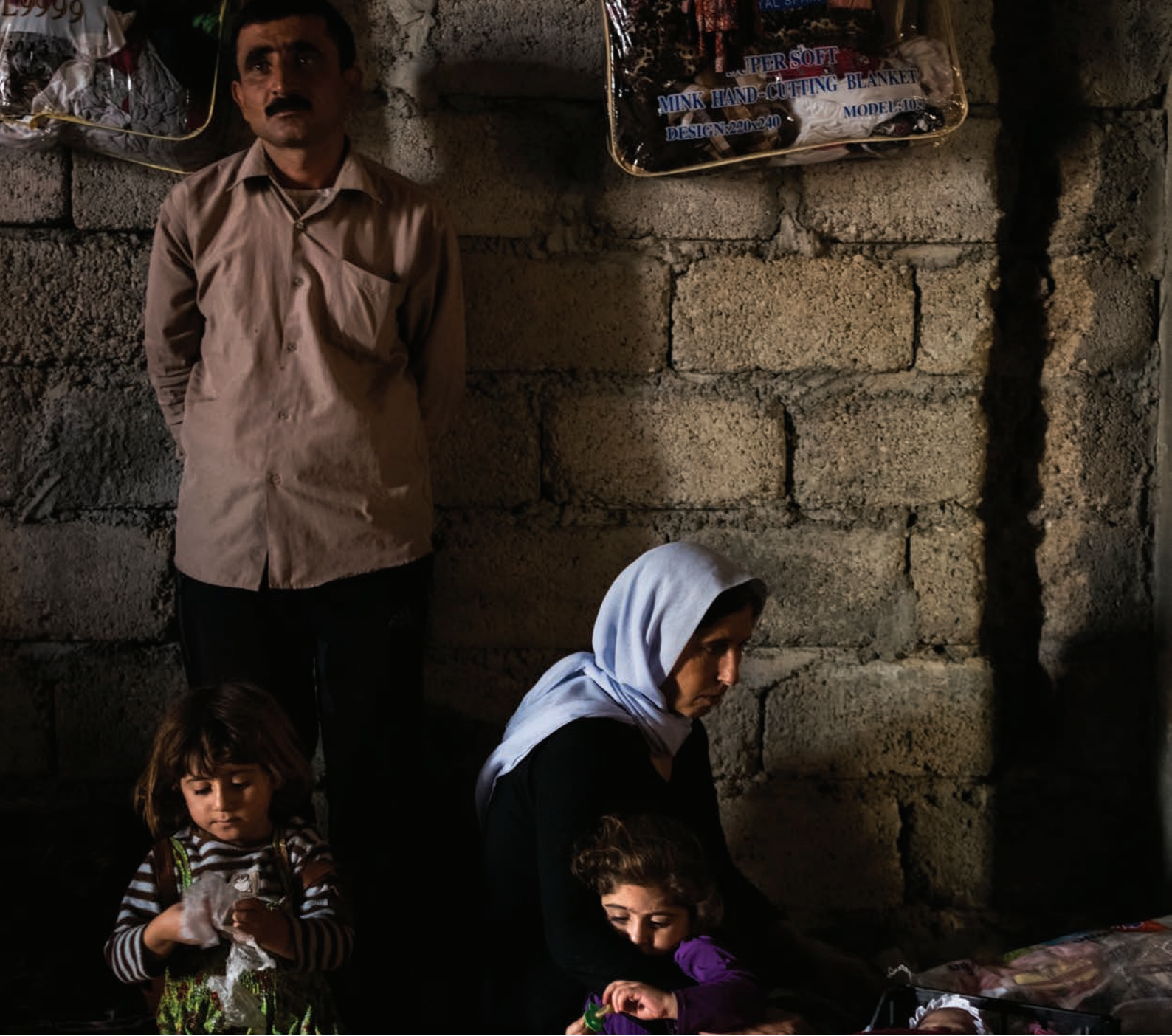
La familia de Ado, de 32 años, escapó cuando el ISIS atacó la aldea en la que vivía con su esposa y ocho hijos, cerca de Sinjar, y se estableció en Dohuk, el Iraq (2014).