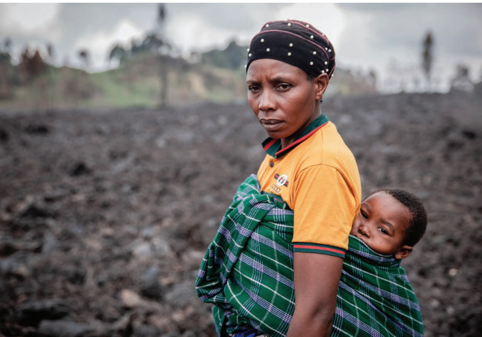
República Democrática del Congo: más de 350.000 personas fueron desplazadas por la erupción del volcán Nyiragongo en Goma. Una mujer desplazada, de 40 años, visita el lugar donde una vez estuvo su casa con uno de sus 7 hijos (junio de 2021).

La Comisión se ha mostrado decidida a seguir abogando no solo por la plena aplicación de esta decisión en beneficio de los Endorois, sino también por reformas legales, políticas e institucionales integrales para proteger los derechos de las comunidades locales y los pueblos indígenas en circunstancias similares. Este ejemplo ilustra la necesidad de realizar un esfuerzo estratégico de colaboración, sostenido y en múltiples frentes por parte de las comunidades, la sociedad civil y las INDH para promover y proteger los derechos de los ciudadanos vulnerables, en particular contra los desalojos forzados.