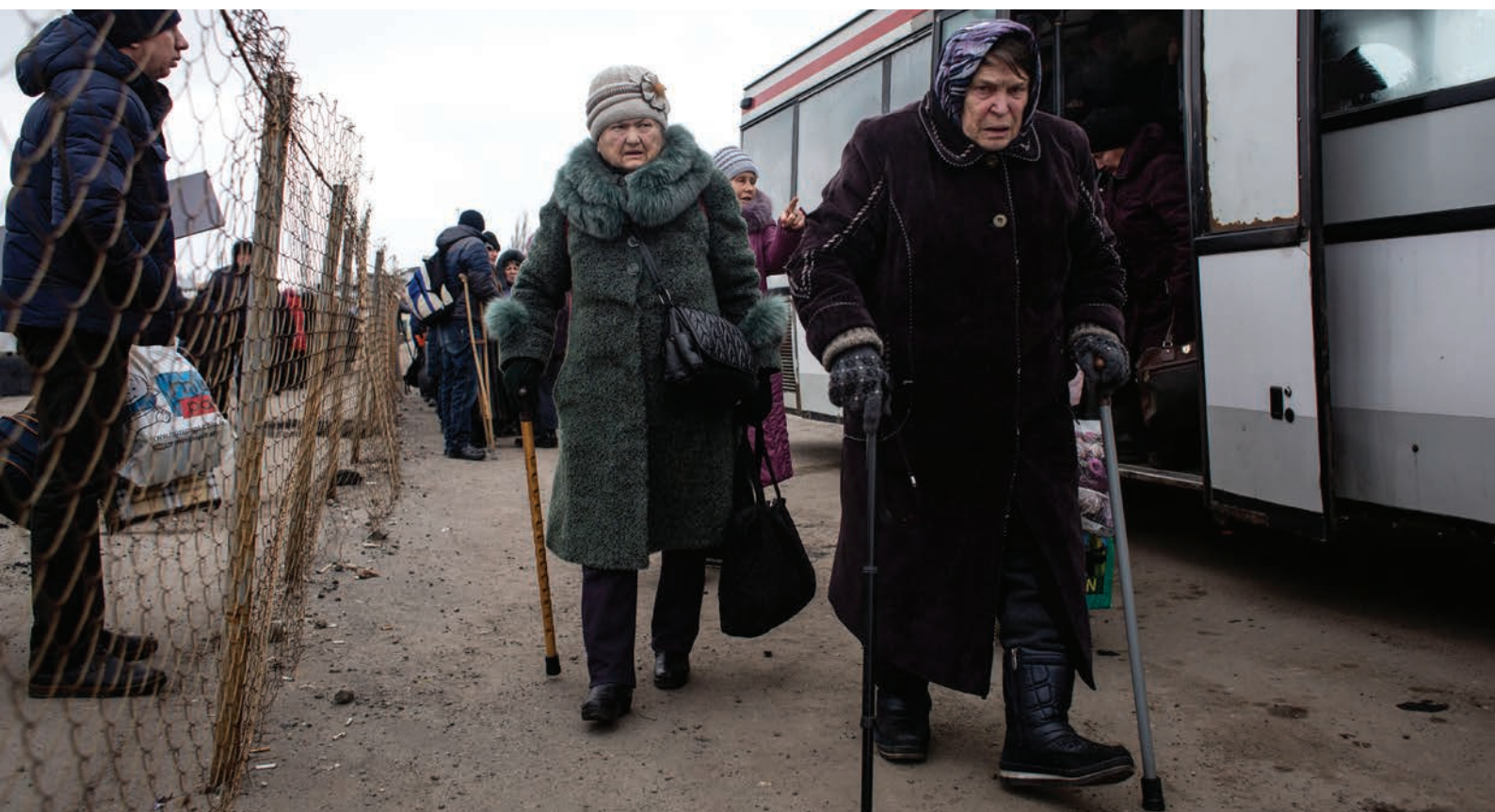
Los residentes en el este de Ucrania cruzan el puesto de control fronterizo entre el área controlada por el gobierno y el área no controlada por el gobierno en Mayorsk, Donetsk (2018).

Según el Defensor del Pueblo, para proteger de manera más predecible y concreta los derechos de las personas desplazadas internas y otros ciudadanos afectados era preciso adoptar cambios legislativos y, en consecuencia, apoyó la propuesta de una nueva ley, titulada "Sobre las modificaciones de ciertas leyes de Ucrania relativas al ejercicio de la derecho a una pensión" (n.º 2083-de 26 de noviembre de 2019) para regular los pagos de la pensión a las personas desplazadas internas y las personas que viven en los territorios temporalmente ocupados de Ucrania.