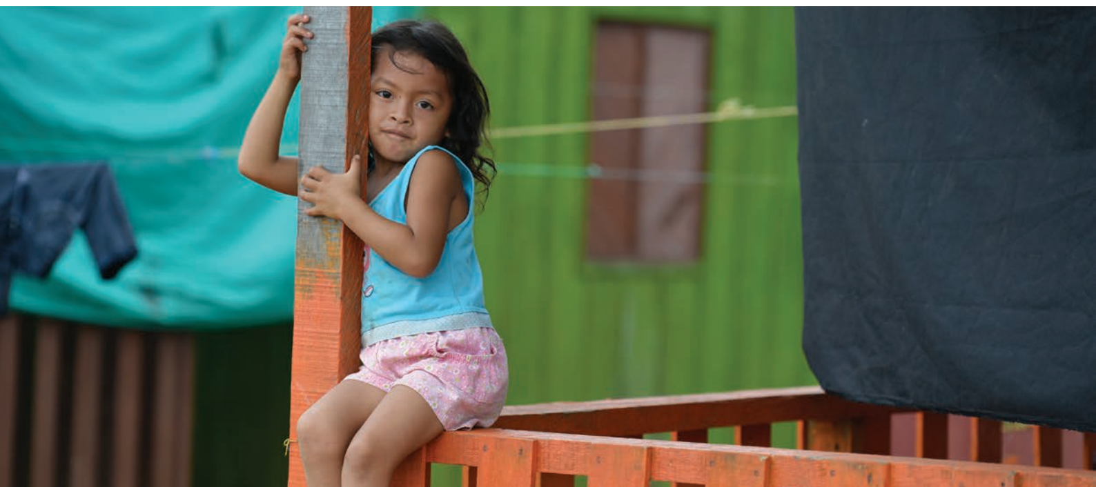
Una niña de cinco años juega en el exterior de la vivienda familiar en un asentamiento para personas desplazadas en Caquetá, Colombia (2013).