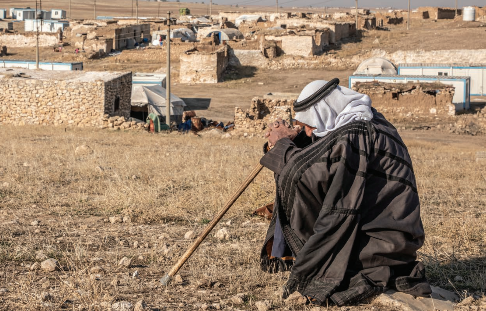
Un anciano retornado sentado cerca de las ruinas de su casa, en una aldea remota de Nínive, en el norte del Iraq (2020).