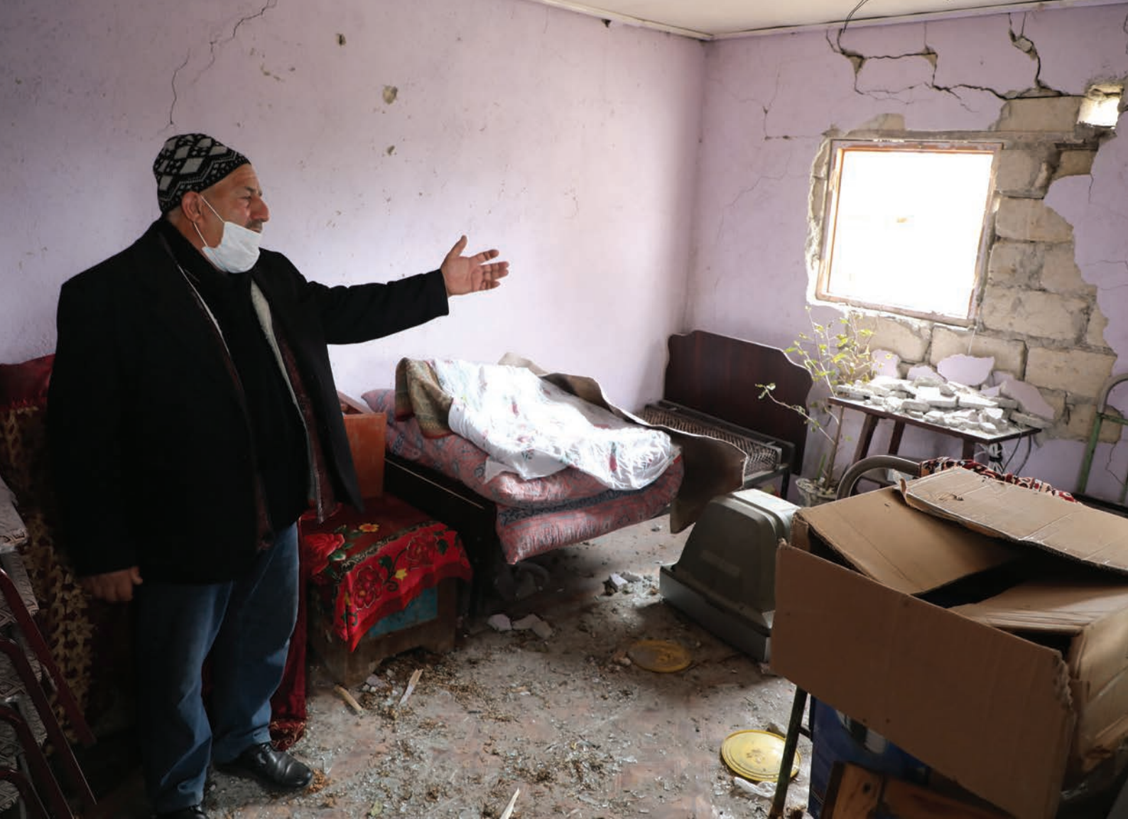
Un desplazado interno azerbaiyano de 66 años fue desplazado del asentamiento de Banovshalar en el distrito de Agdam, cerca del territorio en disputa de Nagorno-Karabaj (2020).