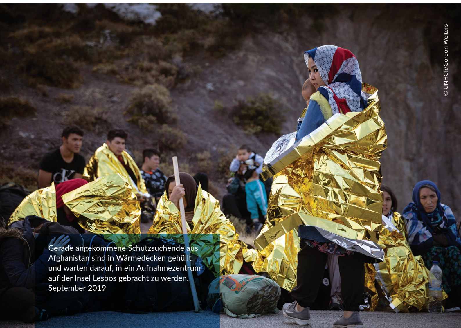
Gerade angekommene Schutzsuchende aus Afghanistan sind in Wärmedecken gehüllt und warten darauf, in ein Aufnahmezentrum auf der Insel Lesbos gebracht zu werden. September 2019

Die Ankünfte an der griechisch-türkischen Landgrenze sind im Vergleich zum Vorjahr um 30 Prozent gesunken. Gründe für den Rückgang scheinen verstärkte Präventivmaßnah-