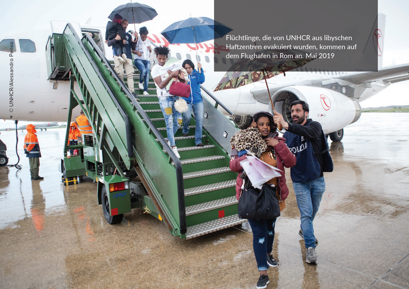
Flüchtlinge, die von UNHCR aus libyschen Haftzentren evakuiert wurden, kommen auf dem Flughafen in Rom an. Mai 2019