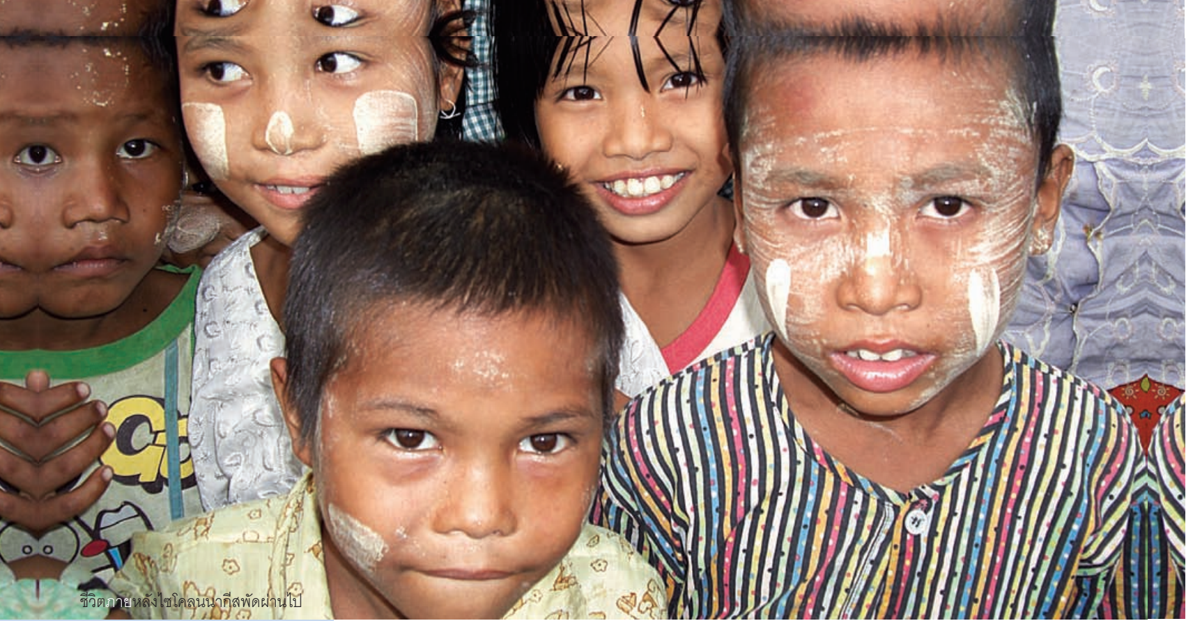
ชีวิตภายหลังไซโคลนนาทิสพัดผ่านไป