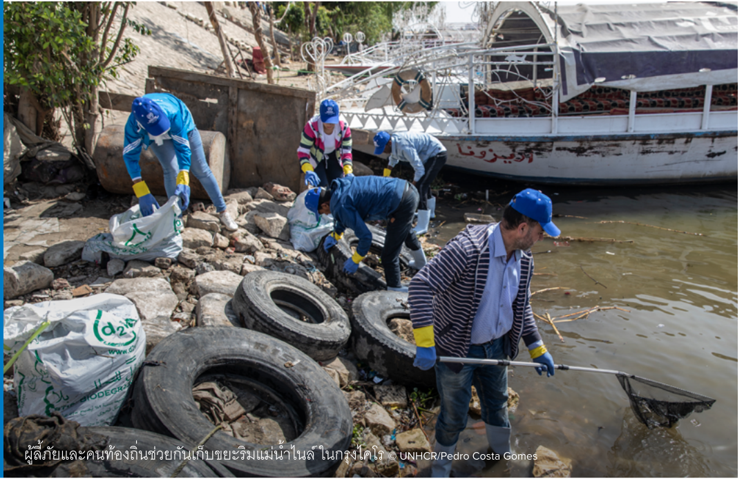
ผู้ลี้ภัยและคนท้องถิ่นช่วยกันเก็บขยะริมแม่น้ำไนล์ ในกรุงไคโร

Refugees in Egypt pitch in to fight plastic pollution in the Nile