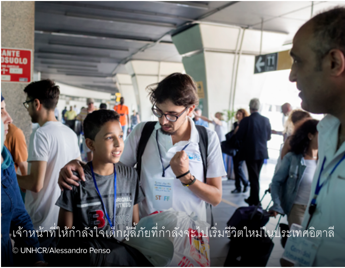
เจ้าหน้าที่ให้กำลังใจเด็กผู้ลี้ภัยที่กำลังจะไปเริ่มชีวิตใหม่ในประเทศอิตาลี

Humanitarian Corridors องค์กรข้ามพรมแดนที่ร่วมมือกับรัฐบาลอิตาลี เพื่อช่วยผู้ลี้ภัยที่เปราะบางที่สุดให้มีโอกาสเริ่มต้นชีวิตใหม่ในประเทศที่สามอย่างปลอดภัย