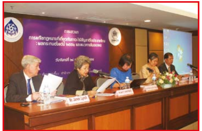
บรรยายภาคในงานเสวนาการแก้ไขกฎหมายเกี่ยวกับภาวะไร้รัฐ

สำนักงานข้าหลวงใหญ่ผู้ลี้ภัยสหประชาชาติ (ยูเอ็นเอชซีอาร์) ร่วมกับคณะกรรมการสิทธิมนุษยชนแห่งชาติจัดเสวนาเรื่อง การแก้ไขกฎหมายเกี่ยวกับภาวะไร้รัฐในประเทศไทย : ผลกระทบตั้งแต่ปี 2551 และแนวทางในอนาคต ในงานยูเอ็นเอชซีอาร์เปิดตัวรายงานเกี่ยวกับภาวะไร้รัฐ 3 ฉบับ คือ รายงานประชุมผู้เชี่ยวชาญระดับภูมิภาค คู่มือสำหรับสมาชิกวุฒิสภา และกรอบการทำงานเพื่อป้องกัน ลด และให้ความคุ้มครองภาวะไร้รัฐ