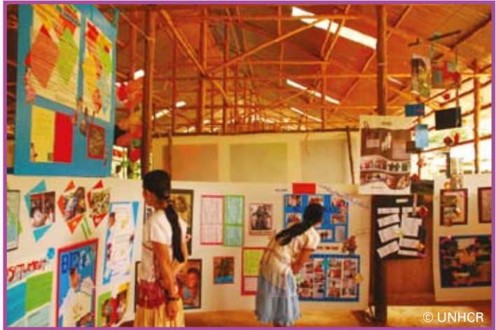
นิทรรศการเกี่ยวกับสิทธิของผู้ลี้ภัยจัดโดยยูเอ็นเอชซีอาร์