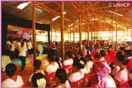
ผู้ลี้ภัยร่วมงานเปิดวันผู้ลี้ภัยในค่ายบ้านต้นยาง