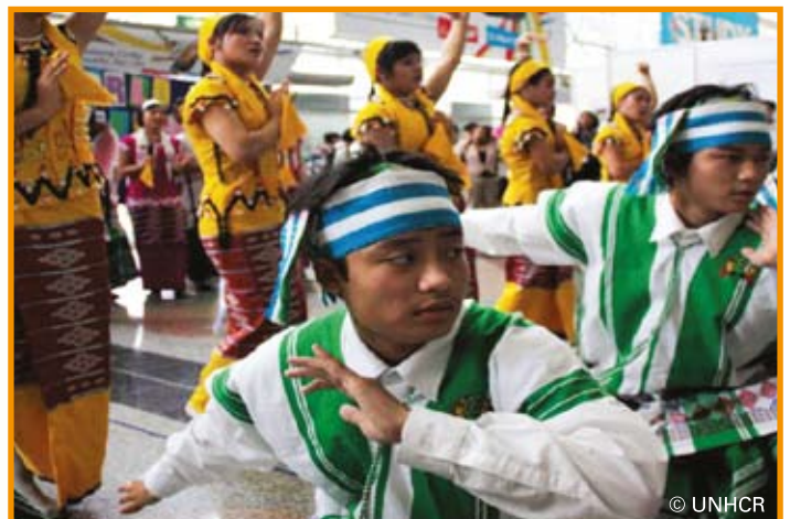
ผู้ลี้ภัยเต้นรำที่สถานีรถไฟในมาเลเซียซึ่งเป็นสถานีรถไฟที่ใหญ่ที่สุดในเอเชีย