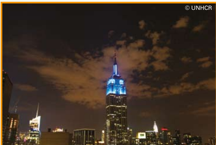
โดมบนสุดของตึกเอ็มไพร์ สเตท เปิดไฟสีฟ้าของยูเอ็นเอชซีอาร์เพื่อระลึกวันผู้ลี้ภัยโลก

ผู้คนหลายล้านคนทั่วโลกร่วมระลึกถึงวันผู้ลี้ภัยโลก ดังเช่นในปีก่อนๆ สถานที่สำคัญของโลกจะเปิดไฟสีฟ้าเป็นสัญลักษณ์ โดยปีที่แล้ว (2553) เป็นครั้งแรกที่ตึกเอ็มไพร์ สเตท ซึ่งมีอายุ 79 ปีในนิวยอร์ก รวมทั้ง โคลอสเซียมในโรม และน้ำพุ เจ็ท โด ในเจนีวา