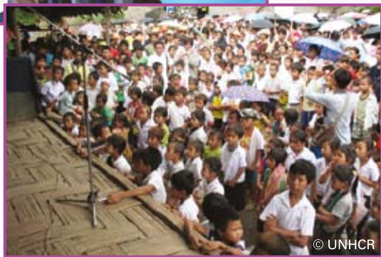
เด็กผู้ลี้ภัยร่วมงานวันผู้ลี้ภัยโลกที่ค่ายบ้านใหม่ในสอย