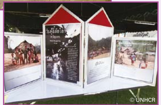
กิจกรรมในค่ายผู้ลี้ภัยที่ อ.แม่เสี้ยว