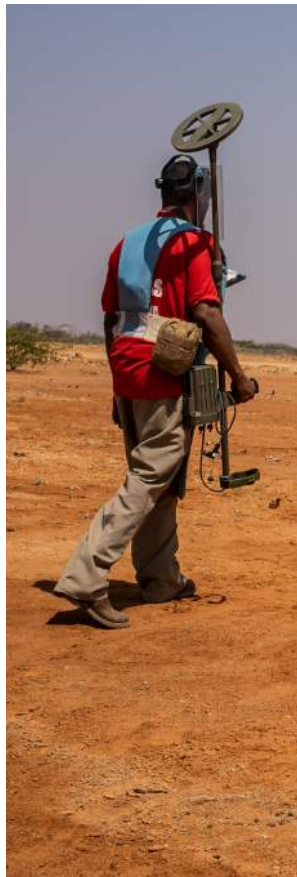
إزالة الألغام في الصومال.