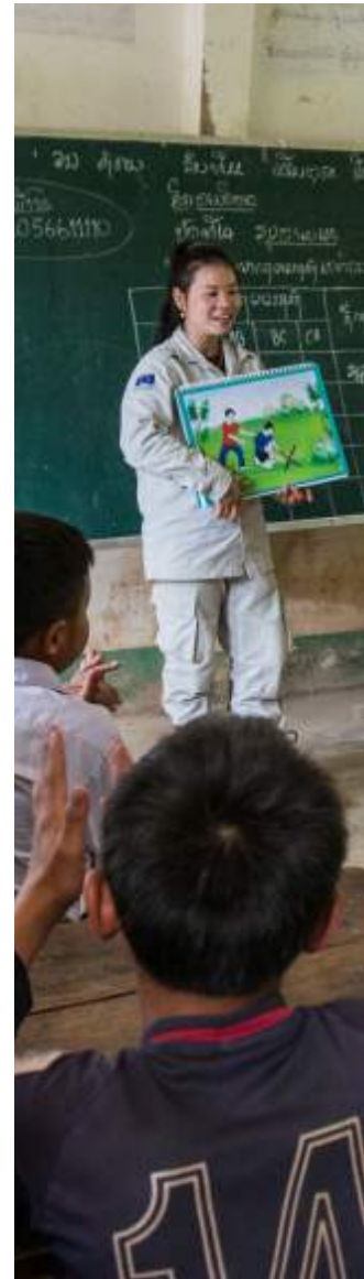
التوعية بالمخاطر في لاوس.