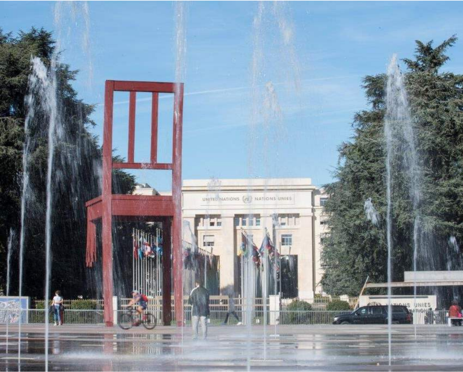
"المقعد المكسور"، الجانب المقابل لقصر الأمم المتحدة في جنيف، سويسرا.

"يجب زيادة تمويل استجابات الحماية، بما في ذلك من خلال المجموعة الفرعية المعنية بمسؤوليات الأعمال المتعلقة بالألغام ضمن المجموعة العالمية للحماية".