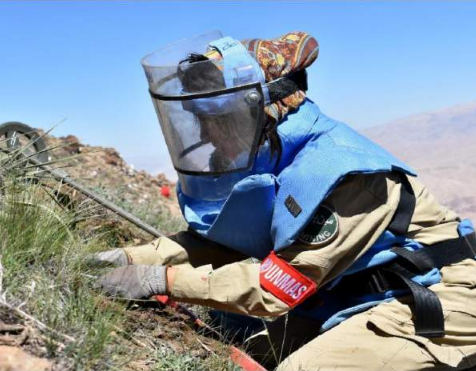
أخصائي إزالة الألغام في أفغانستان.

حماية الأشخاص من مخاطر الانفجارات في حالة الطوارئ الإنسانية: الترويج لحلول شاملة ومحلية ودائمة