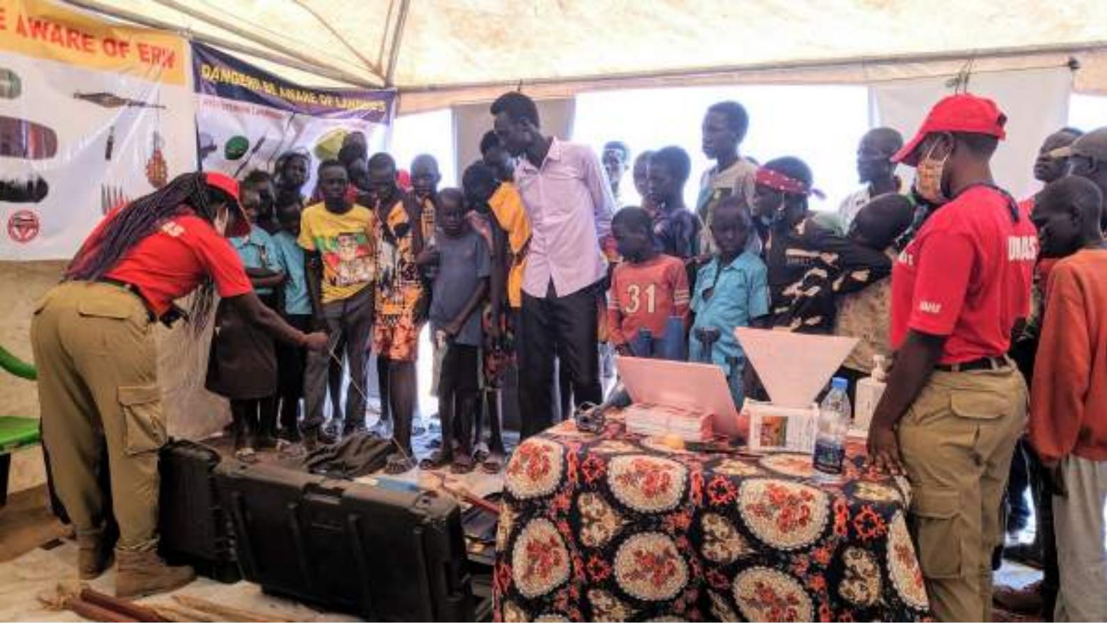
جلسة التوعية بخطر الذئبان المتفجرة (EORE) التي تقيّمها دائرة الأمم المتحدة للأعمال المتعلقة بالألغام (UNMAS) بالشراكة مع منظمة الأغذية والزراعة (الفاو) في واراب، بجنوب السودان، نوفمبر 2021.