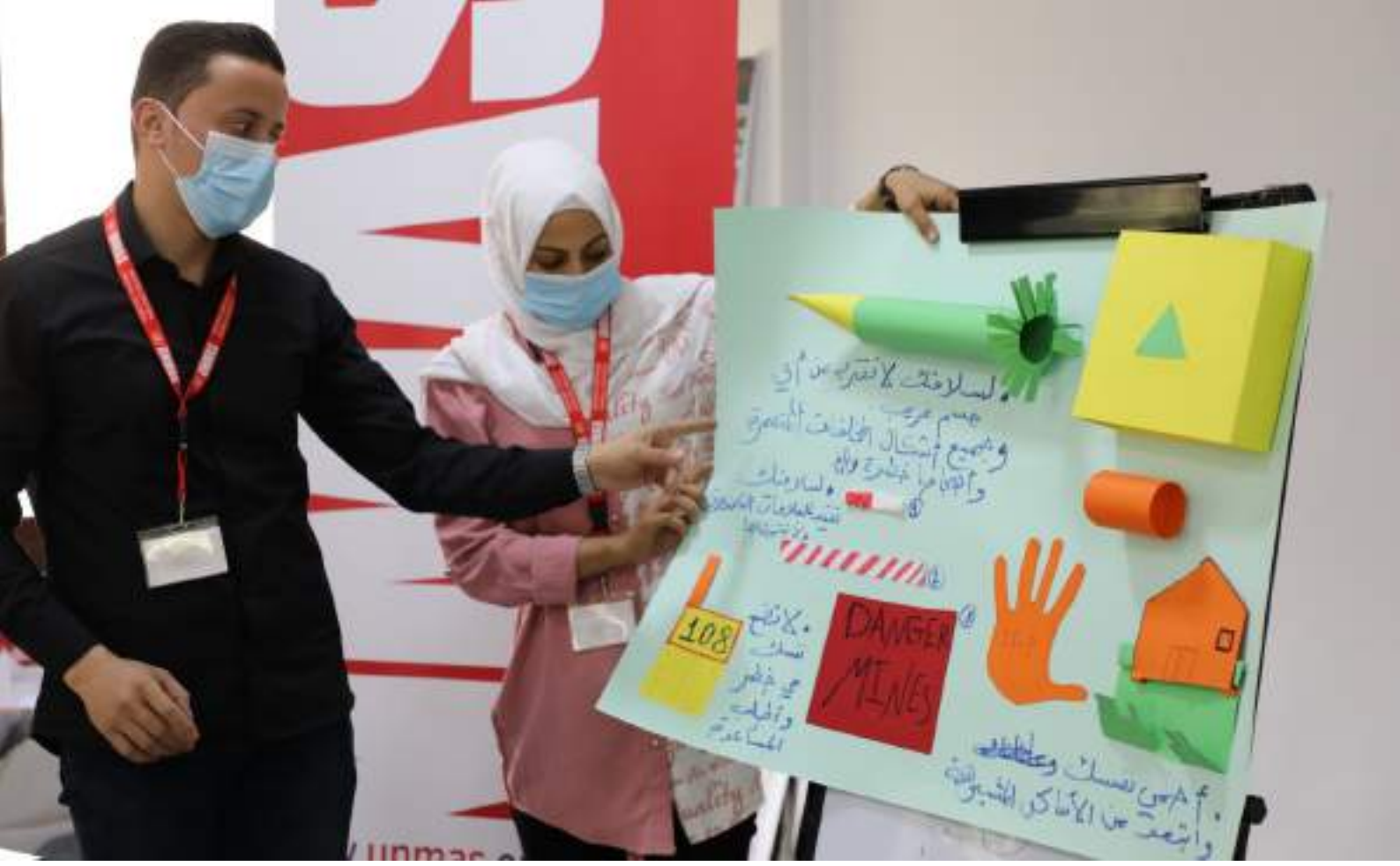
جلسة توعية عن الذخائر المتفجرة مع الزملاء في مجالات العمل الإنساني في دمشق، سوريا، نوفمبر 2021، صورة حقوق ملكيتها محفوظة للأمم المتحدة/فرانثيسكا شياوداني.