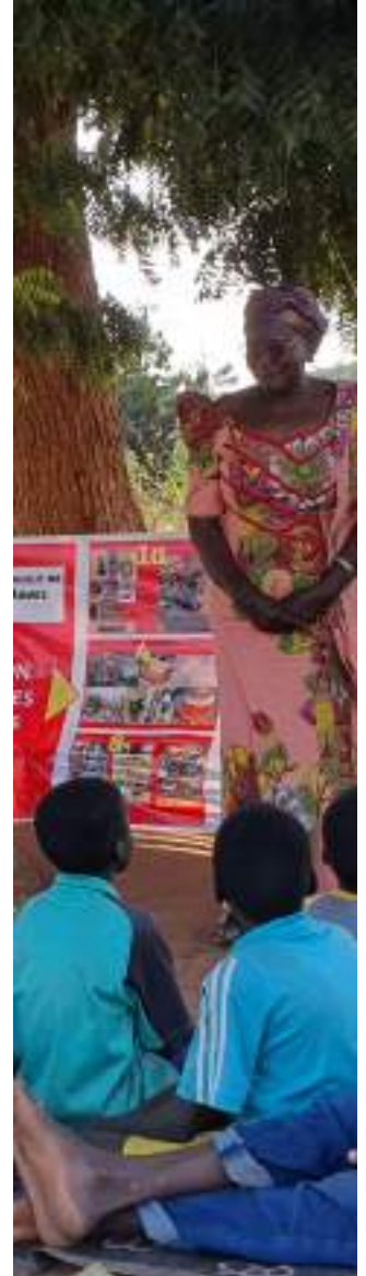
تعقد جمعية AMMIE جلسة توعية حول المخاطر مع المجتمع المحلي في كورسيمورو، في بوركينا فاسو. أكتوبر 2021