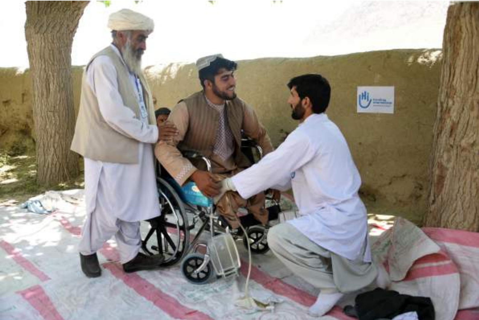
مساعدة الضحايا في أفغانستان صورة: العمل الإنساني والإدماج