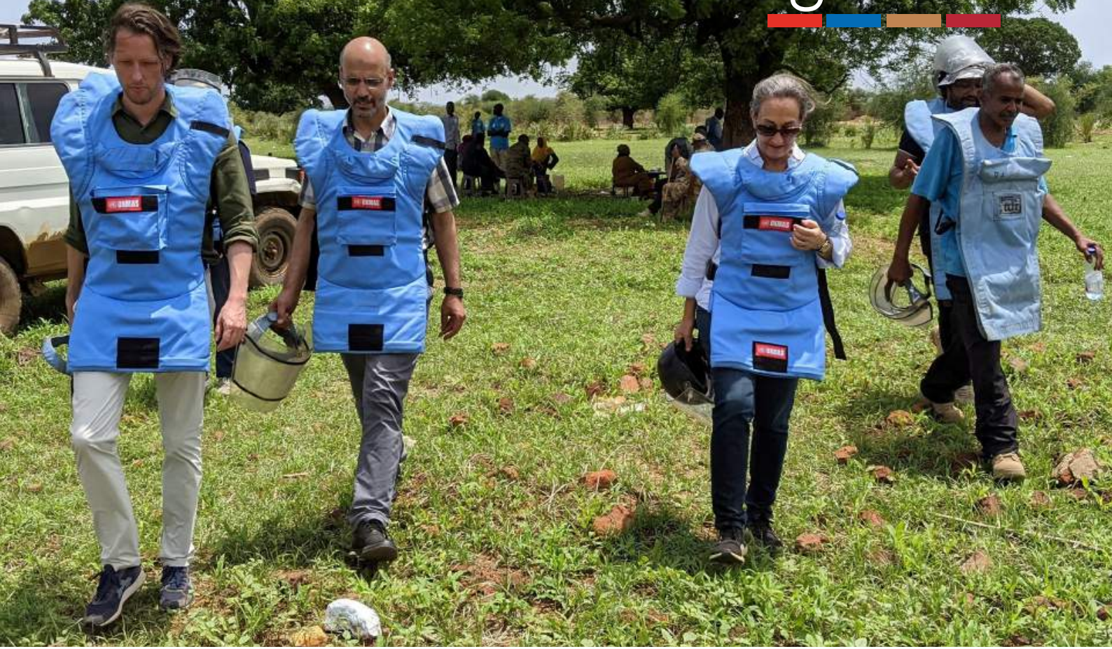
مديرة دائرة الأمم المتحدة للأعمال المتعلقة بالألغام بالإبابة، إيلين كوهن، تزور عمليات دائرة الأمم المتحدة للأعمال المتعلقة بالألغام في السودان، يونيو 2021.