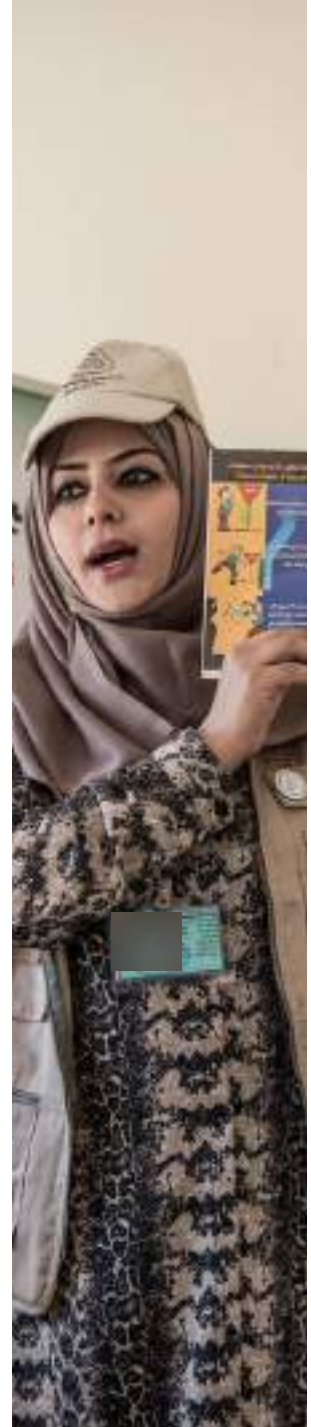
التوعية بالمخاطر في العراق.