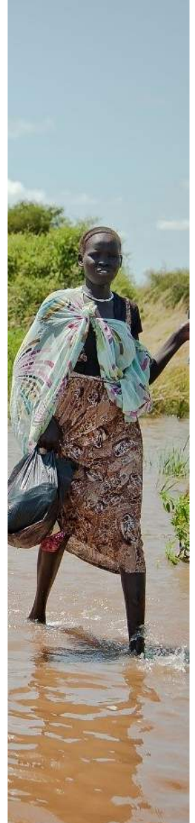
تغير المناخ الفيضان.