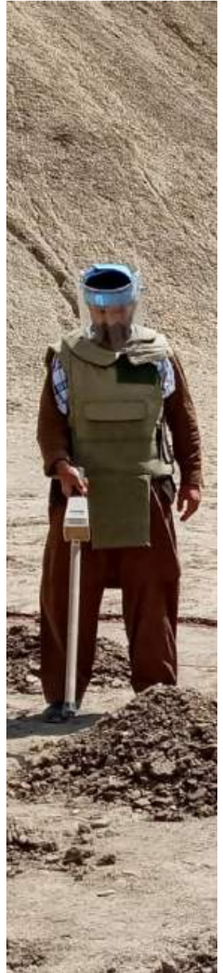
إزالة الألغام في أفغانستان.