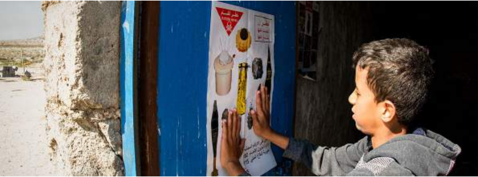
التوعية بمخاطر الألغام في البصرة بالعراق، صورة: المجلس الدنماركي للاجئين

يتم الاستعانة بالمبادئ التالية لتوجيه المجموعة الفرعية المعنية بمسؤوليات الأعمال المتعلقة بالألغام وتنفيذ هذه الإستراتيجية: