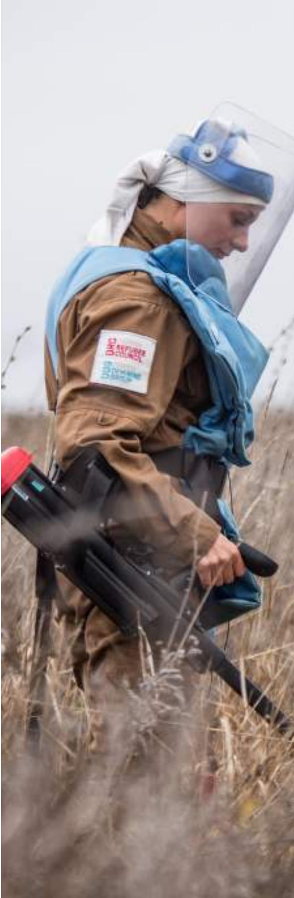
أخصائي إزالة الألغام في أوكرانيا

يتمثل الغرض من هذه الإستراتيجية، وهي الأولى من نوعها، في تقديم جدول أعمال جماعي توافق عليه أعضاء المجموعة الفرعية العالمية المعنية بمسؤوليات الأعمال المتعلقة بالألغام (MA AoR). وهي تعد مكملة لإجراءات التشغيل القياسية الفنية (SOPs) الخاصة بالمجموعة الفرعية العالمية المعنية بمسؤوليات الأعمال المتعلقة بالألغام (MA AoR). تركز هذه الاستراتيجية على رؤية استراتيجية الأمم المتحدة للإجراءات المتعلقة بالألغام للفترة 2019-2023 المتمثلة في "عالم خالٍ من تهديد الألغام والمتفجرات من مخلفات الحرب، بما في ذلك الذخائر العنقودية والمتفجرات يدوية الصنع حيث يعيش الأفراد والمجتمعات في بيئة آمنة مواتية على تحقيق السلام والتنمية المستدامين" وعلى رؤية الإطار الاستراتيجي العالمي لمجموعة الحماية للفترة 2020-2024 حيث تتم توفير الحماية للناس في الأزمات الإنسانية واحترام حقوقهم وإيجاد الحلول لهم وفقاً للقانون الدولي".