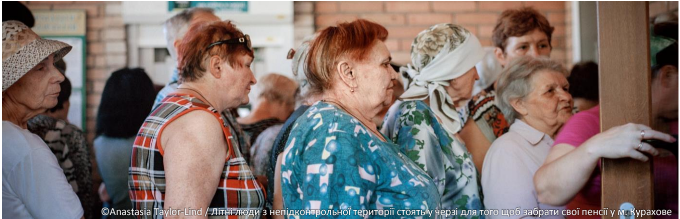
Літні люди з невідконтрольної території стоять у черзі для того щоб забрати свої пенсії у м. Курахово