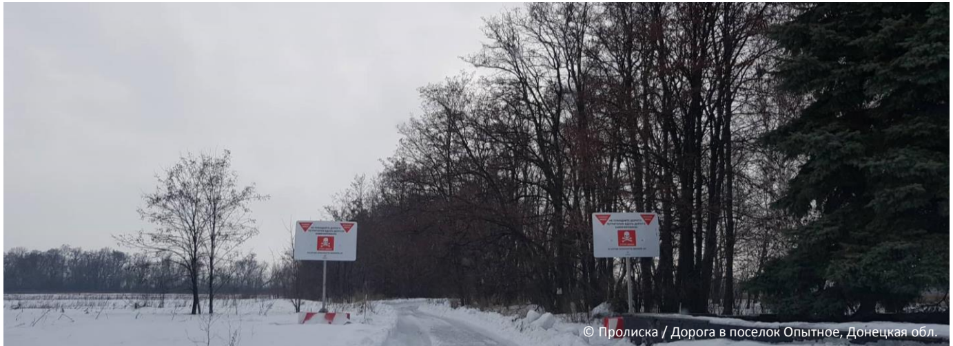
Дорога в поселок Опытное, Донецкая обл.

КЛАСТЕР ПО ВОПРОСАМ ЗАЩИТЫ ВКЛЮЧАЕТ СУБКЛАСТЕРЫ ПО ВОПРОСАМ ЗАЩИТЫ ДЕТЕЙ, ГЕНДЕРНОГО НАСИЛИЯ И ПРОТИВОМИННОЙ ДЕЯТЕЛЬНОСТИ