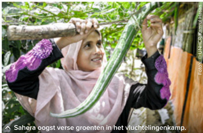
^ Sahera oogst verse groenten in het vluchtelingenkamp.