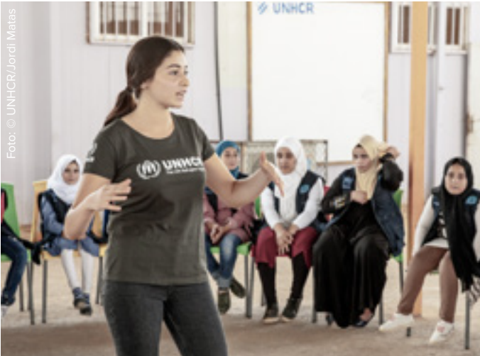
^ Een bezoek aan het vluchtelingenkamp Za'atari in Jordanië.