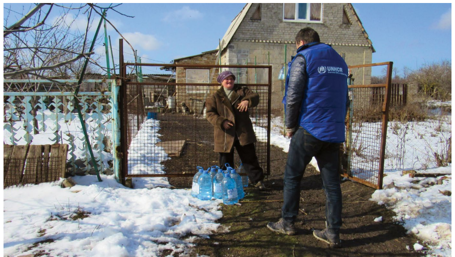
УВКБ ООН доставляє воду в постраждале від конфлікту село Водяне Донецької області.

Учасник фокус-групи в Миронівці (Донецька область, червень 2021 р.).