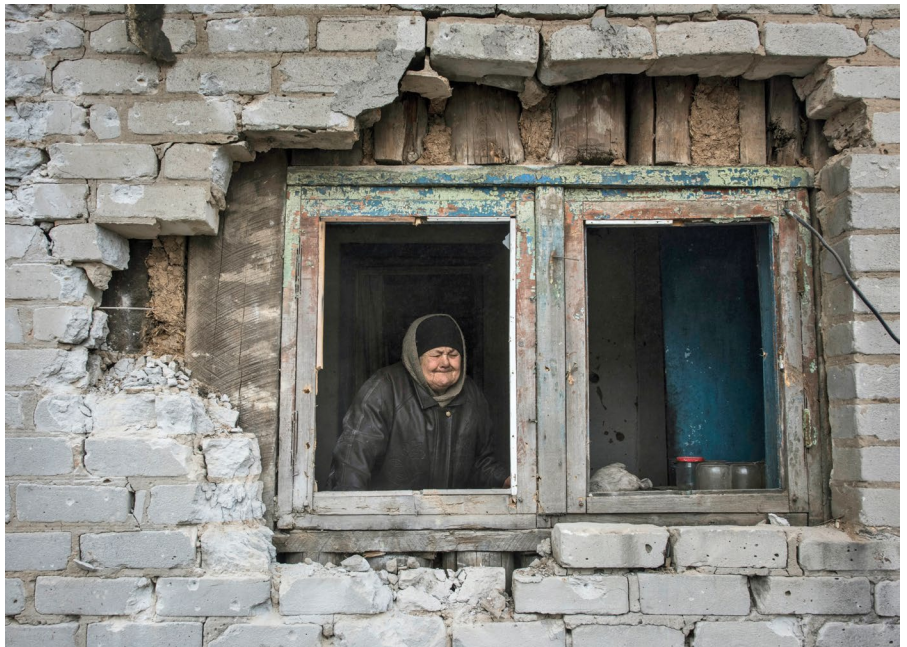
Жінка сидить перед вікном у пошкодженому будинку біля лінії розмежування, м. Дебальцеве, Донецька обл.