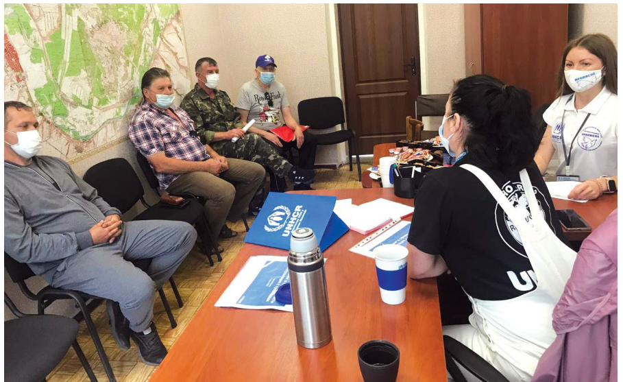
Обговорення у фокус-групі в Трохізбенці Луганської області.

доступу до можливостей працевлаштування, ринків, центрів зайнятості, продуктів харчування та/або банківських послуг. Примітно, що лише у 4 населених пунктах, де проводився моніторинг, населення вважає, що має достатній доступ до засобів до існування та комерційних послуг, і це все великі міста з хорошою інфраструктурою та регулярним доступом до громадського транспорту. Із 74 населених пунктів (в яких мешкає понад 19 000 осіб), в яких повідомлялося про серйозні або критичні прогалини, пов'язані з доступом до засобів до існування, щонайменше 50 – розташовані в зоні 0 - 5 км (із середнім населенням 260 мешканців на населений пункт).