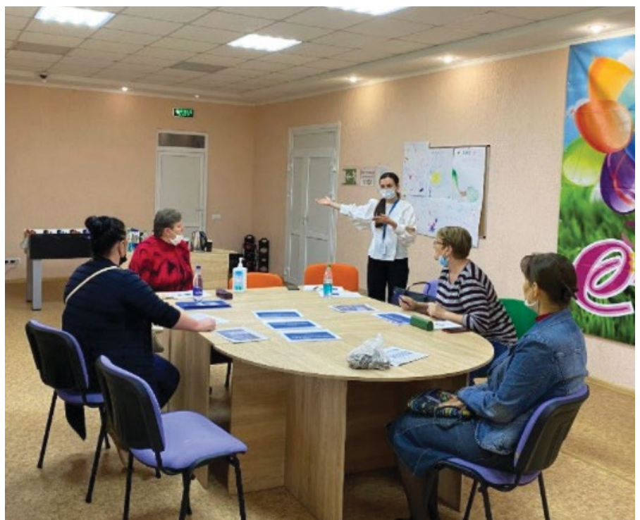
Обговорення у фокус-групі у Верхньоторецьку Луганської області.

Під час обговорень у фокус-групах громади підтвердили свою стурбованість проблемами ГОН та пояснили критичний вплив низки факторів на безпеку жінок і дівчат, що описано нижче.