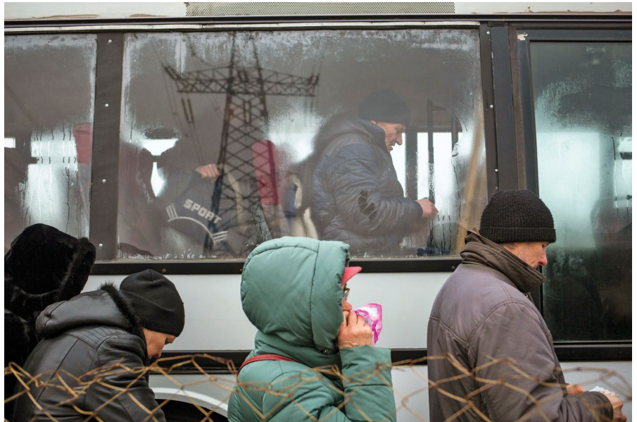
Мешканці сходу України перетинають пункт пропуску між підконтрольною уряду територією та непідконтрольною територією, м. Майорськ, Донецька область, 2018.

Учасник фокус-групи у Миронівці (Донецька область).