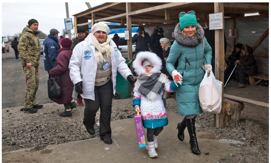
Мешканці сходу України перетинають пункт пропуску між підконтрольною уряду територією та невідконтрольною територією, м. Майорськ, Донецька область, 2018.

Варто зазначити, що під час консультацій з громадою, коли людей запитували про вплив наявності блок-постів чи інших обмежень на їхнє повсякденне життя, учасники підкреслювали, що основним джерелом занепокоєння щодо свободи пересування насправді було встановлення лінії розмежування та відповідні обмеження перетину контрольних пунктів в'їзду-виїзду (КПВВ). Механізми підтримки родини, власності та громад та наявні по обидва боки лінії розмежування – отже, поточні обмеження також впливають на механізми подолання, добробут та стійкість населення.