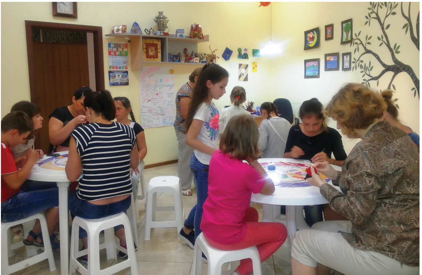
Діти-ВПО із постраждалих від конфлікту районів Донецька відвідують громадський центр за підтримки УВКБ ООН та під керівництвом ГО «Максимал» у Донецькій області, 2017

Нарешті, враховуючи зазначені вище проблеми, у рамках моніторингу також оцінювалася наявність громадських центрів чи інших неформальних приміщень, які могли б створити можливості для мобілізації громади. Приміщення для зібрань важливі для соціальної згуртованості та інших заходів, таких як надання гуманітарної допомоги, психосоціальні послуги, відпочинок для дітей і особливо для того, щоб дати можливість мешканцям самоорганізуватися та мати можливість відстоювати свої інтереси перед владою. Ці центри також можуть використовуватися мобільними групами для надання адміністративних, соціальних або медичних послуг на місцевому рівні. Половина населених пунктів, де проводився моніторинг (78), повідомили, що у мешканців немає громадських місць для зустрічей.