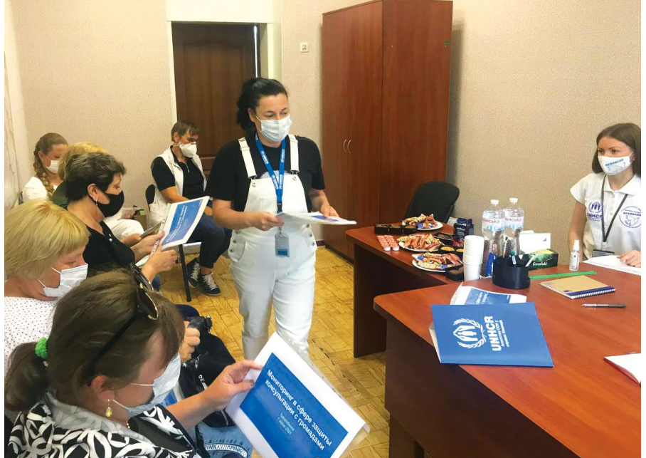
Обговорення у фокус-групі в Миронівці (Донецька область), 2021

Після консолідації кількісних показників у дев'яти населених пунктах із критичними або серйозними значеннями індексів були проведені консультації у фокус-групах (див. Шкалу індексу тяжкості нижче). На консультаціях у фокус-групах результати моніторингу були переглянуті загалом 111 мешканцями. Метою таких обговорень було розглянути результати та визначити причини основних проблем, пріоритети громади, механізми подолання та можливості реагування. Із загальної кількості учасників консультацій з громадою половину становили жінки, 31% – люди похилого віку, 11% – особи з інвалідністю та 8% – ВПО.