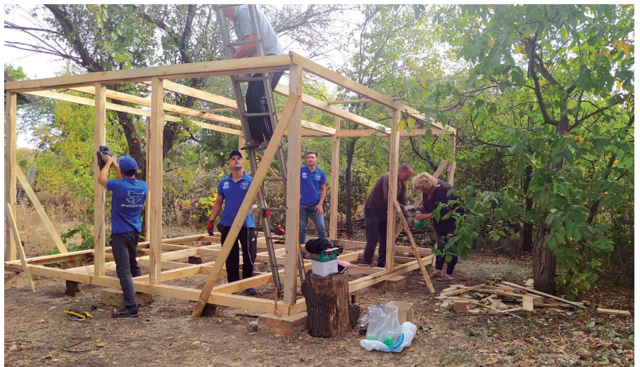
Партнерська організація УВКБ ООН НУО «Проліска» допомагає будувати відкриту терасу, де місцева громада з 105 осіб зможе проводити збори громади та зустрічі з представниками НУО, село Травневе, Донецька область, 2021