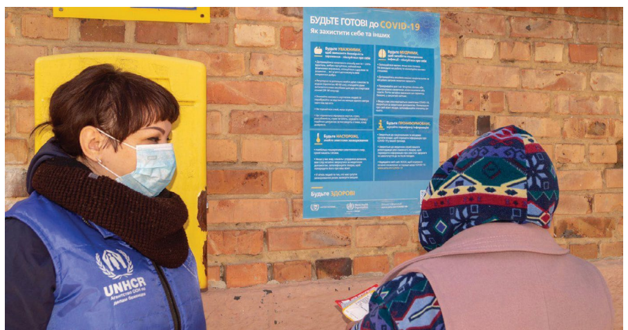
УВКБ ООН та його партнерські організації на сході України розповсюджують інформаційні COVID-19 плакати від ВООЗ у Донецькій та Луганській областях для підвищення обізнаності про коронавірусне захворювання серед місцевого населення, 2020 © ГО «Проліска».

Департаменти соціального захисту населення (ДСЗН) є лише в 14 населених пунктах, де проводився моніторинг (населення понад 100 500 осіб), а це означає, що в інших населених пунктах мешканцям необхідно користуватися громадським транспортом, коли їм потрібно доїхати до ДСЗН. За даними КІ, мешканці 65 населених пунктів (приблизно 144 000 осіб) можуть дістатися до ДСЗН за допомогою громадського транспорту,