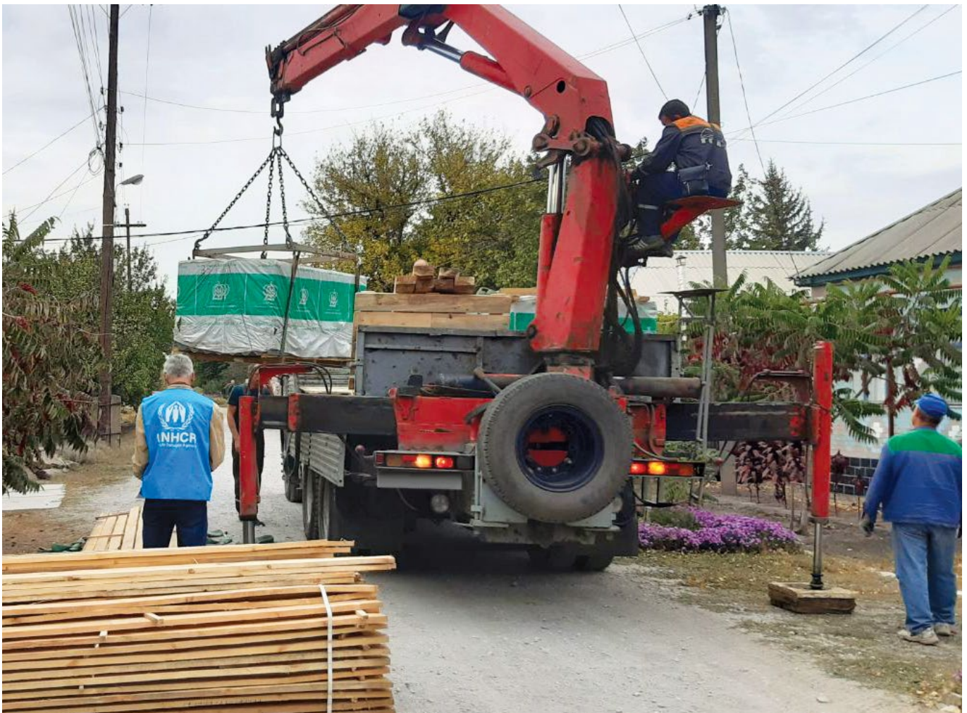
УВКБ ООН доставляє будівельні матеріали для надання житла в населених пунктах уздовж лінії розмежування, Луганська область, 2021