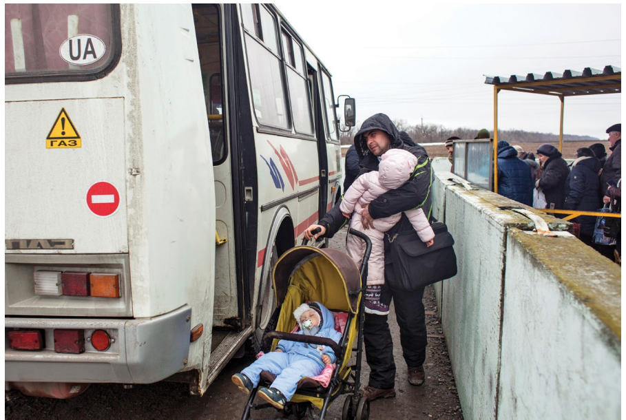
Чоловік з двома дітьми сідає в автобус на КПВВ у Мар'їнці під час поїздки до непідконтрольної уряду території, 2018 рік.

Учасник фокус-групи в Тарамчуці (Донецька область, червень 2021 р.).