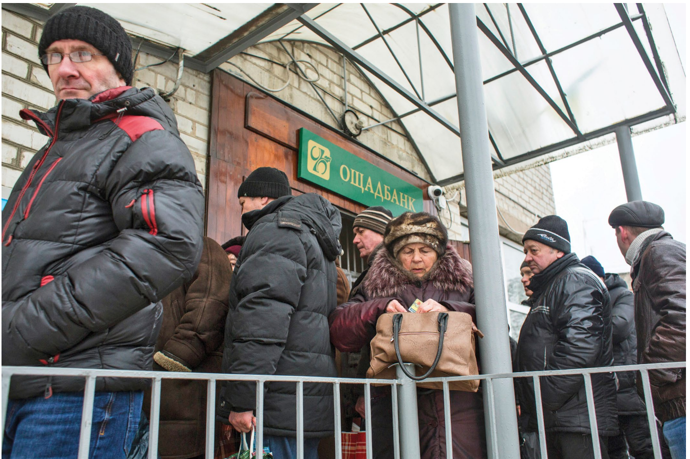
Мешканці віддалених сіл на сході України приїхали знімати пенсії в Ощадбанку у пункті пропуску через КПВВ «Новотроїцьке», Донецька область, 2018 р.

Нарешті, в населених пунктах, де проводився моніторинг, повідомляється, що доступ до поштових відділень і банків є проблемою, особливо в ізольованих населених пунктах, розташованих у зоні 0 - 5 км. Більшість населення, яке проживає поблизу лінії розмежування, є вразливим і значною мірою похилого віку – багато з них мають обмежену мобільність і дуже залежать від пенсій та соціальних виплат для покриття своїх основних потреб (особливо в умовах обмеженого доступу до засобів на коматів) або поштових відділень (для отримання пенсій).