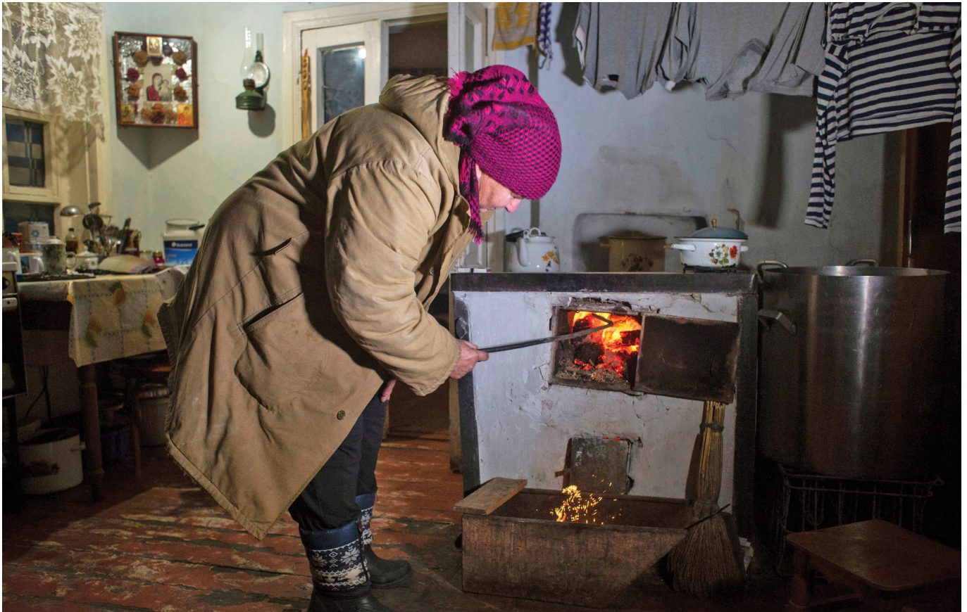
Літня жінка розпалює піч вугіллям, наданим УВКБ ООН у селі Золоте 3, Луганської області

Повідомляється, що доступ до води ускладнений у 24 населених пунктах, де проводився моніторинг, із загальним населенням 13 500 осіб (79 % знаходяться в зоні 0 - 5 км). Серед цієї групи щонайменше 17 населених пунктів повідомляють, що вони не підключені до системи водопостачання, а ще 7 повідомляють про регулярні відключення води, в тому числі через часті обстріли водопровідних насосних станцій. Під час обговорень у фокус-групах громади пояснили, що до конфлікту вони мали постійний доступ до води, оскільки водопостачання було централізоване. Однак з 2015 року водопровідні компанії, які залишилися на непідконтрольній уряду території, припинили постачання води в деяких районах, і тепер мешканцям доводиться купувати воду або покладатися на колодязі. Але вода з колодязів непридатна для пиття, а в деяких випадках колодязі недоступні через їхнє розта-