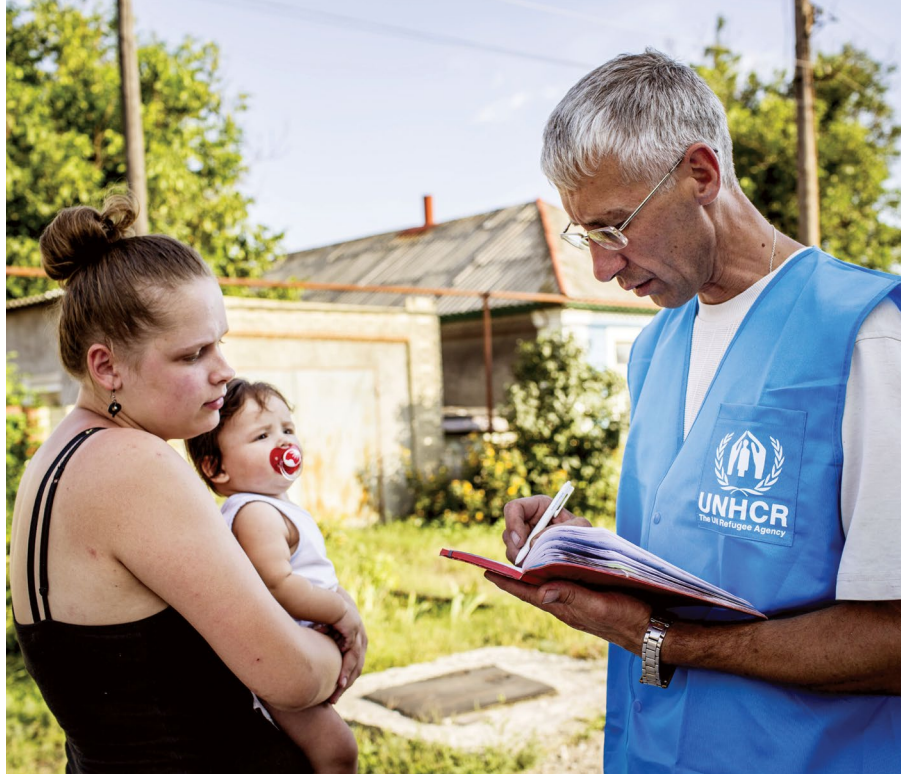
Співробітники УВКБ ООН розмовляють з місцевою жінкою в селі, яке сильно постраждало під час бойових дій 2014 року в Луганській області

Аналіз середніх показників свідчить, що найбільш серйозні проблеми у сфері захисту були пов'язані з доступом до соціальних