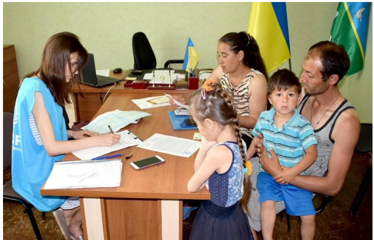
Співробітниця партнерської організації УВКБ ООН «Десяте квітня» під час надання консультації багатодітній сім'ї без документів.

Україна створила електронний реєстр свідоцтв про народження тільки у 2008 році. Державний реєстр актів цивільного стану громадян не містить повної інформації щодо реєстрації народжень, що мали місце до 2008 року, і це ускладнює видачу документів, що посвідчують особу дітям, народжених на НКТ чи в Криму до 2008 року, оскільки альтернативне підтвердження – паперові файли – недоступне. ДМС вимагає, щоб діти отримували дублікат свідоцтва про народження, що призводить до затримок у отриманні документу, що посвідчує особу.