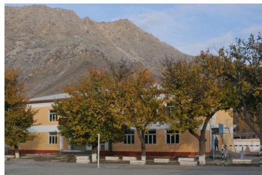
Сох, Узбекистан (ноябрь 2011 г.) – Одна из школ, перестроенных после землетрясения, произошедшего в июле 2011 года.

Для получения дополнительной информации, пожалуйста, посетите www.unicef.org/health/uzbekistan_60378.html