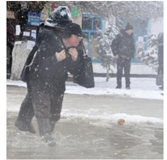
Темирлановка, Казахстан (20 февраля 2012) – Пешеходы переходят затопленную улицу

Общество Красного Полумесяца РК оказывает гуманитарную помощь 4,000 пострадавшим. Операция продолжится до конца мая 2012.