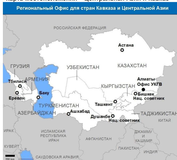
Границы, имена и обозначения, показанные на этой карте, не подразумевают официальной поддержки или признания системой ООН. Окончательный статус Джамму и Кашмира не определен сторонами. Карта была создана в марте 2012 года.

Согласно глобальной модели УКГВ ООН 2012, определяющей вероятность потребности в помощи извне в случае крупномасштабного происшествия, 6 стран региона находятся в зоне высокого риска опасности и имеют ограниченные возможности для эффективного реагирования на ЧС. Данная модель анализирует риски возникновения крупных ЧС, уязвимость и способность справляться с последствиями ЧС. Согласно оценкам этой модели, в случае крупной ЧС в 2012 году УКГВ ООН будет отведена ключевая роль в реагировании в Армении, Кыргызстане и Таджикистане.