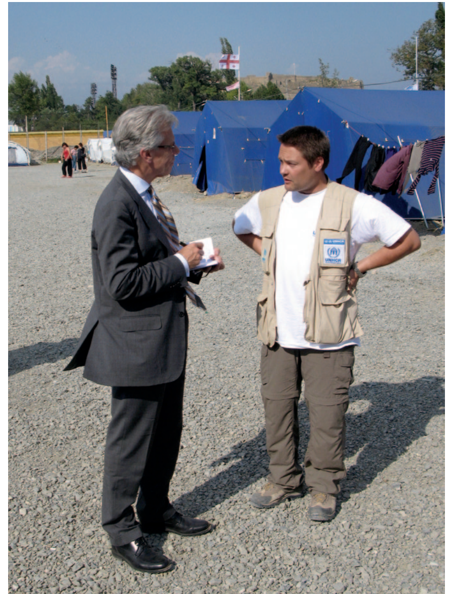
Бывший Верховный Комиссар ОБСЕ по делам национальных меньшинств Кнут Фоллебек (Knut Vollebaek) опрашивает сотрудника УВКБ в лагере ВПЛ около Гори. Сентябрь 2008 г.