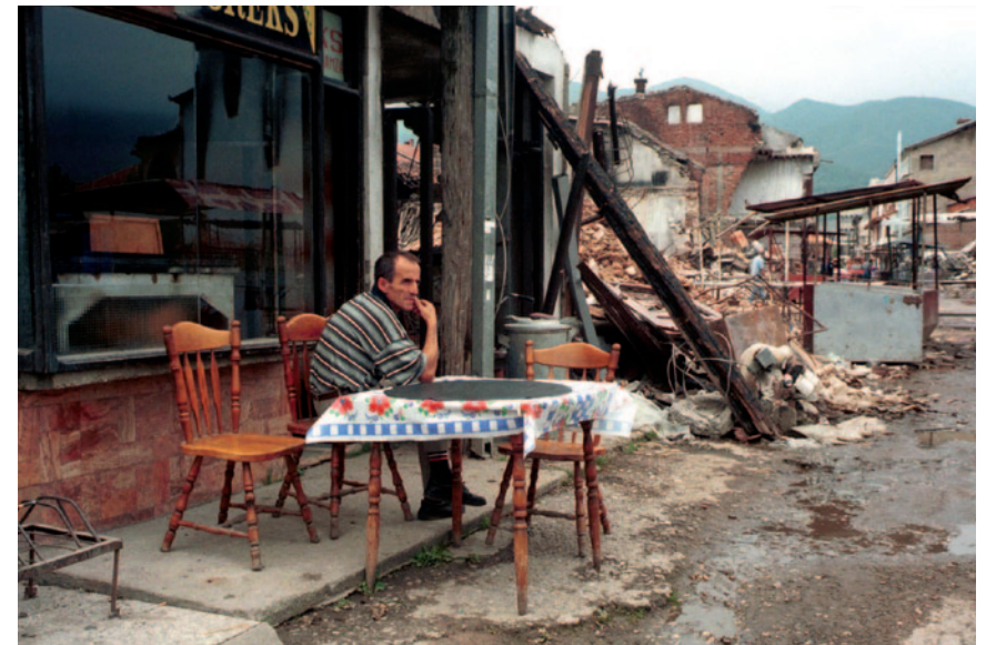
Возвращение владельца магазина в разрушенную деревню Пейя/Печ (Косово). Лето 1999.