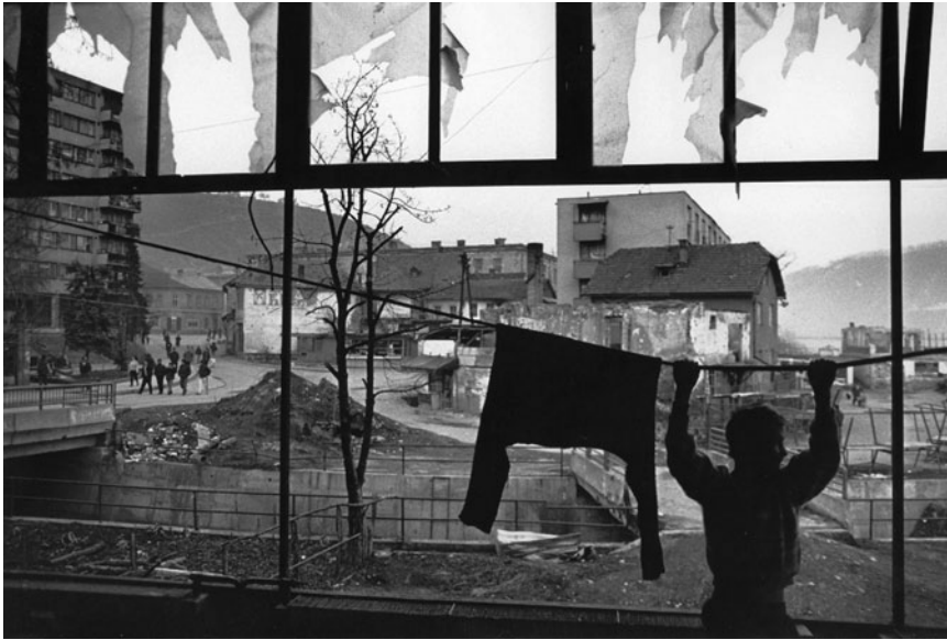
Быстрое восстановление и реконструкция разрушенных во время войны жилищ – главное условие для репатриации и возвращения почти двух миллионов перемещенных лиц. Февраль 1995 г.