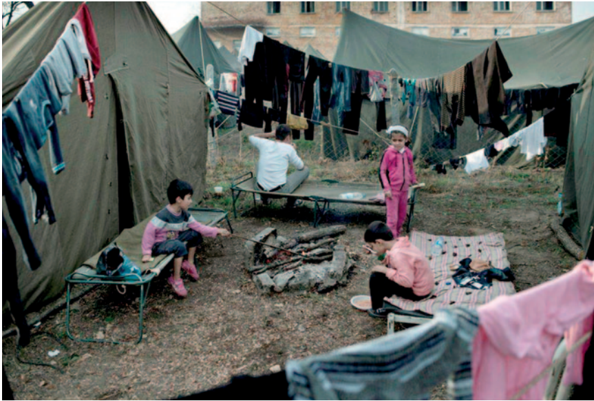
Сирийские дети сидят у костра перед своими палатками. Контейнерно-палаточный лагерь в Харманли (Болгария). Ноябрь 2013 г.