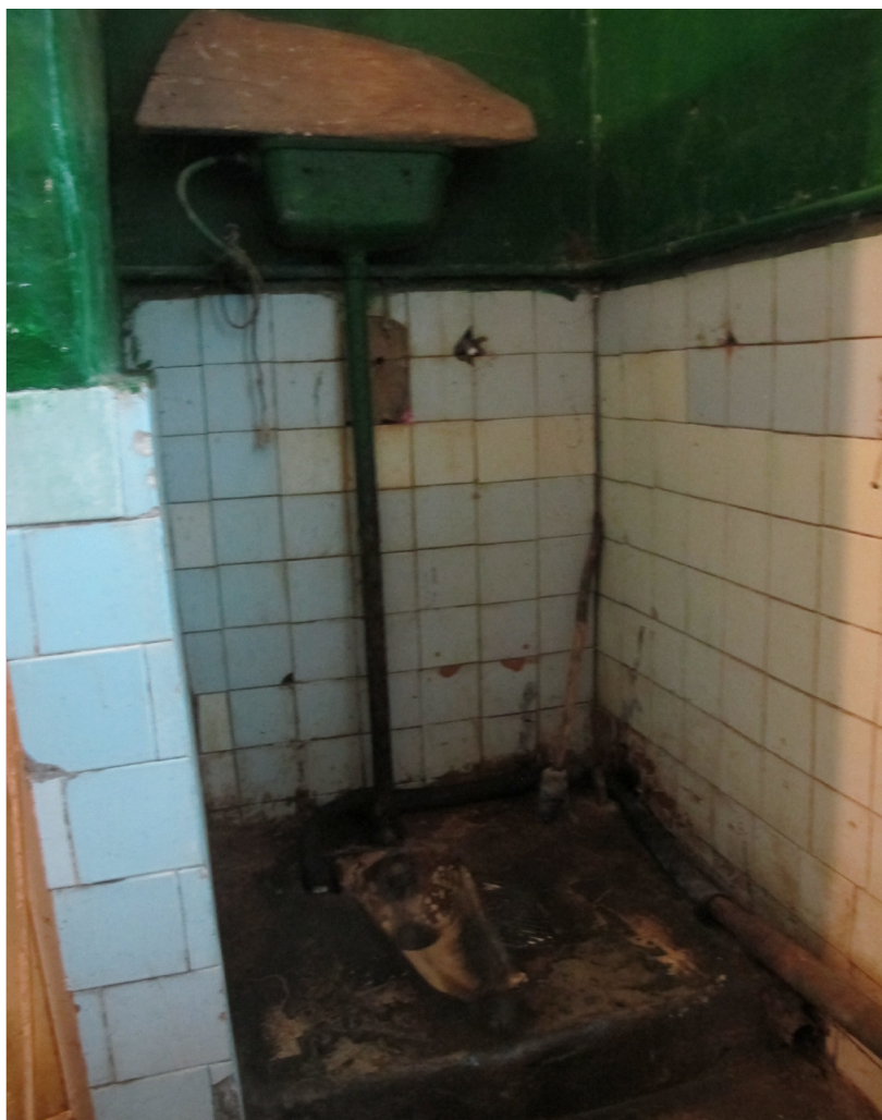
Ванная комната в пенитенциарном заведении в Липкани.