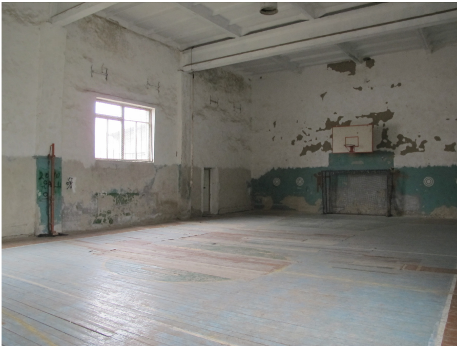
Спортивный зал в пенитенциарном заведении в Липкани.

предусмотренного распорядка дня, один спортивный зал внутри помещения, комната для игр и библиотека.