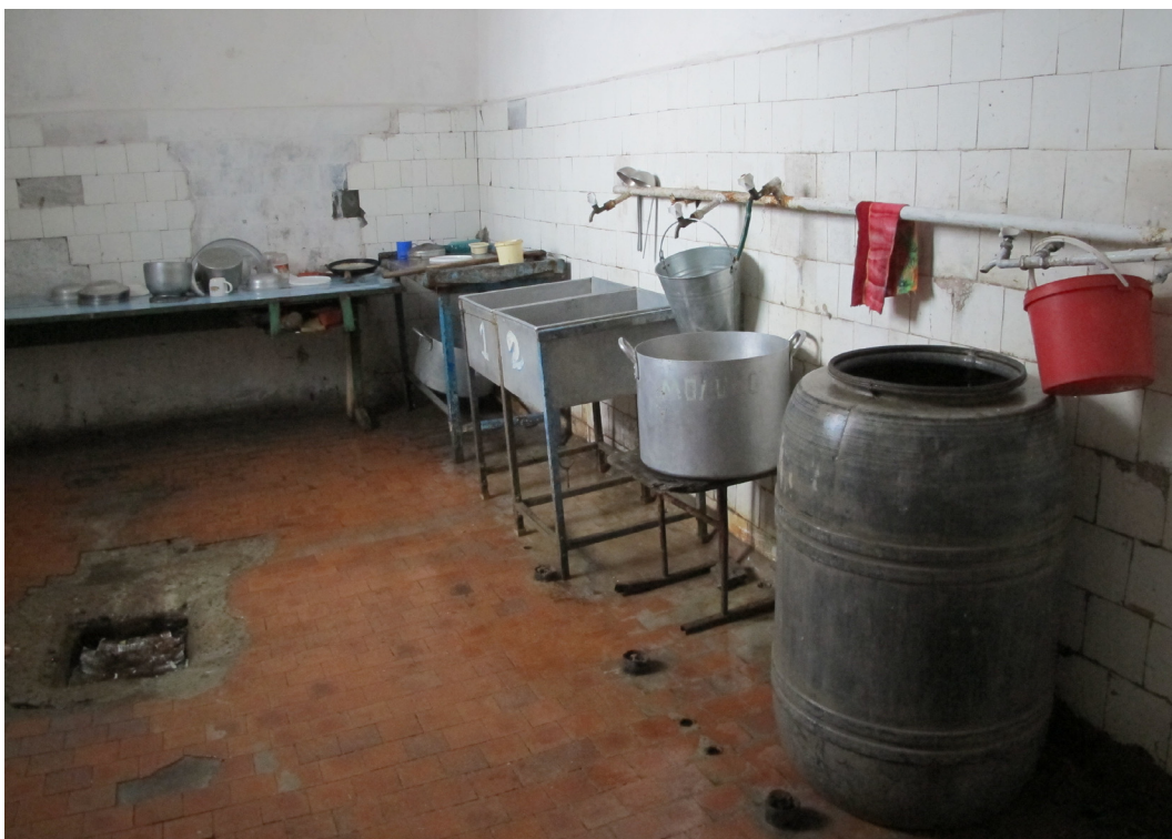
Дровяная кухня в пенитенциарном заведении в Липкани.